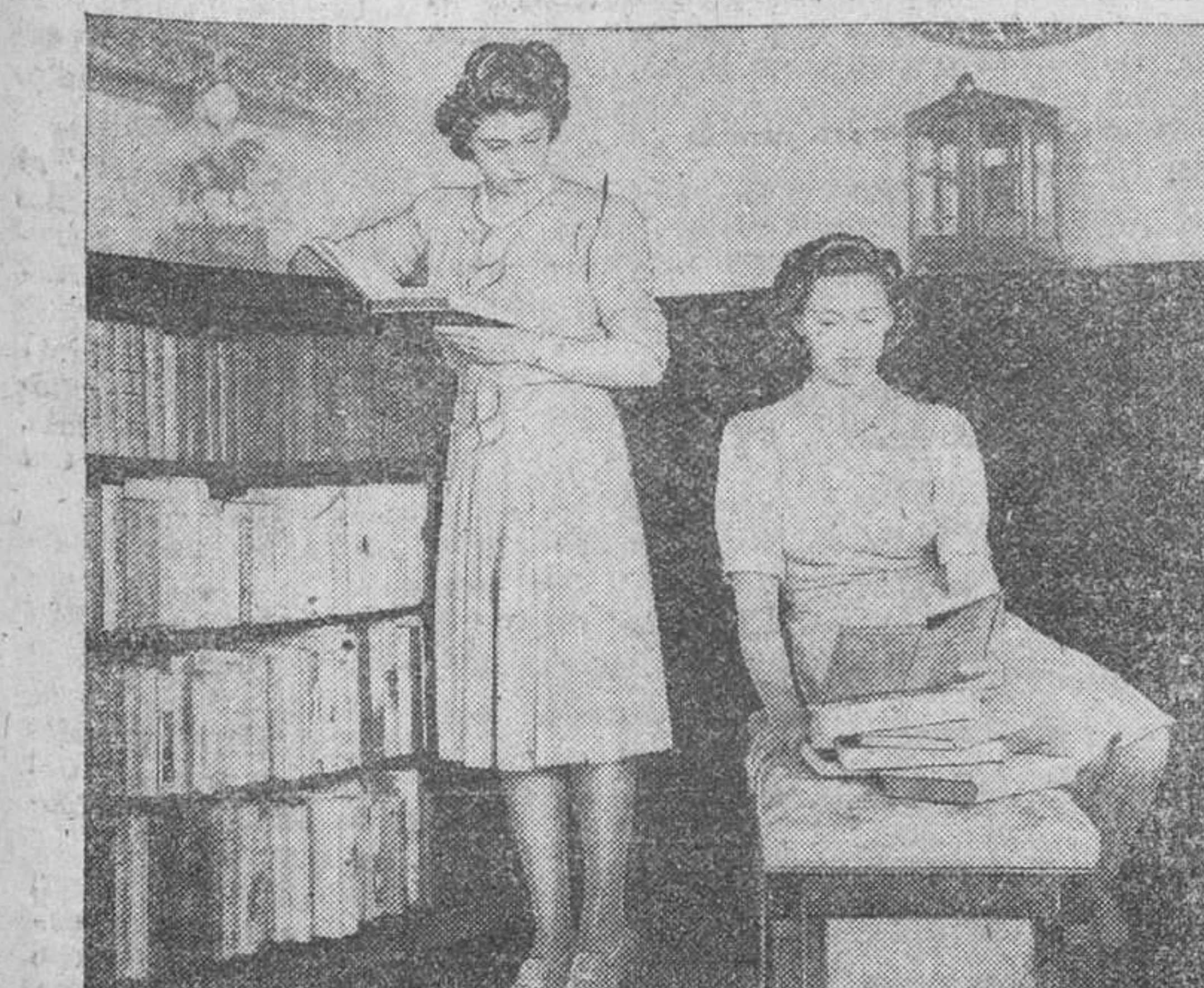
Las princesas Isabel (a la izquierda) y Margarita, fotografiadas en su biblioteca particular del palacio de Buckingham, días antes de partir para Sudafrica