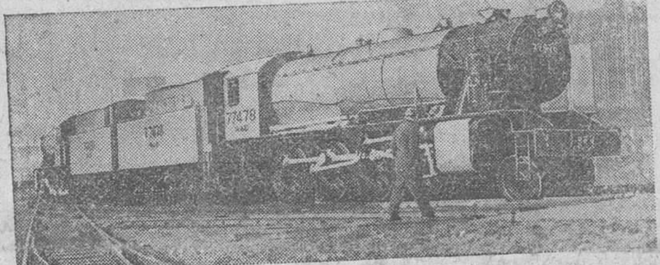
Locomotoras construidas en las factorias inglesas esperan en el puerto de Londres ser embarcadas con destino a los ferrocarriles chinos.