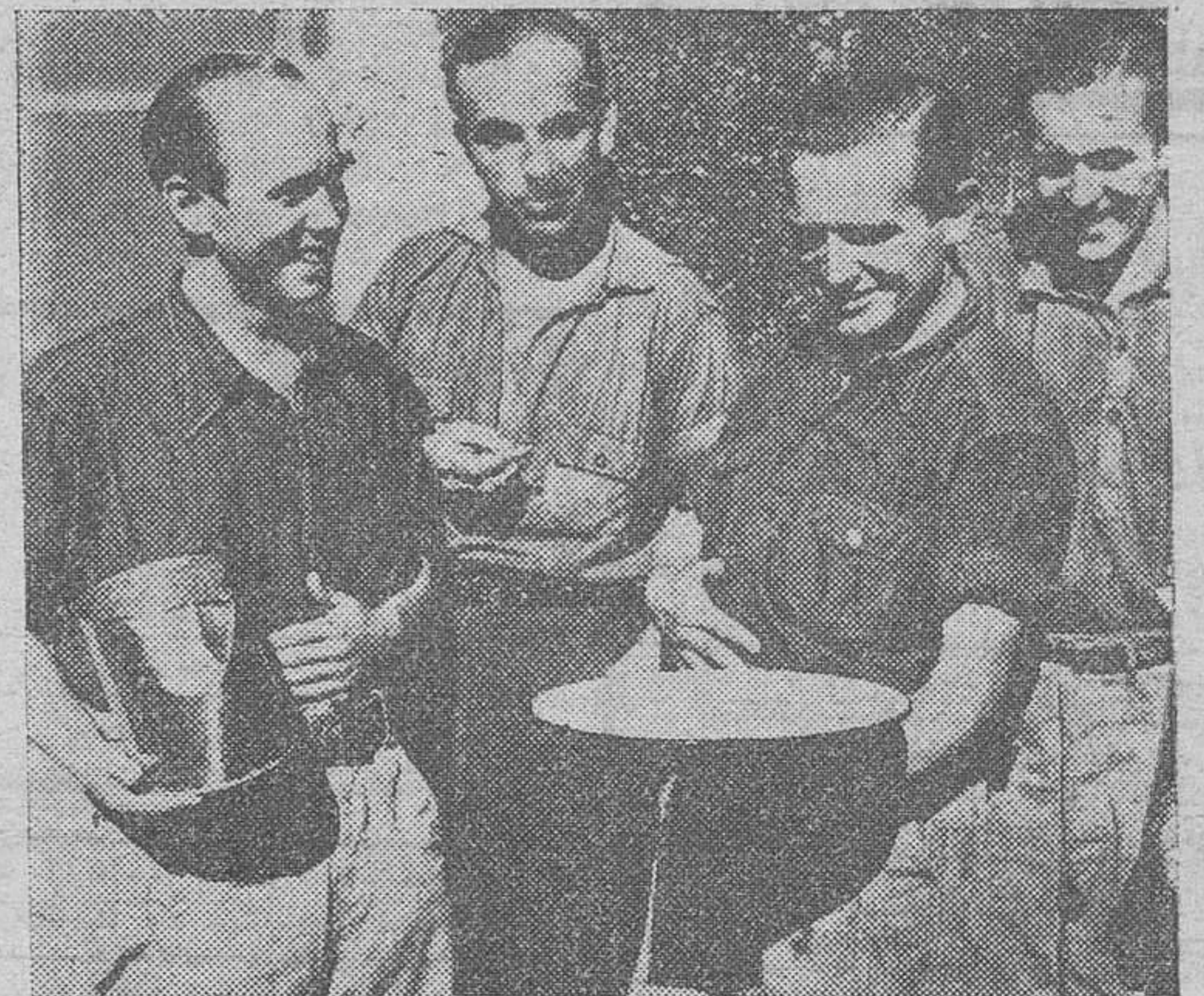
Prisioneros de guerra alemanes, que se ocupan de la cocina de un campo italiano, muestran orgullosos la tarta que han preparado para la comida