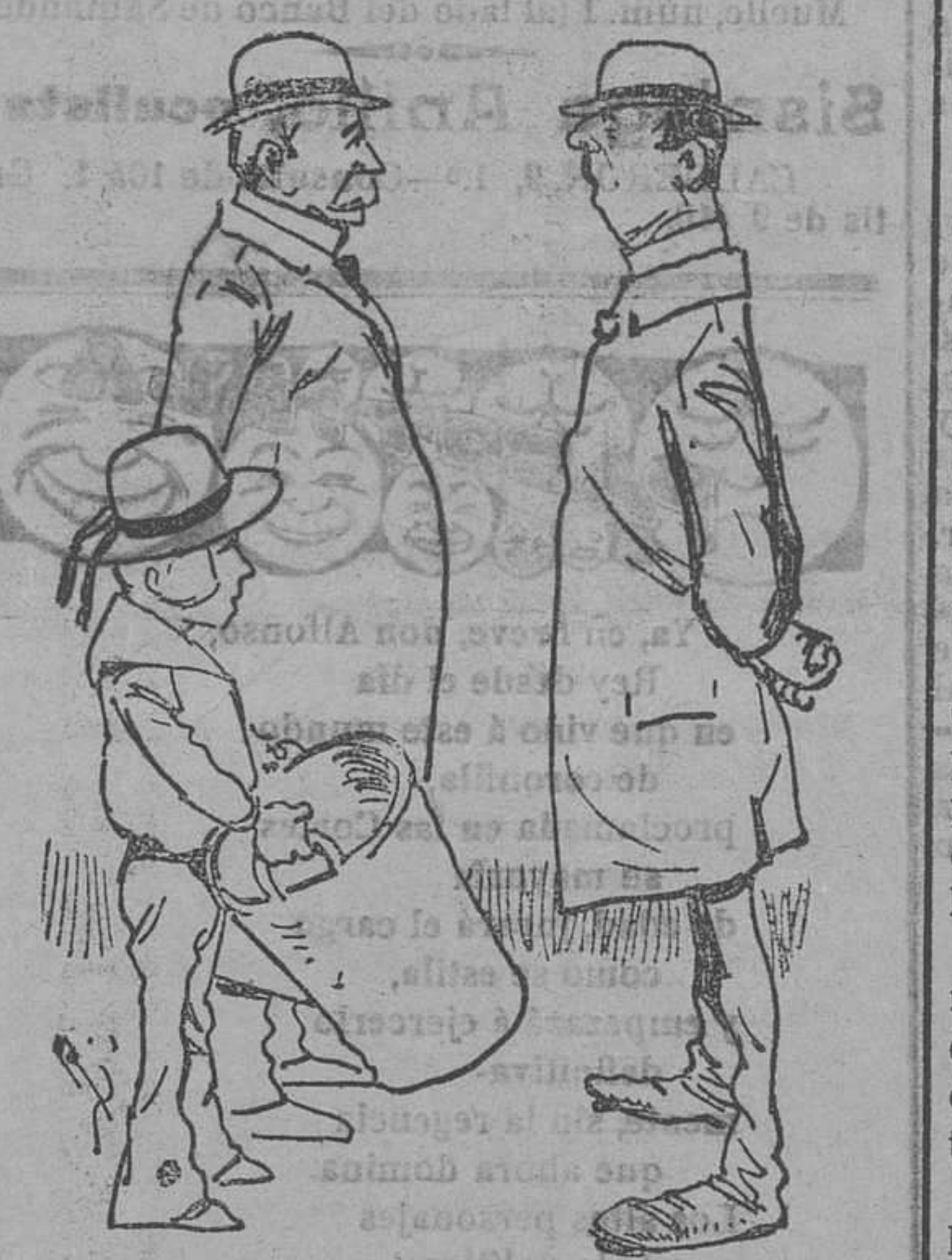
Las reformas de segunda enseñanza

—¿Van ustedes de merienda? —No, señor; es que llevo al niño al Instituto; pero como ahora tiene que estudiar tantas asignaturas, las que no le caben en la cabeza, las meto en el cesto.