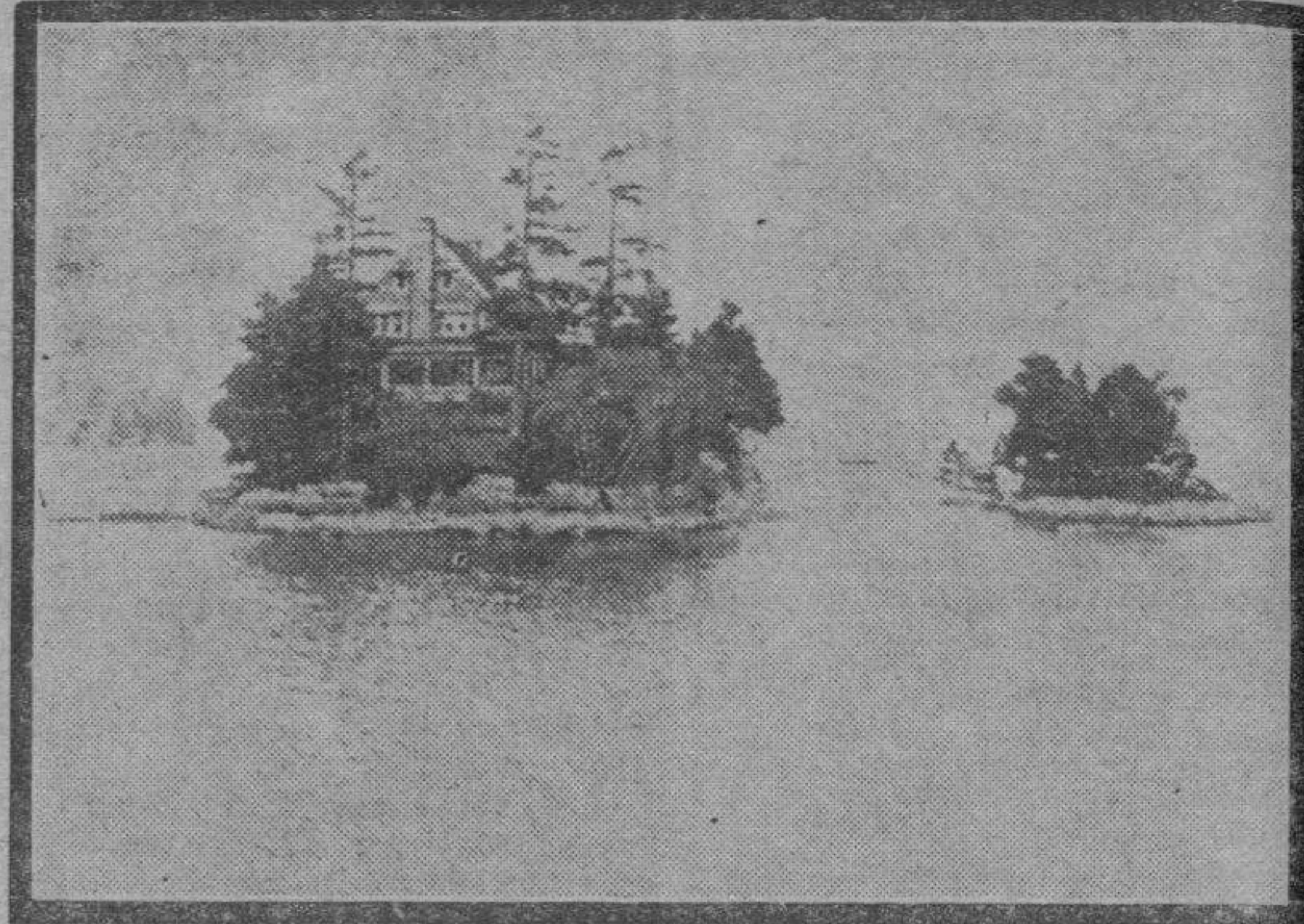
Estas islas tan próximas no pertenecen, sin embargo, al mismo Estado. La más pequeña es de los Estados Unidos; la mayor del Canadá.