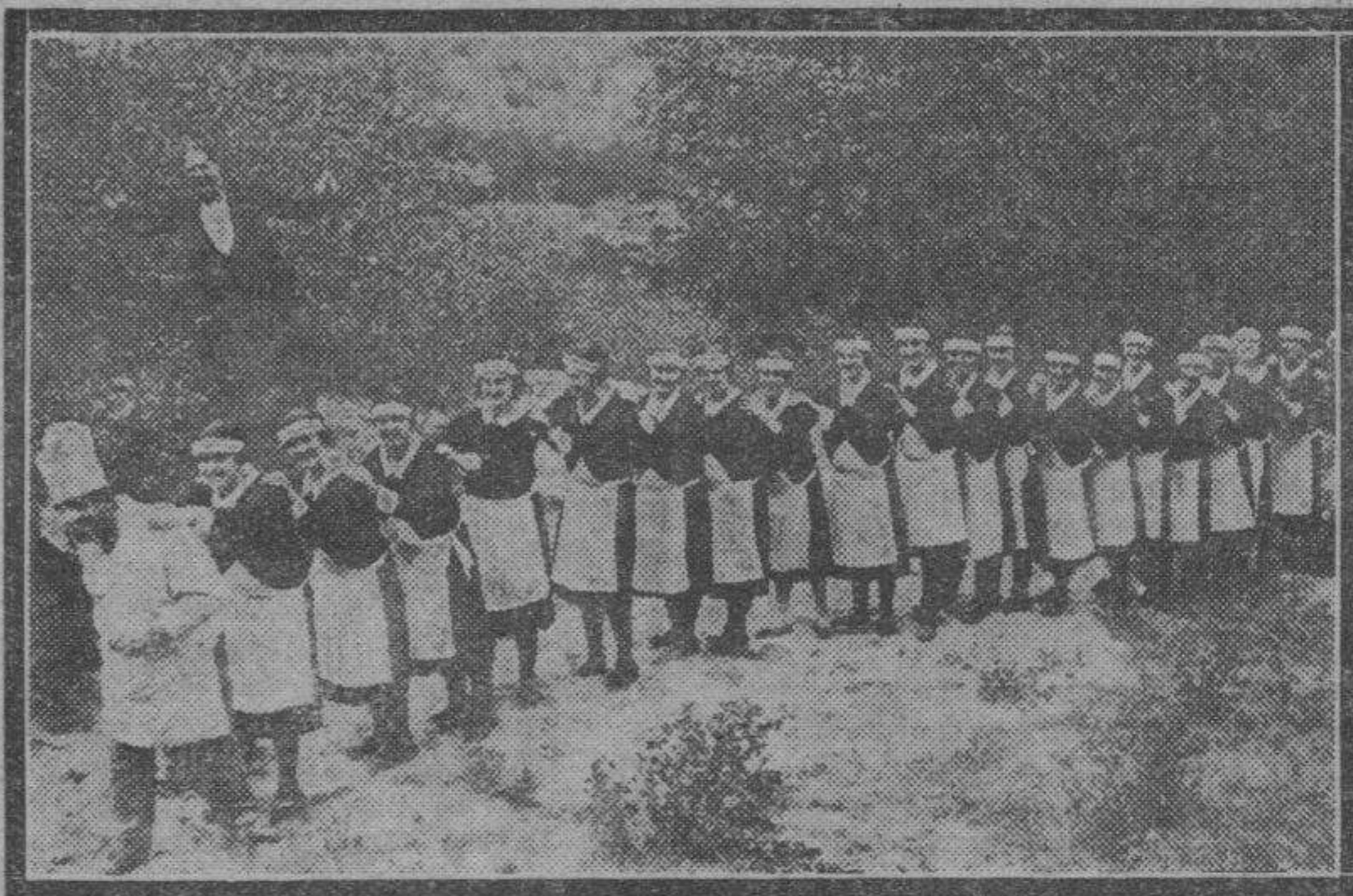
MADRID. — Los cocineros de los grandes hoteles han designado entre las camareras la reina de todas ellas, una "Miss Servicio 1931" cuyo nombramiento ha sido solemnizado ruidosamente. En esta fotografía aparecen las camareras desfilando ante el Jurado.