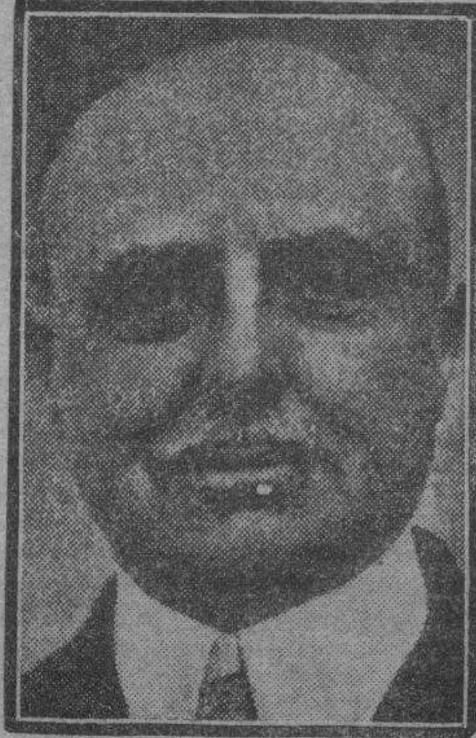
Louis Bleriot—¿quién no recuerda al famoso aviador que hace algunos años ocupaba el primer plano de la actualidad aérea? — acaba de ofrecer un premio al primer aviador que logre una velocidad de 1.000 kilómetros por hora.

(Información y datos biográficos en nuestras páginas de conferencia).