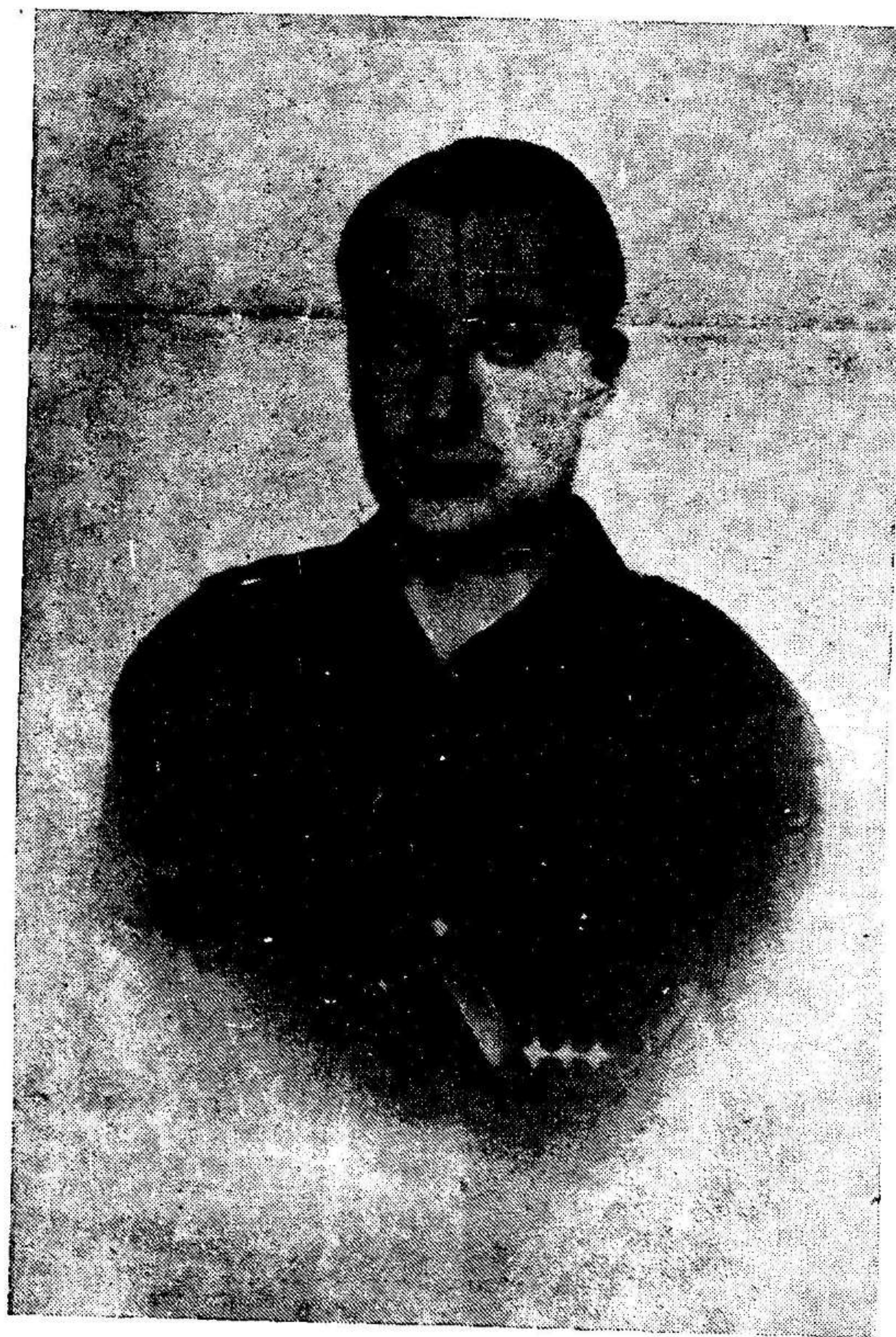
JOSE ANTONIO PRIMO DE RIVERA Jefe Nacional de la Falange

Y los que con el hierro nos atacaron, con el hierro están pereciendo. Y los que se revelaban por justicia nos miran ya con el amor de la esperanza.