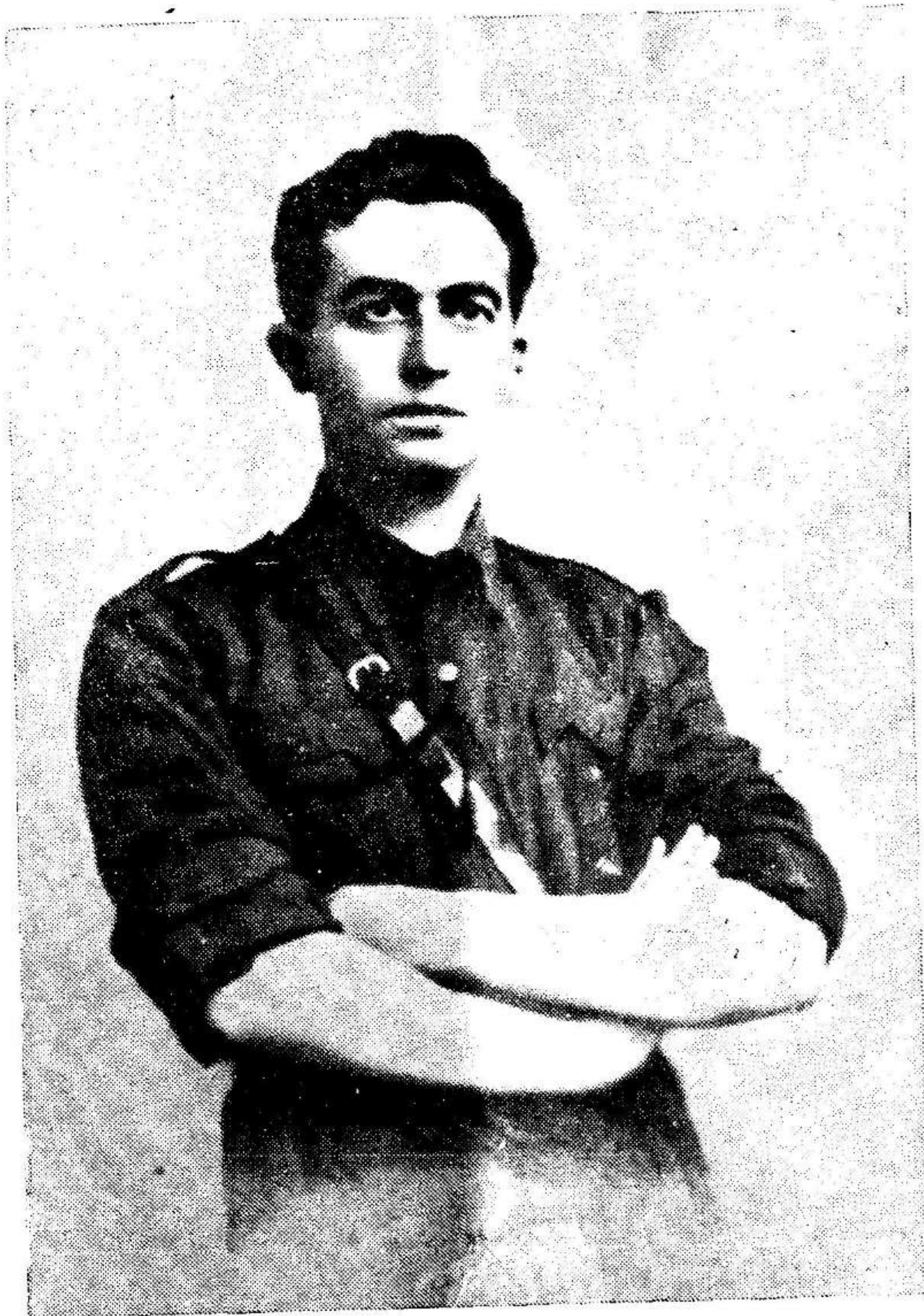
ONESIMO REDONDO Jefe Territorial de Castilla.

De la tierra, de la tierra angustiada, fatigosa y difícil; de la tierra, como los buenos creadores, sacaste tu avanzada heroica de las primeras J. O. N-S. que con flor de unidad habías de juntar a la Falange. Te llamaba la tierra con exigencia entrañable, como la madre, pero también como la masa informe que reclama las manos. Y te llamó tan bien, que después de entregarla tu sudor y tus ojos y tu afán, has ido—en el instante de la gloria—a llenar sus entrañas con la forma segura de tu cuerpo.