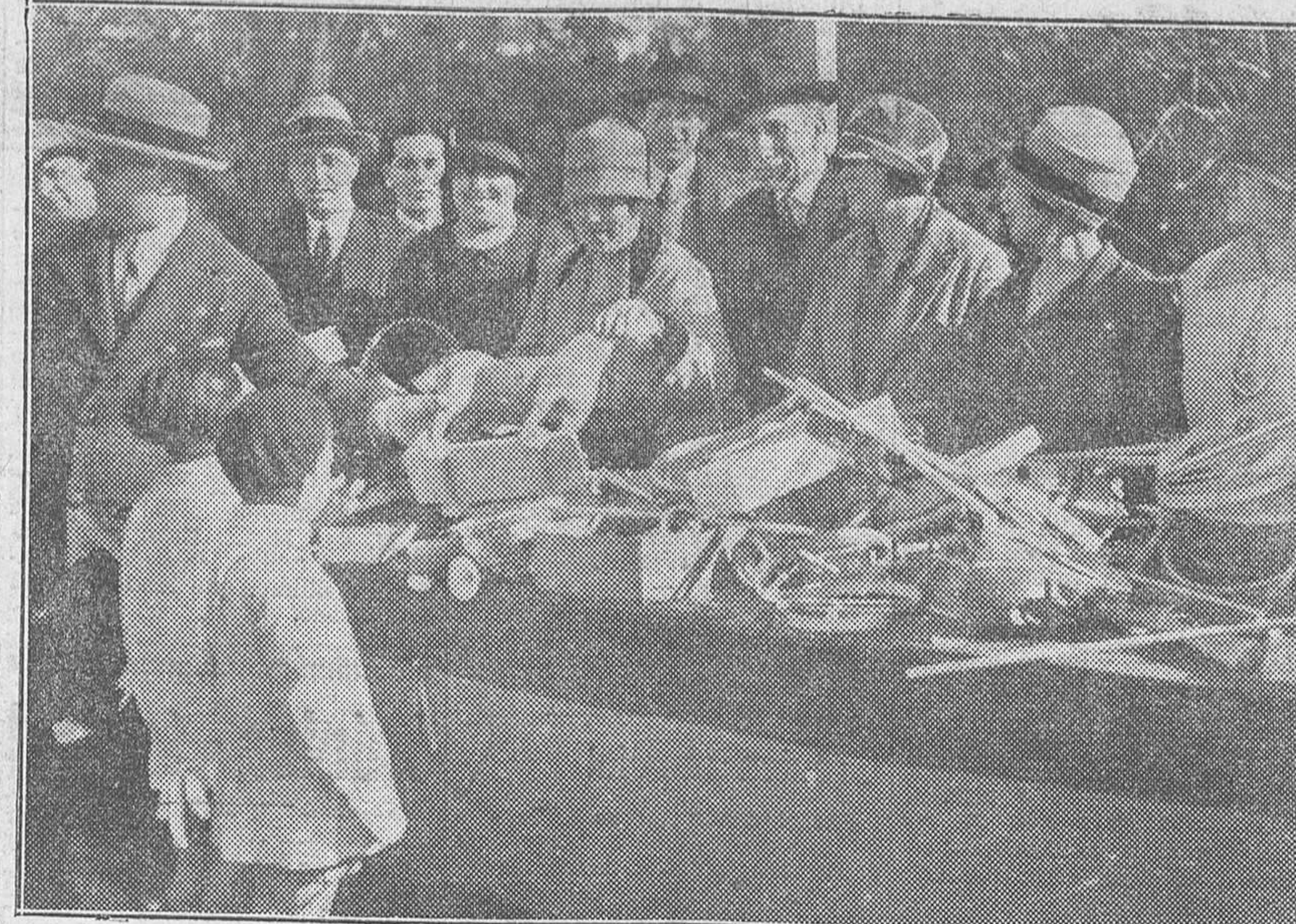
El reparto de juguetes efectuado en los Viveros, acrecentando la alegría de los pequeños...