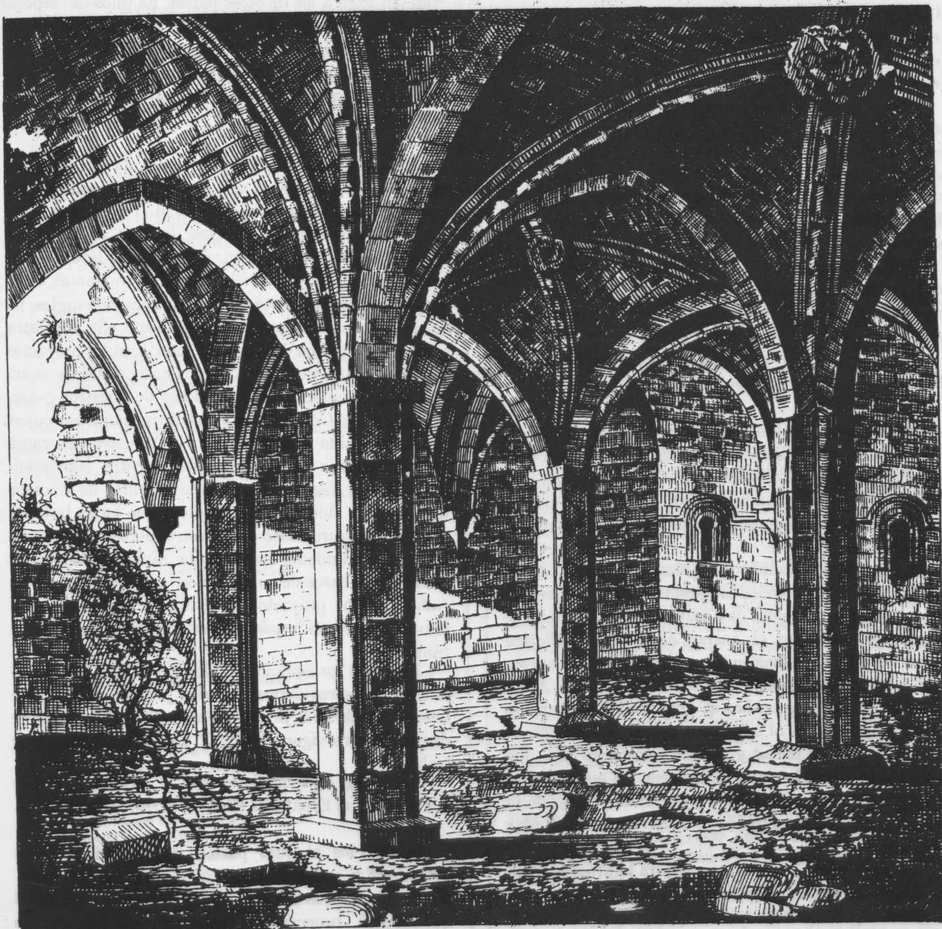
MONASTERIO DE MORERUELA.—SALA CAPITULAR.

PUNTOS DE SUSCRICION.—Calle de la Rua. 10. CORRESPONDENCIA.—Sacramento, 2.