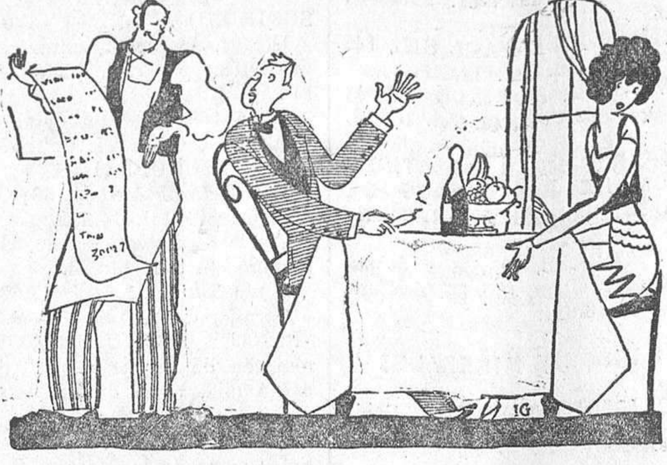
—Por lo visto, usted se ha dado cuenta de que somos madrileños y nos pone cuenta doble. —Naturalmente; la gente de capital, es capitalista.