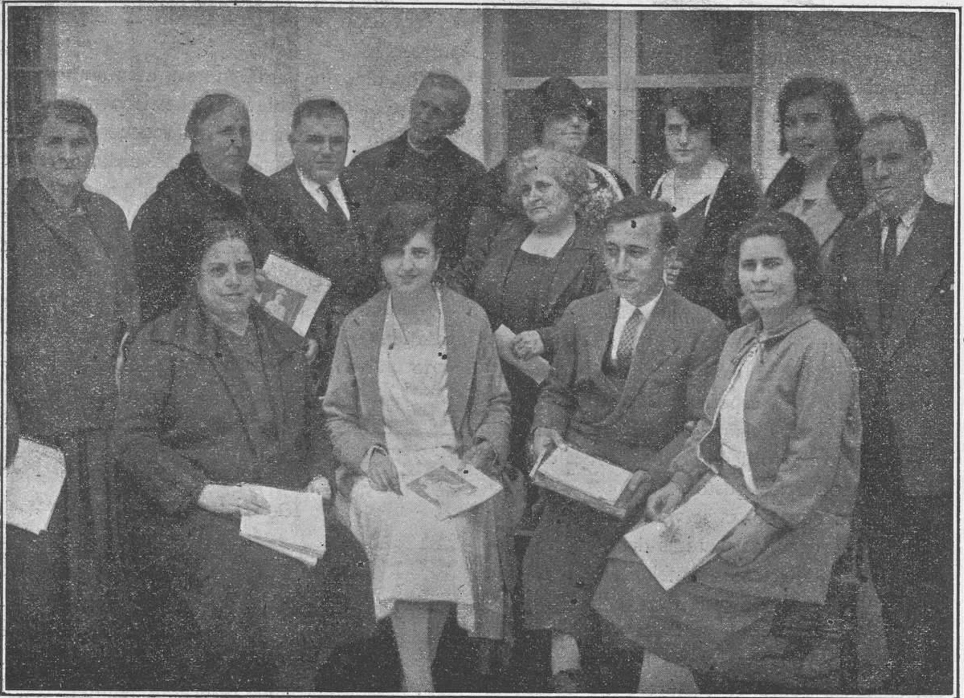
Patio que figurará en la Exposición de Sevilla.—En este grupo se ven al Alcalde de El Toboso con su familia, al Juez con la suya, el respetable Párroco y Directora y Redactora-Jefe de nuestro periódico.