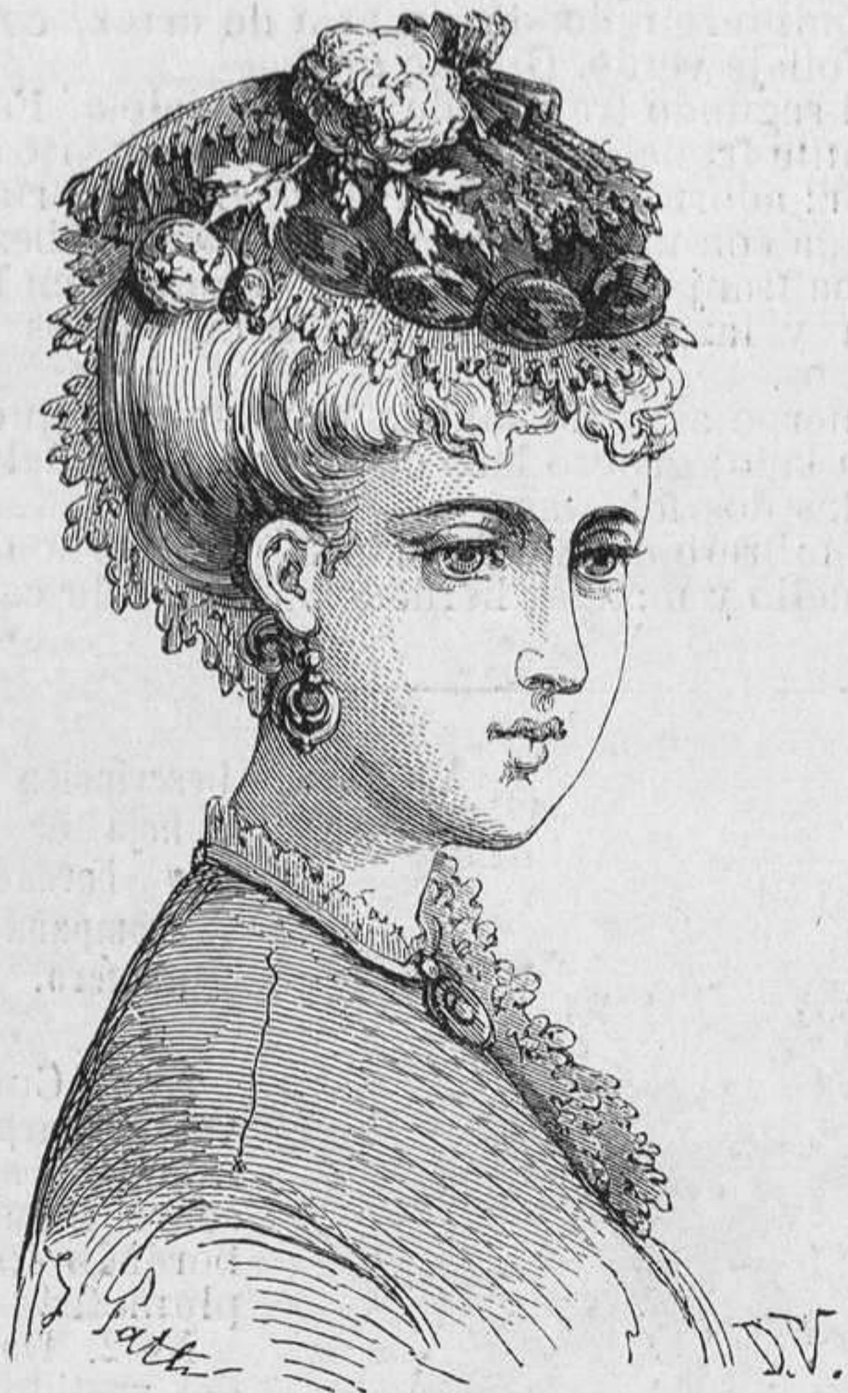
Nº 4. Sombrero Minni .

en forma cuadrada, con cuello de encaje á la Médicis.