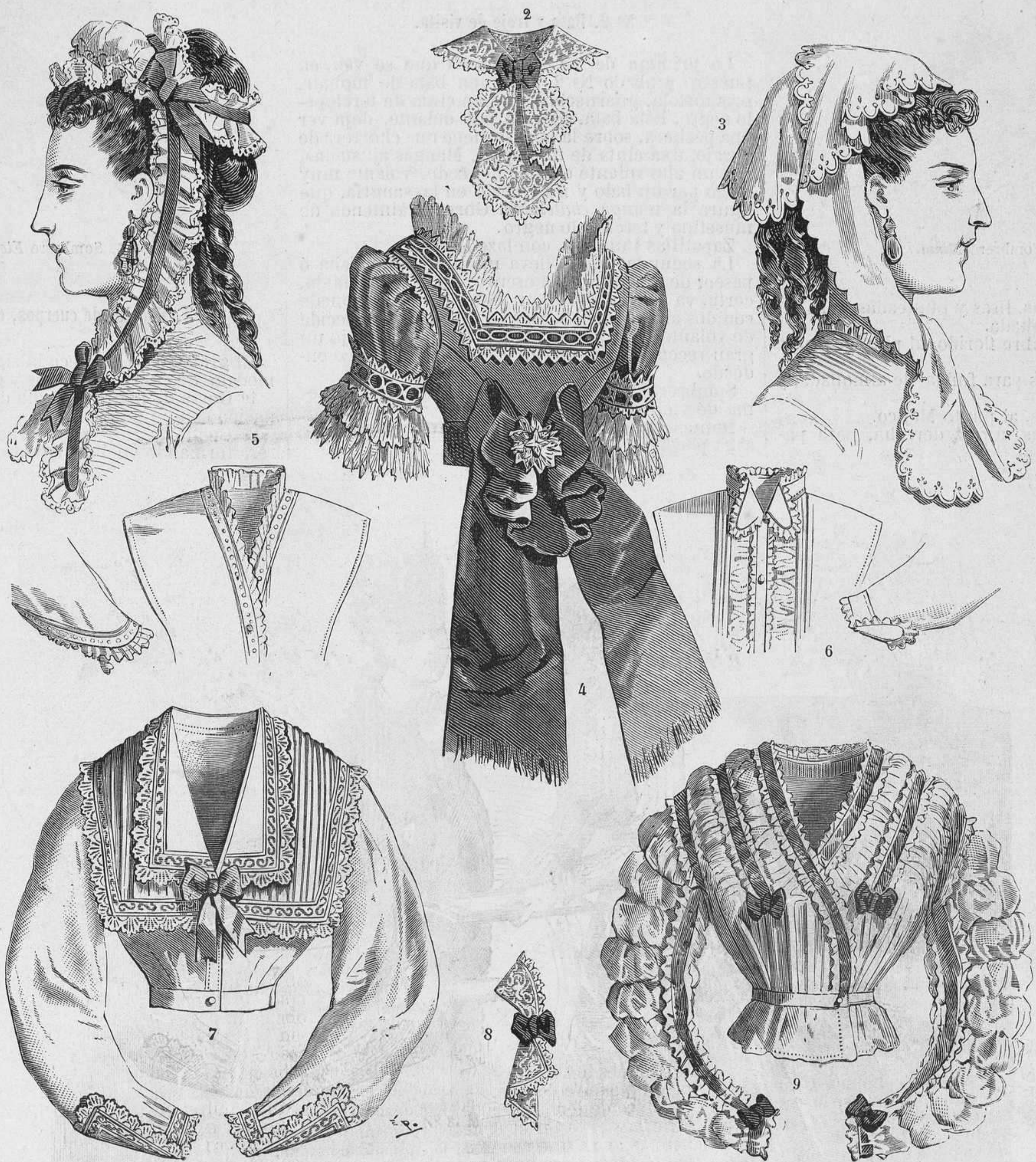
Nº 3. Modelos de cuerpos, cuellos y gorras.

Descripcion del figurin iluminado que acompaña á este número.