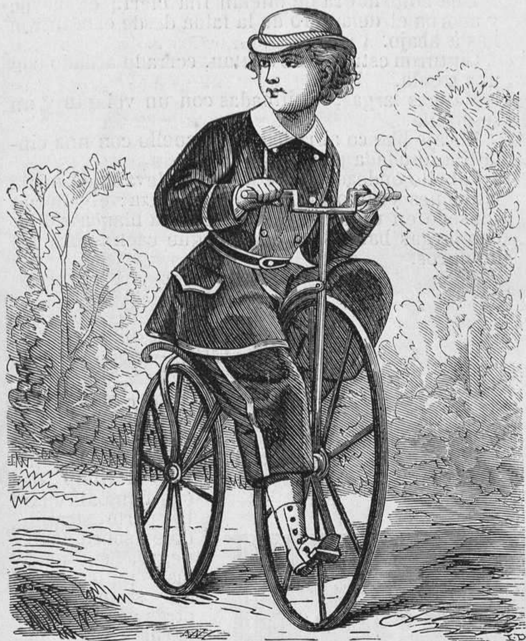
Nº 7. Traje de niño de nueve á diez años.