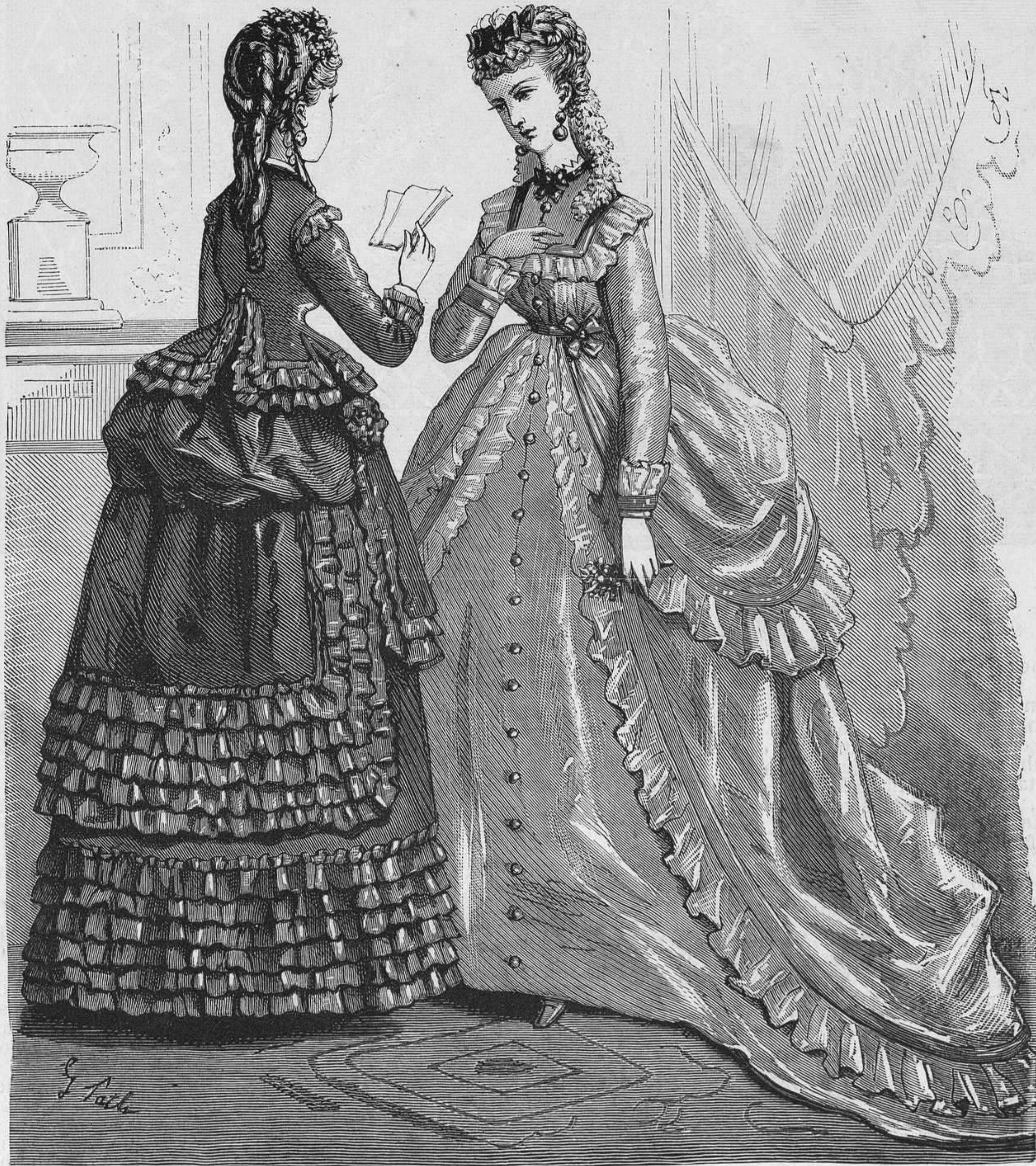
Nº 9. Traje de tafetan ala de mosca. — Traje blanco de muselina.

ne la falda redonda y adornada á 8 centímetros de su borde inferior con un volante de 20 centímetros á gruesos pliegues separados y cogidos hácia arriba. Este volante descansa por ambos lados en un rizado de 4 centímetros de altura, plegado muy menudo.