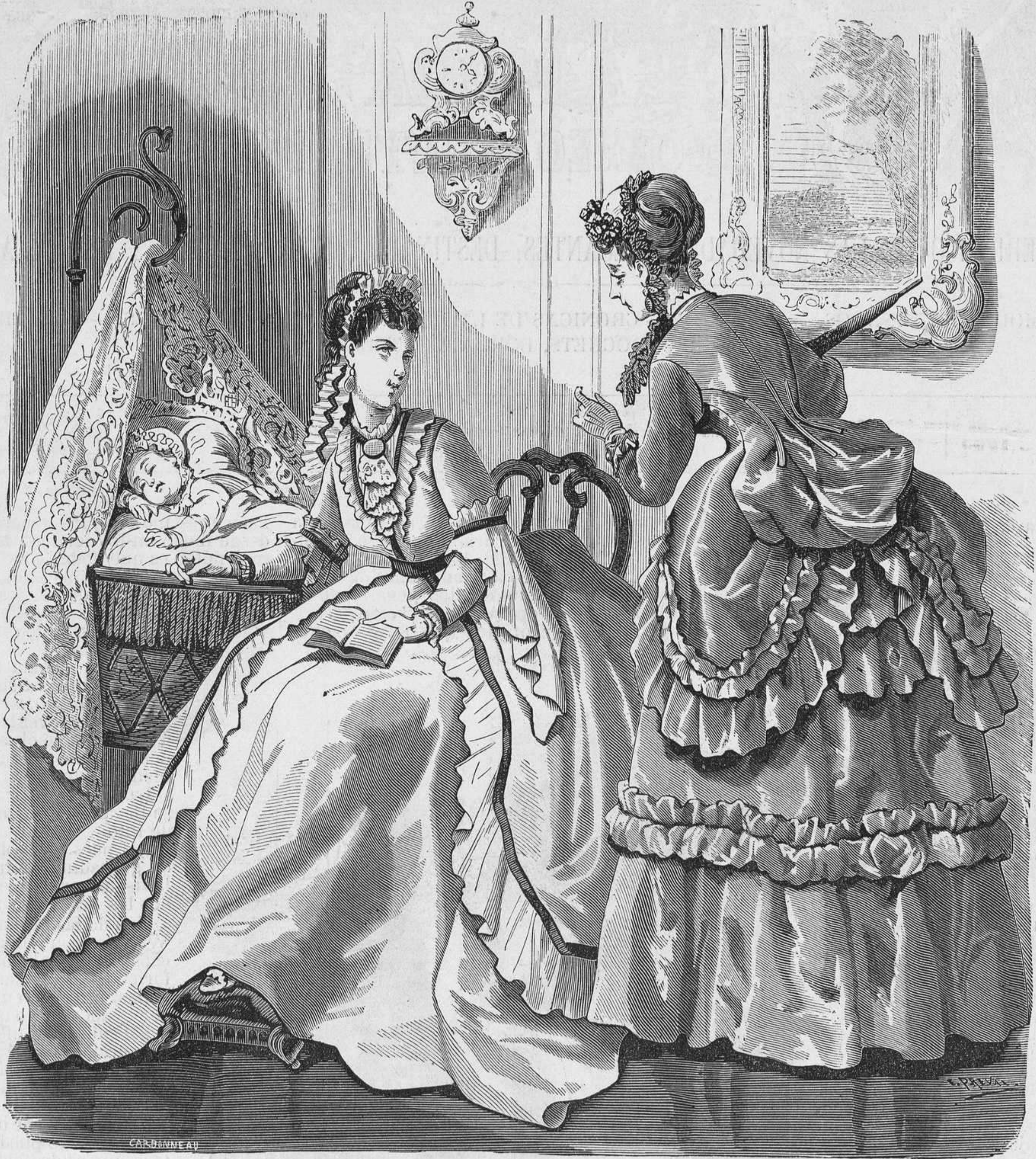
Nº 2. Bata y traje de visita.

En la estación actual hay ciertos productos admitidos por la moda, que se recomiendan especial-