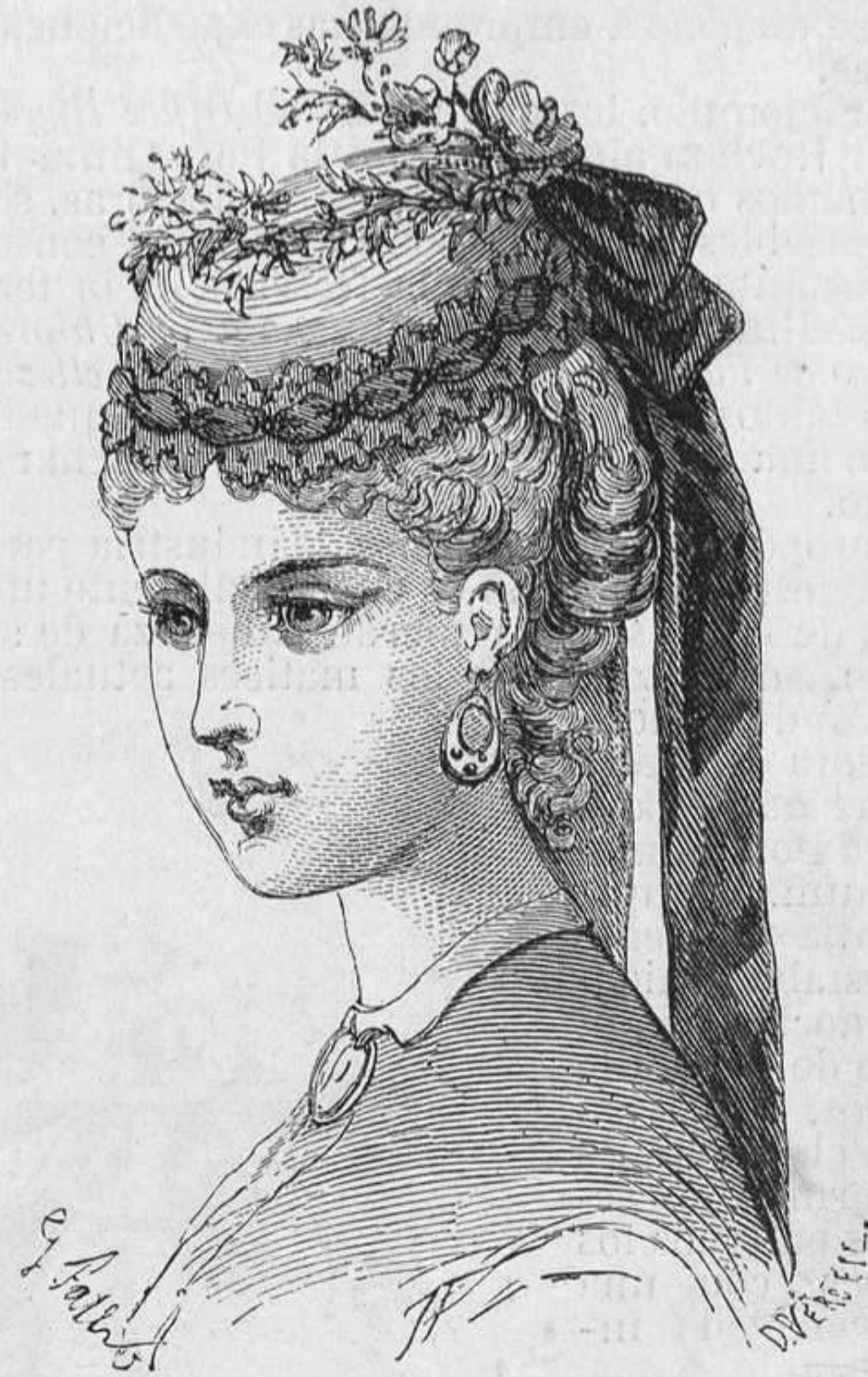
Nº 5. Sombrero Fleurette .

Botitas finas, con lazo de raso en lo alto de la caña por delante.