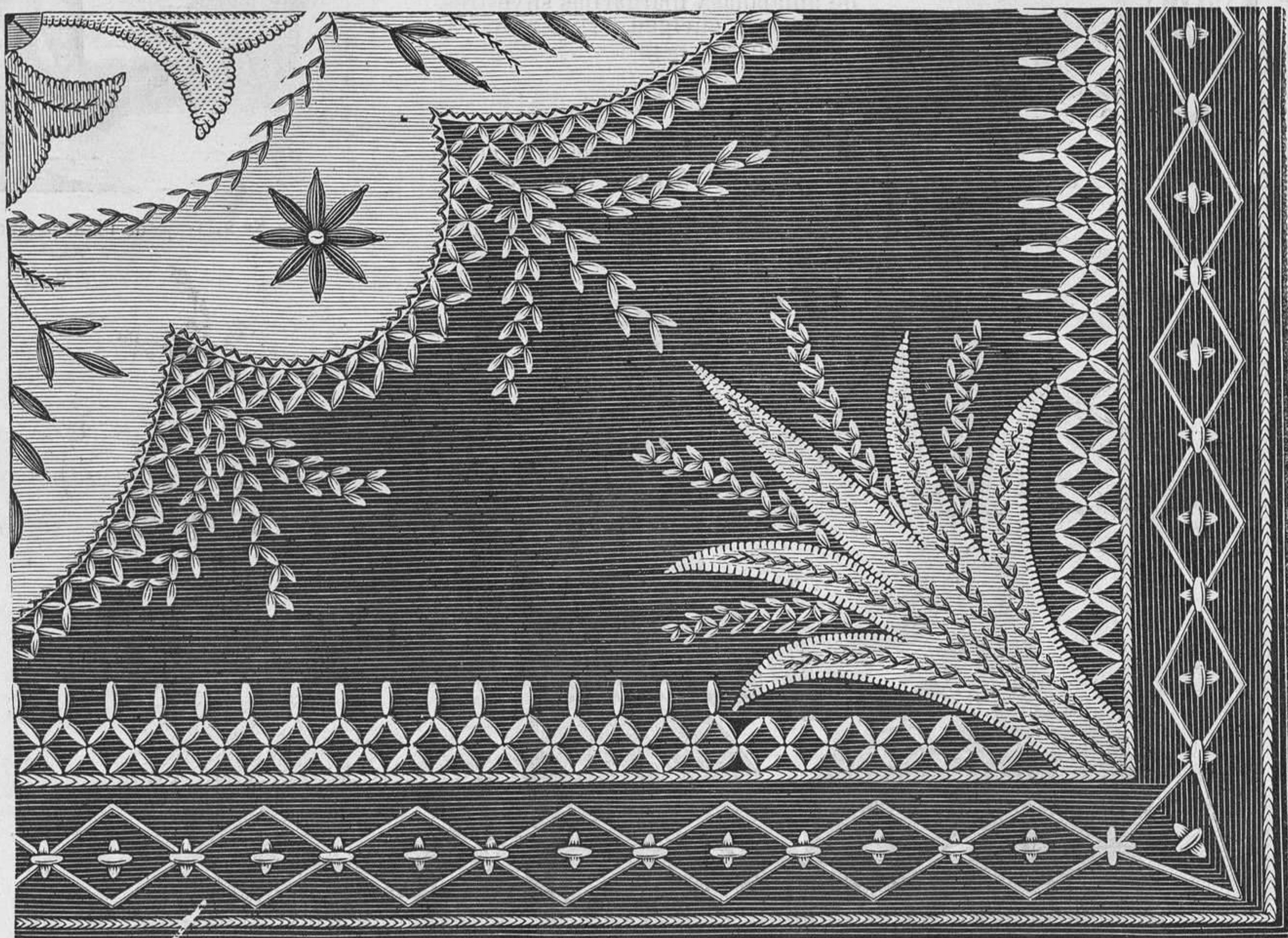
Nº 11. Cuarta parte del dibujo de la cartera.