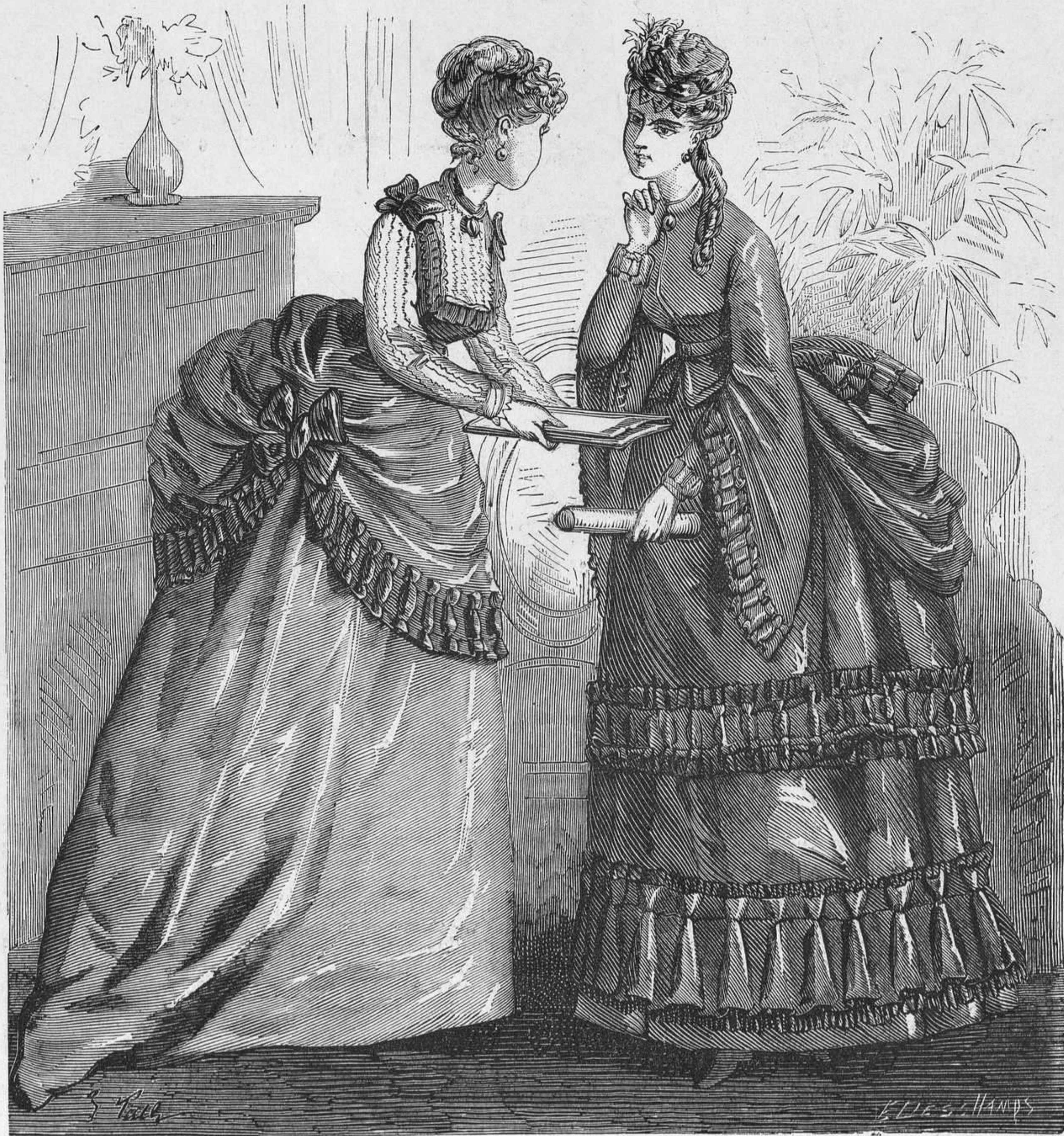
Nº 6. Traje de tafetan glaseado gris y aurora. — Traje de fular azul.