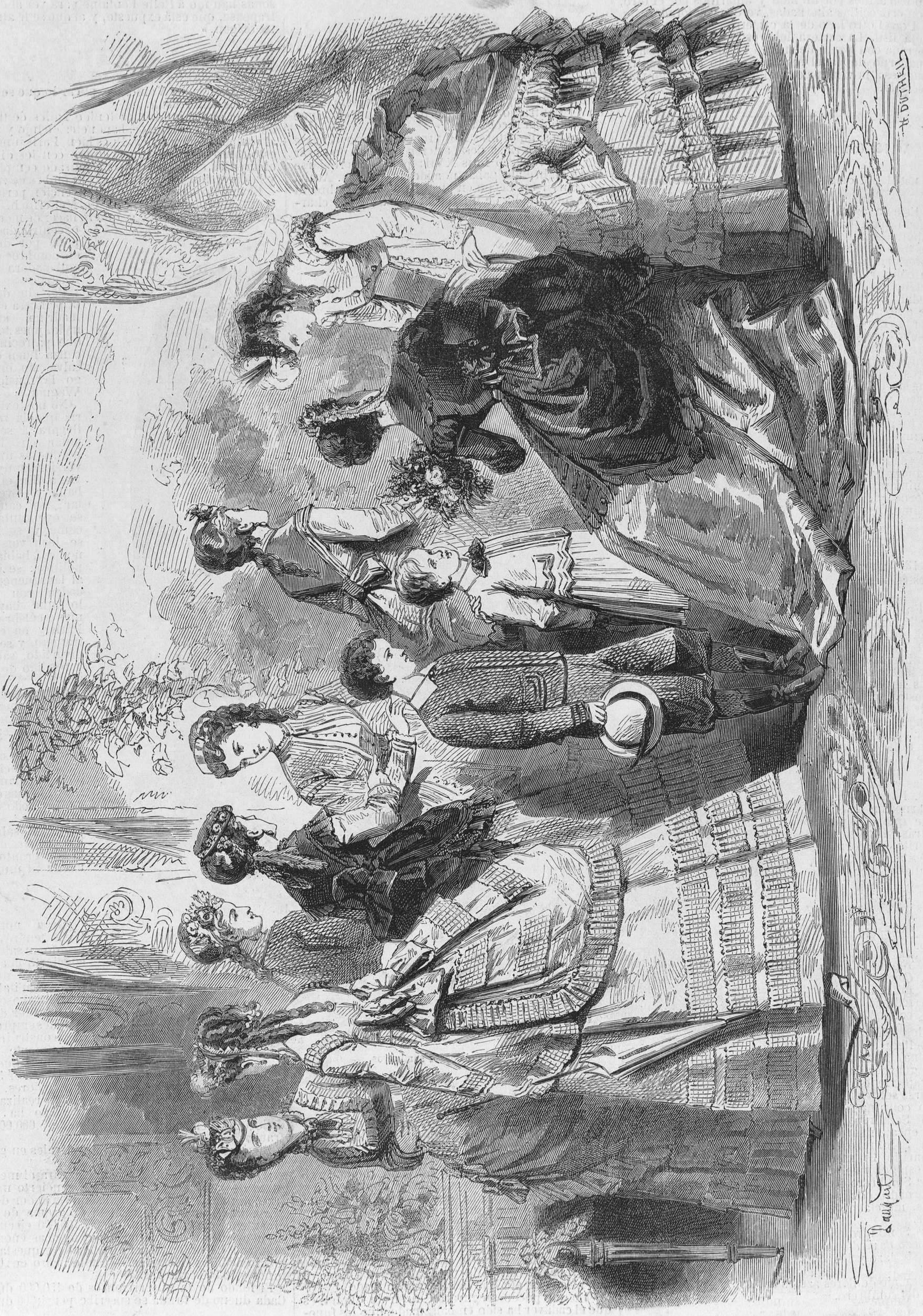
MODAS DE PARIS en la primavera de 1869. — (Véase la Cronica de la Moda .)