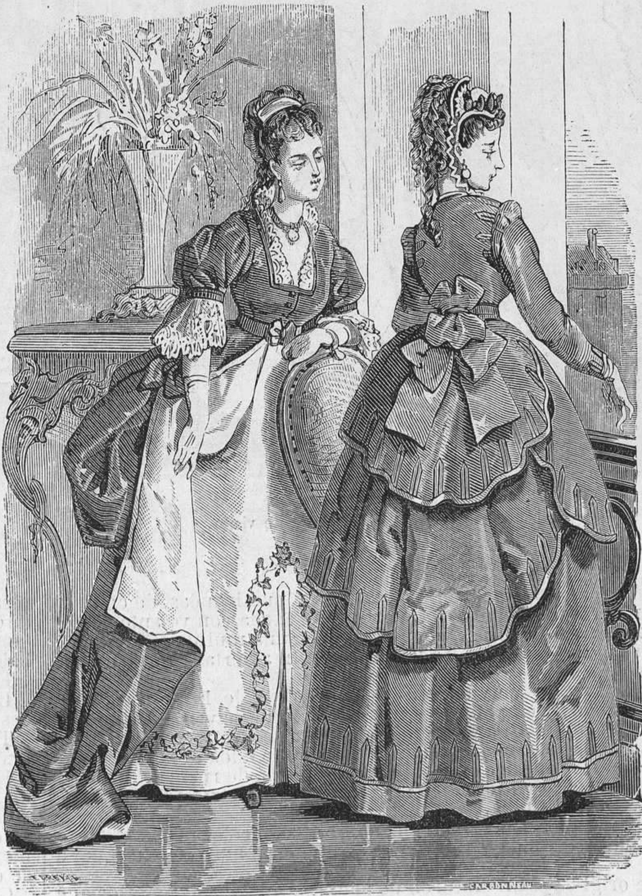
Nº 1. Traje de comida y traje de paseo.