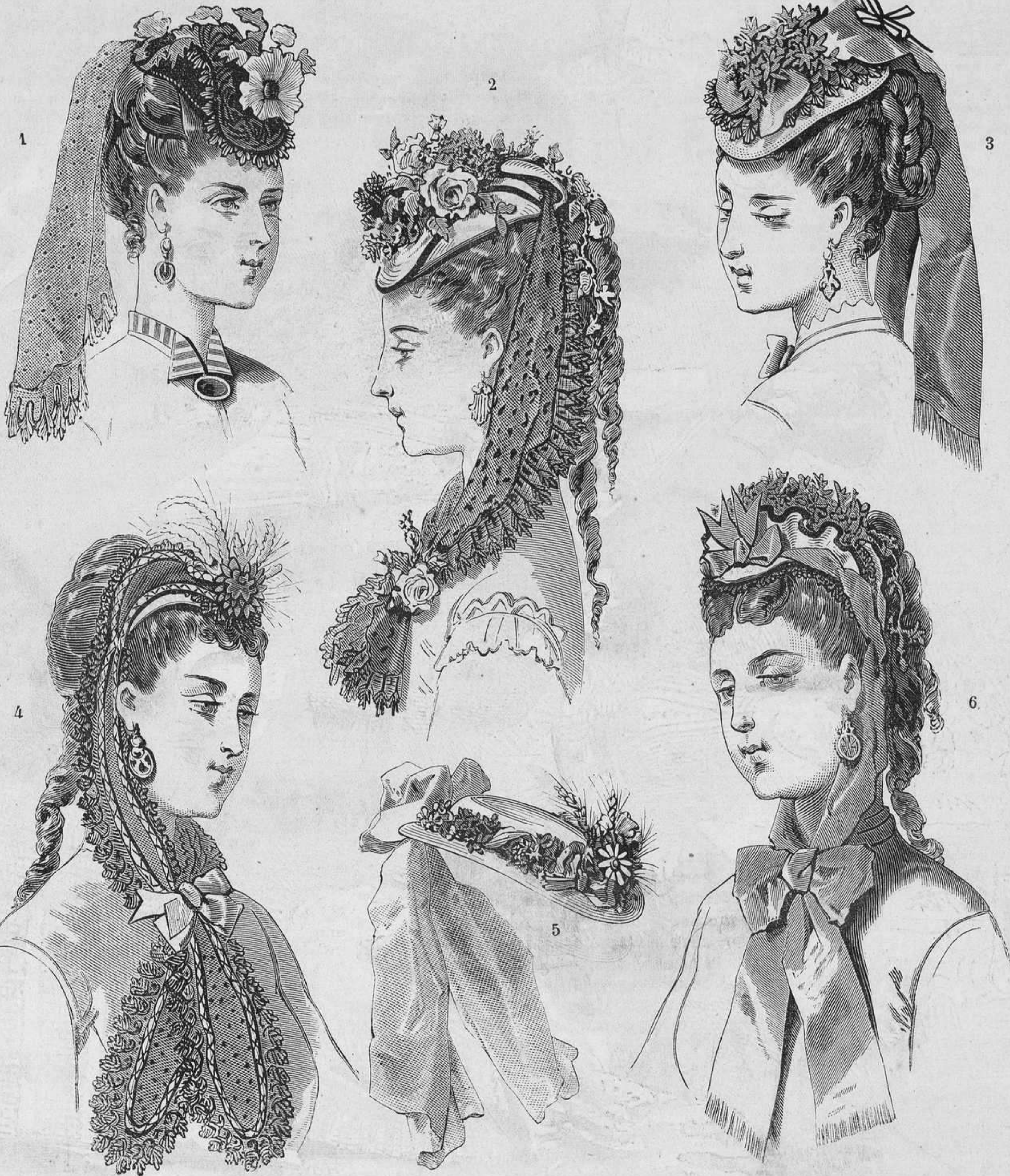
Nº 13. Nuevos modelos de sombreros.

Dícese que hace años, durante una noche muy oscura, un hombre llamó á la puerta del convento de hermanos trapenses de Belle-Fontaine, á dos leguas de Chollet. Le acompañaba una persona, la cual entregó al superior un cofrecito, con encargo de no abrirlo hasta despues de la muerte de su compañero, que deseaba terminar sus dias en aquel asilo de paz; hasta entonces no debía saberse ni su nombre ni los detalles de su existencia.