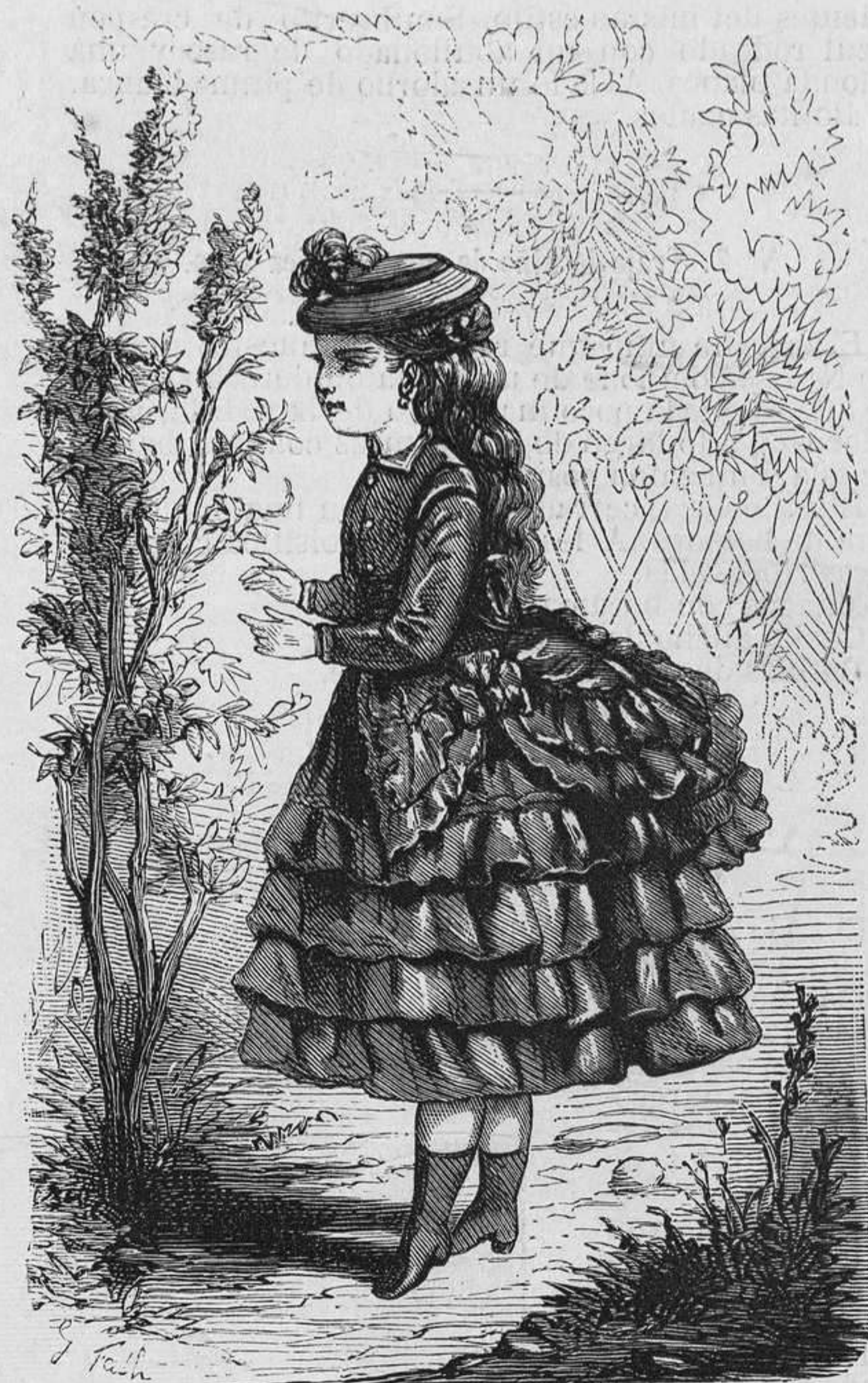
Nº 8. Traje de niña de cinco á seis años.

se ven en nuestro grabado Nº 6, hecho para comida de etiqueta, es de tafetan glaseado, gris y aurora. La primera falda es toda lisa y de media co'a, y la segunda, muy corta, forma por detrás un voluminoso recogido y la sostiene á los lados un lazo de la misma tela. Esta falda va guarnecida con un rizado marquesa, rizado de 10 centímetros de ancho por delante y por detrás; pero que disminuye sensiblemente al subir por los lados para perderse bajo los lazos que levantan la falda.