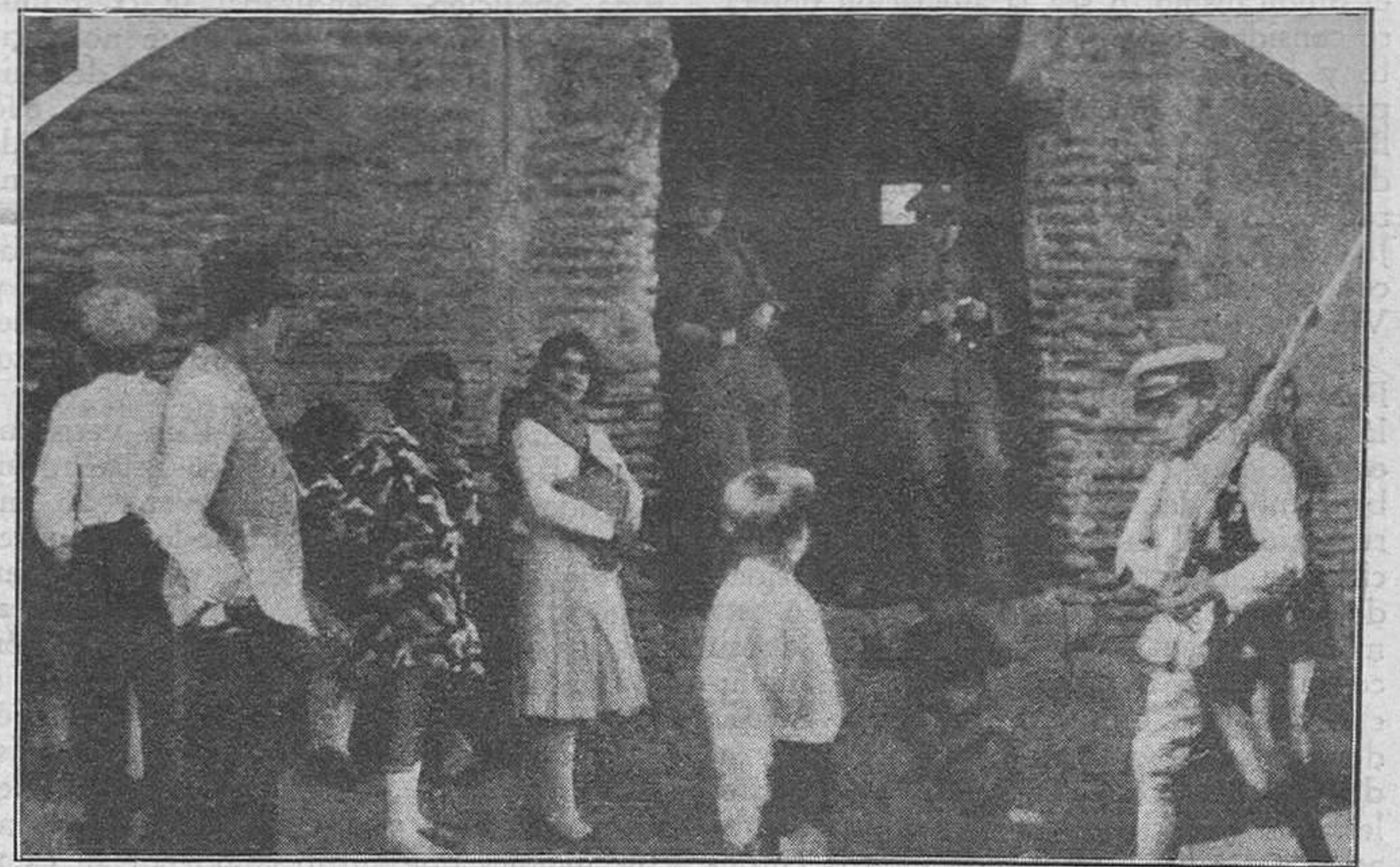
Familias de los presos ante una cárcel esperando la hora de la comunicación.

Y los socialistas en su odio contra los espavidos cabezas llamados libertarios, pondrán siempre piedras al camino del gobierno de que ellos forman parte, porque los otros no son tonos ni cobardes y saben defenderse.