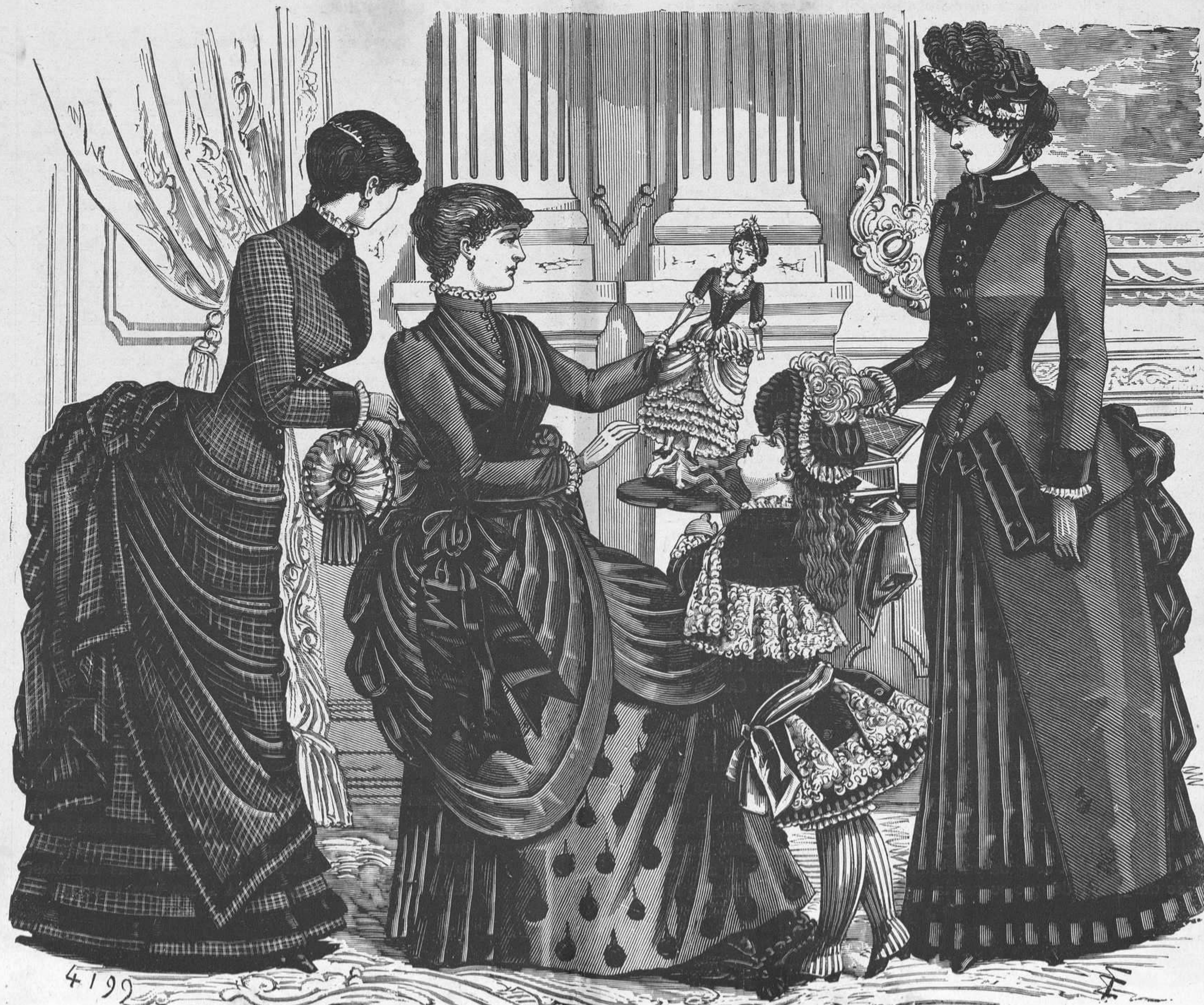
12 a 15.—Trajes de casa, paseo y niña.