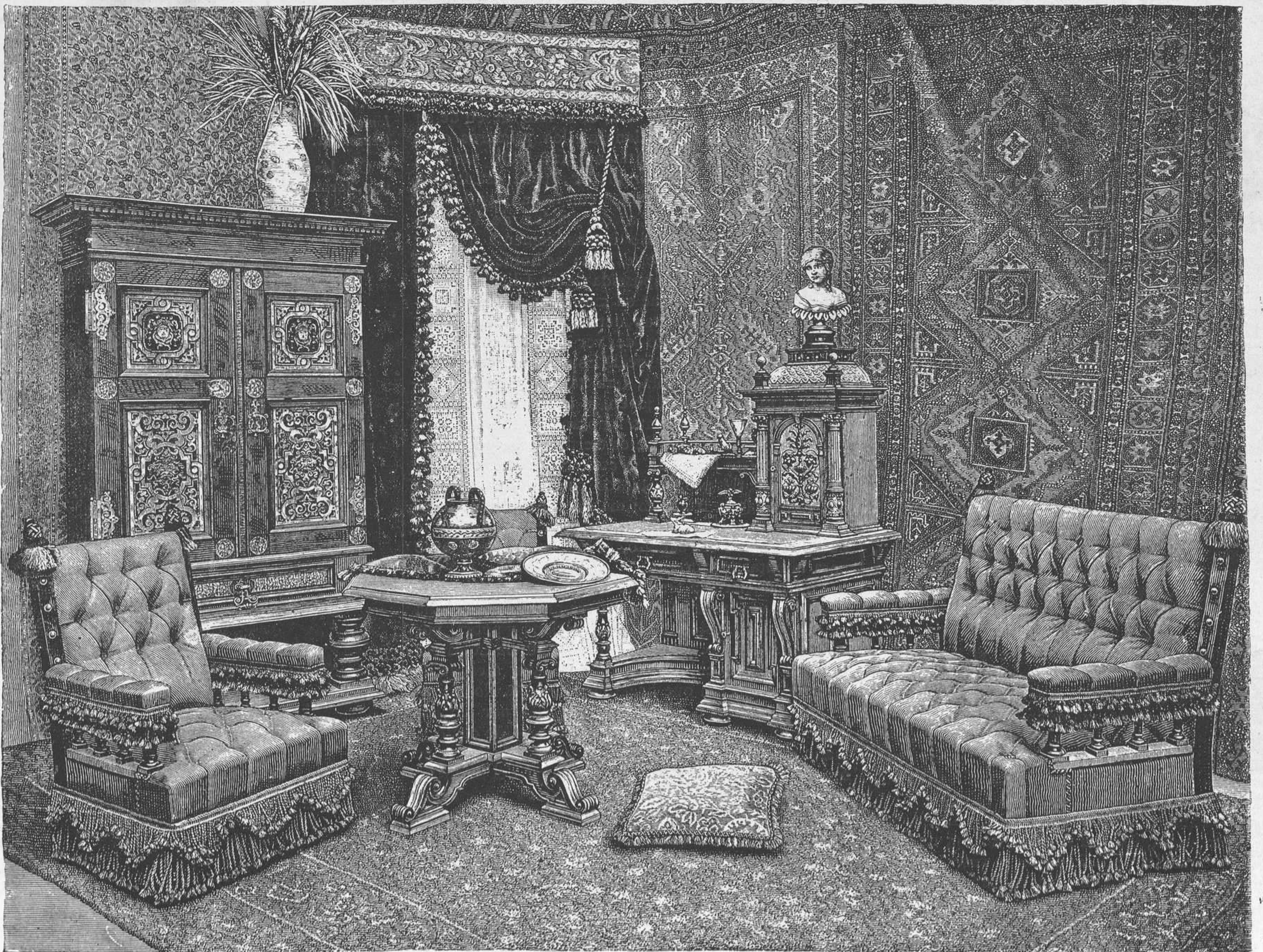
Salones decorados.—Gabinete de estudio.