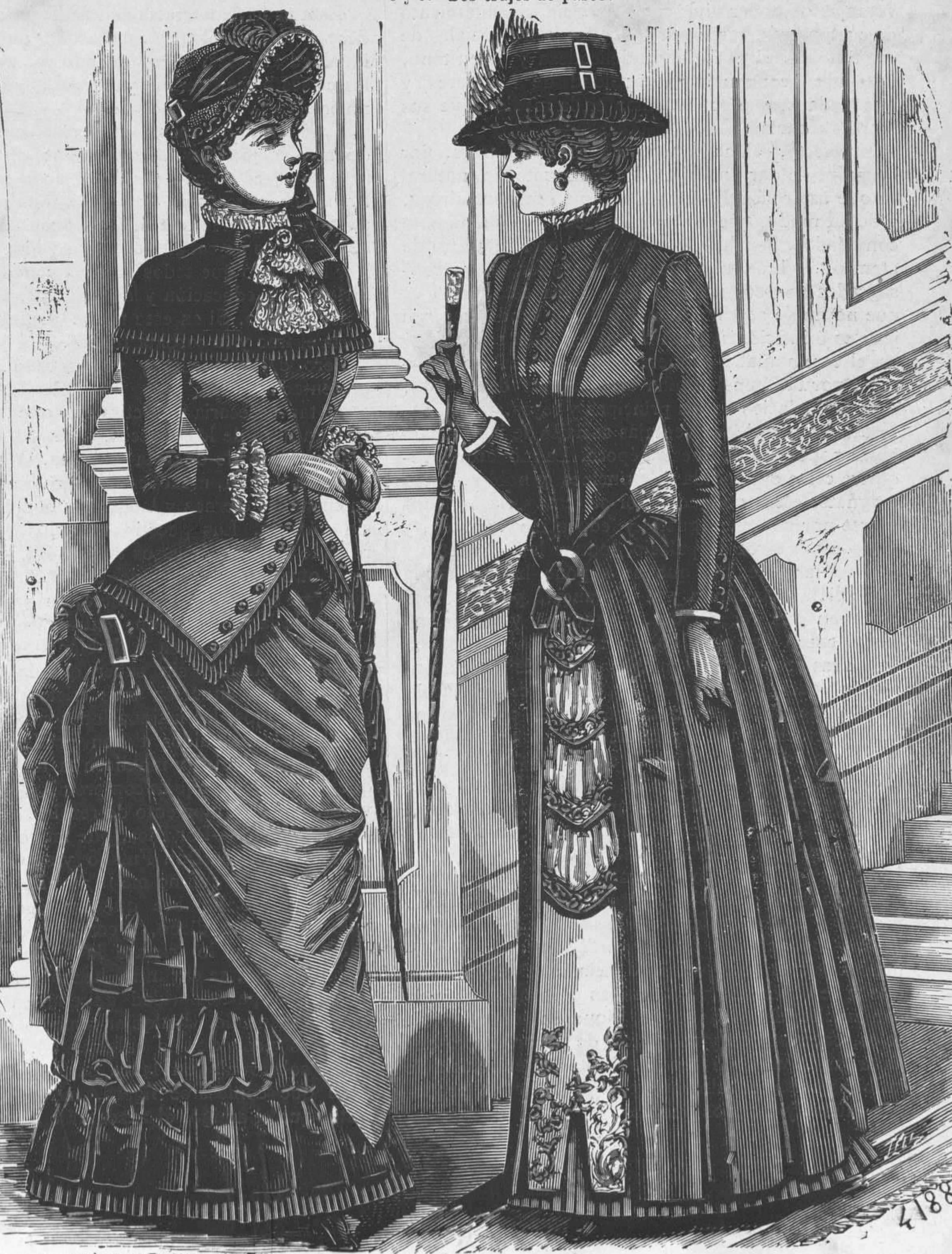
16 y 17.—Trajes de visita y de calle.