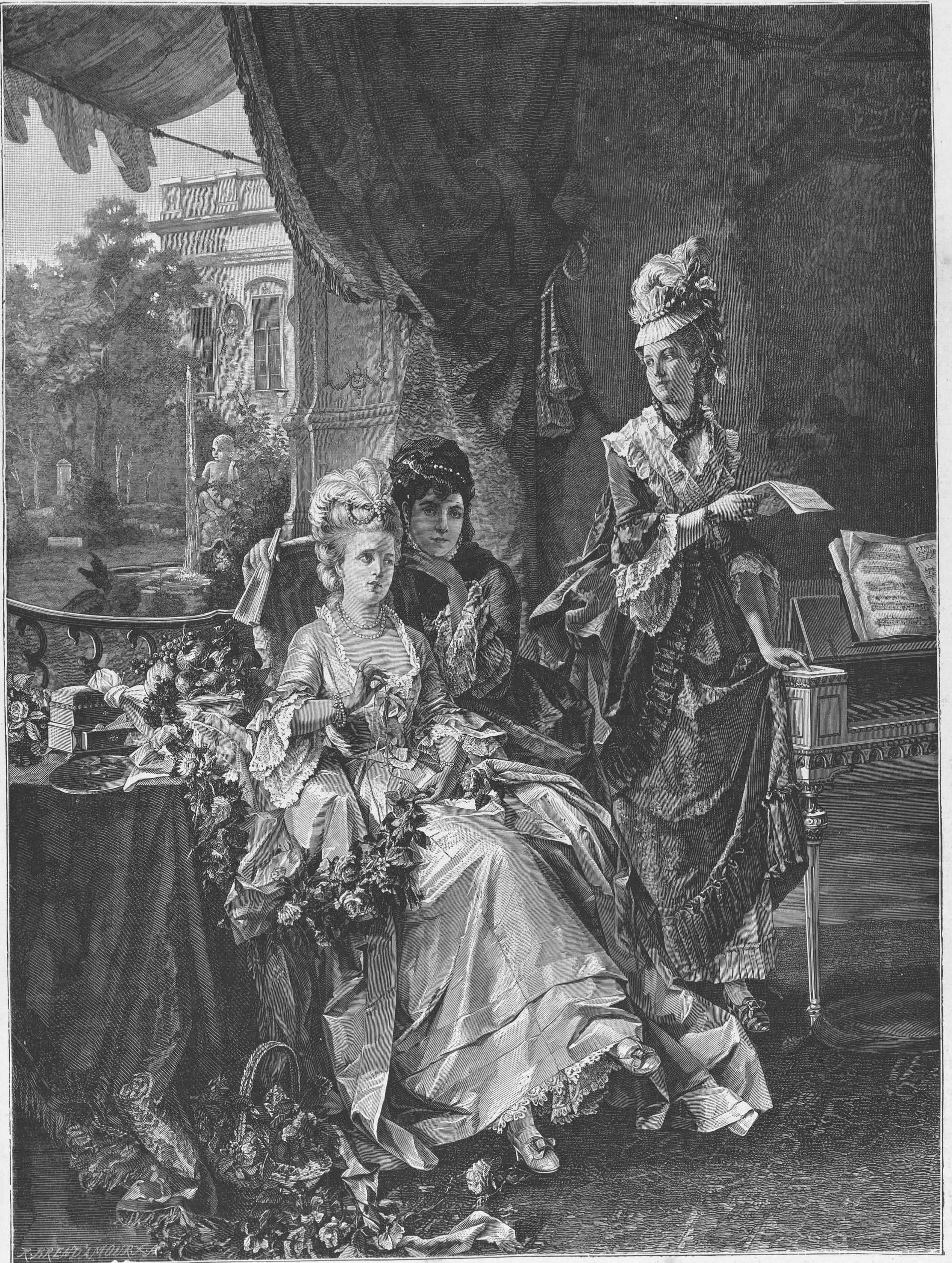
ANTES DEL SARA0, copia del cuadro de Carles Vernier, grabado de Brend'Amour.