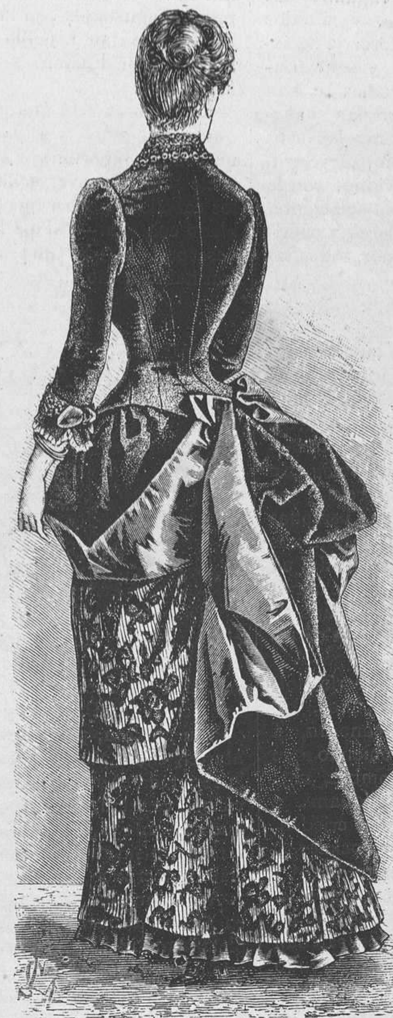
7.—Traje con echarpe drapeada.