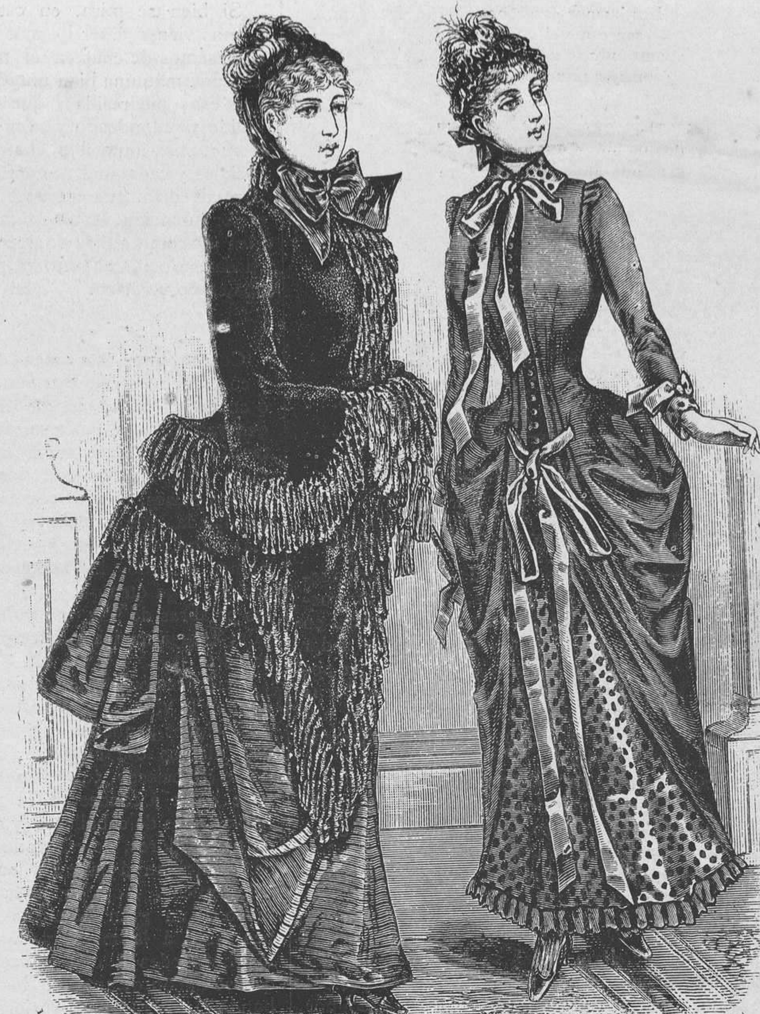
8 y 9.—Dos trajes de paseo.