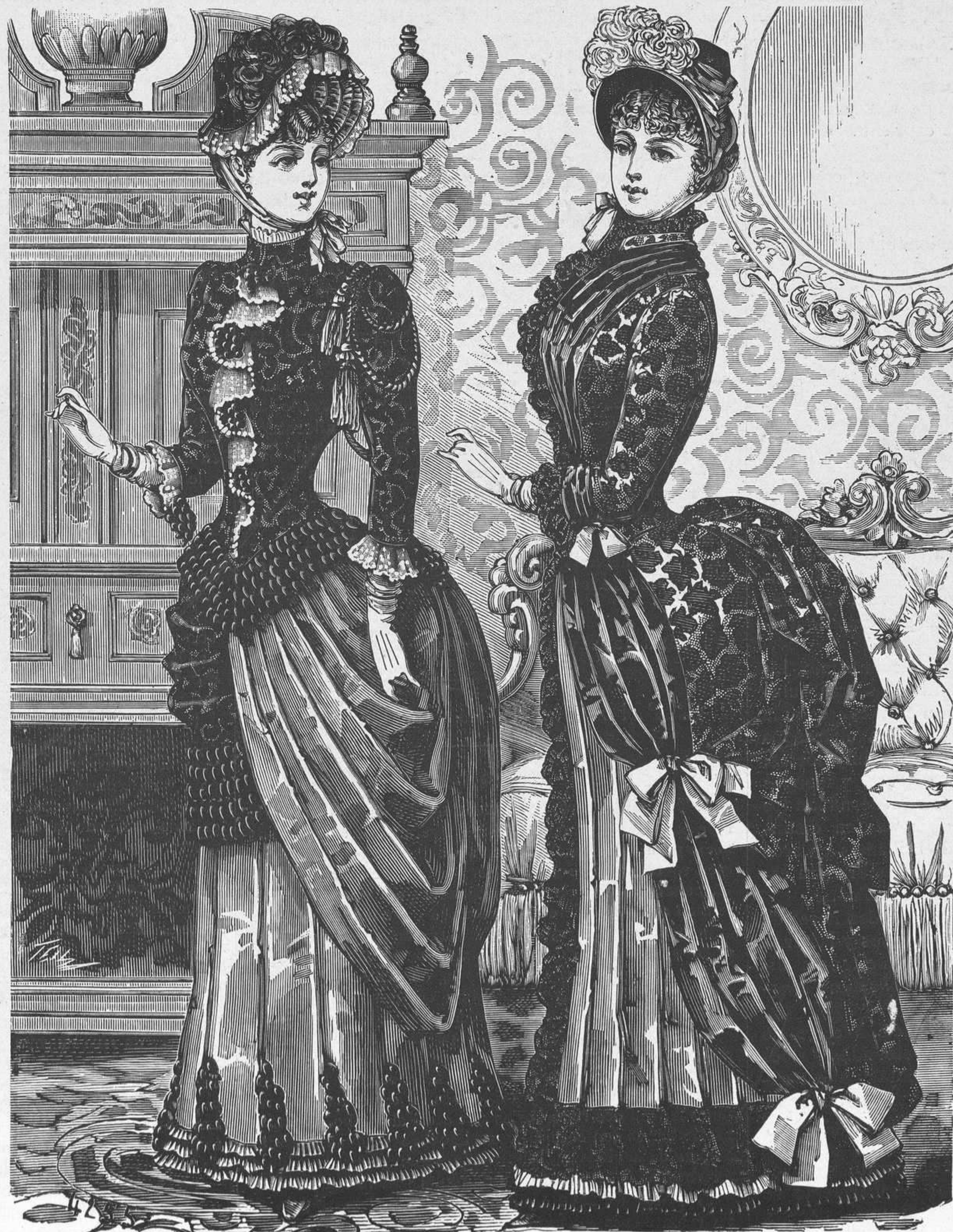
1 y 2.—Trajes de visita.

En ella leyó Rodríguez Correa un chispeante ar-