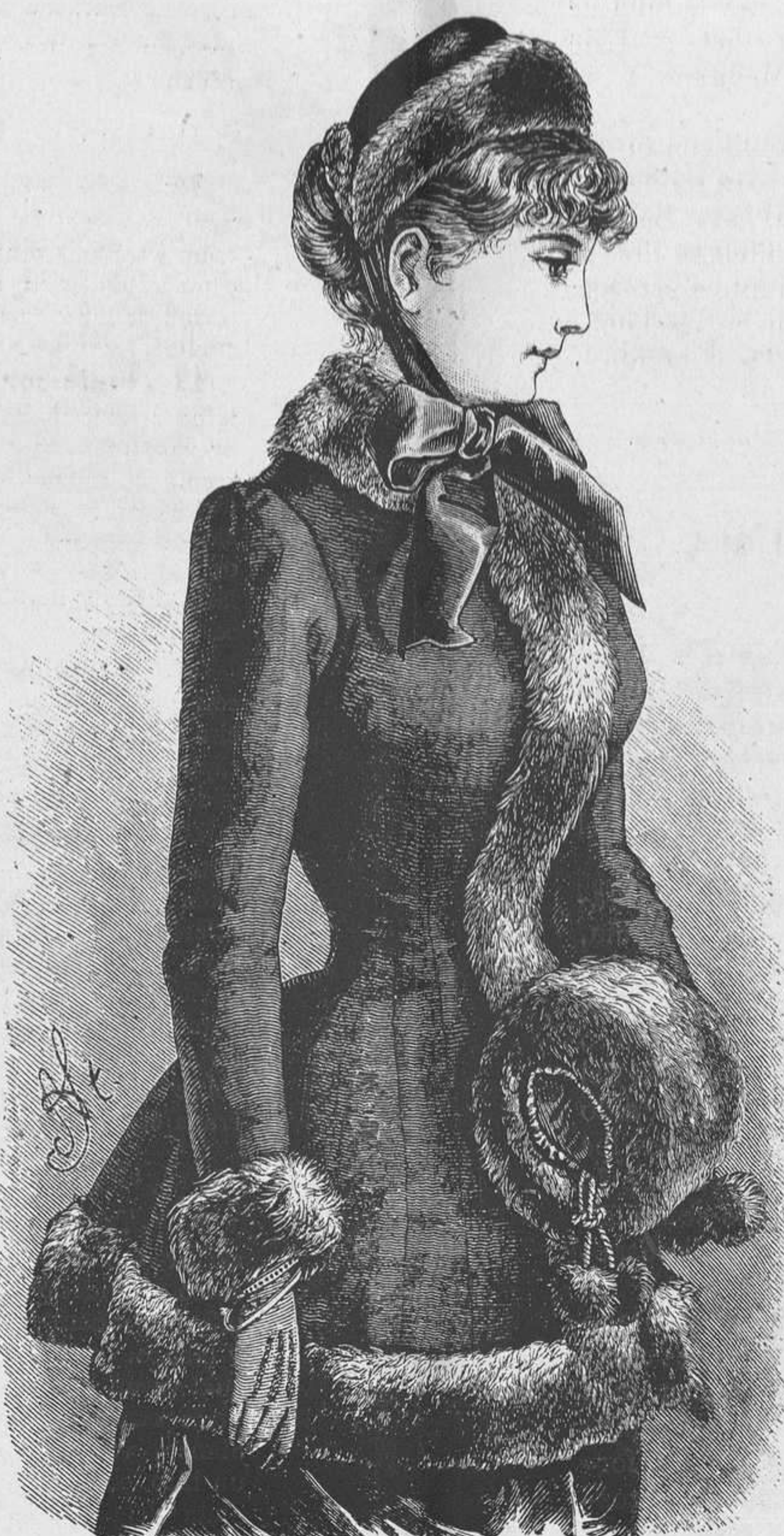
6.—Paletot guarnecido de pieles.