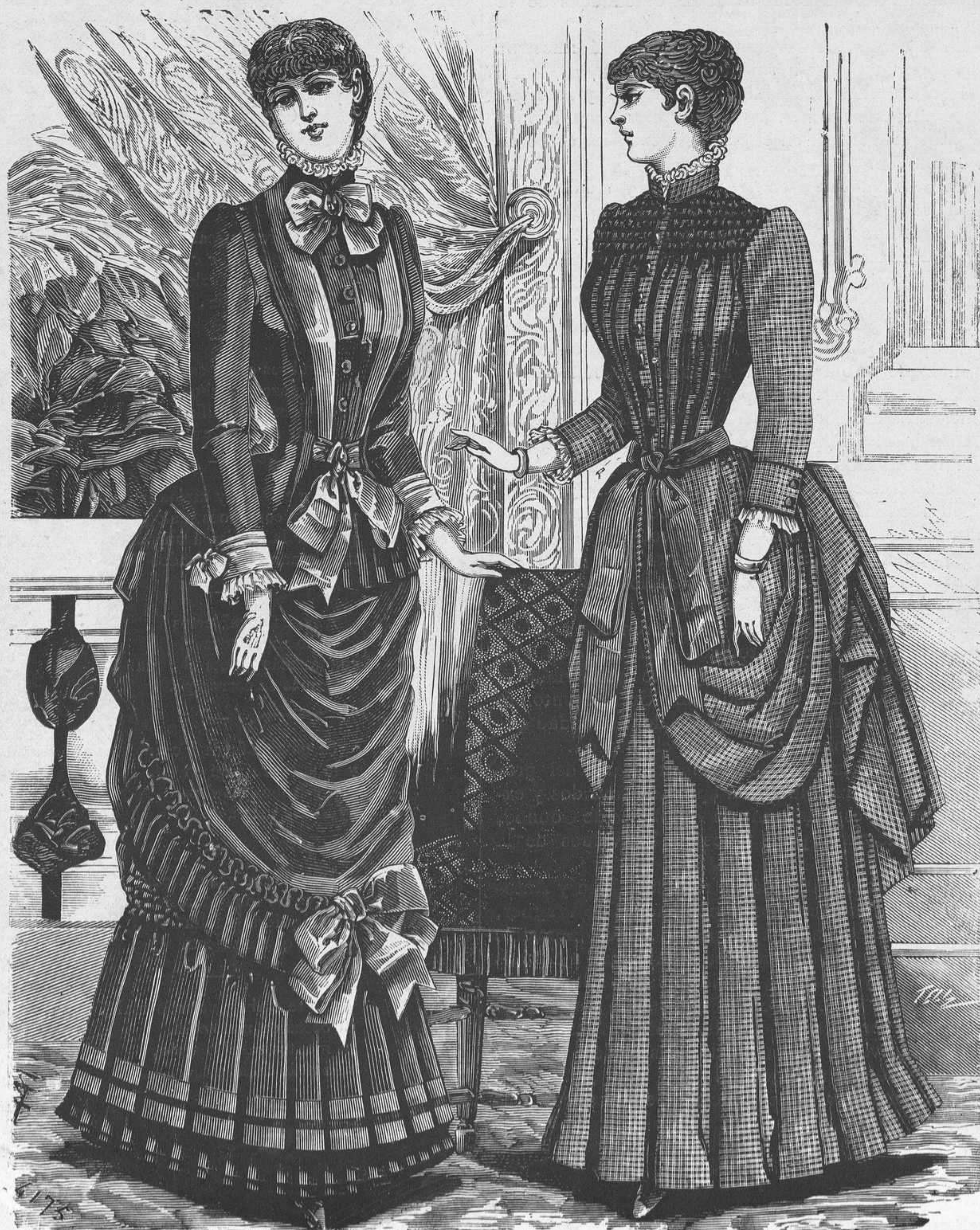
10 y 11.—Trajes de casa.