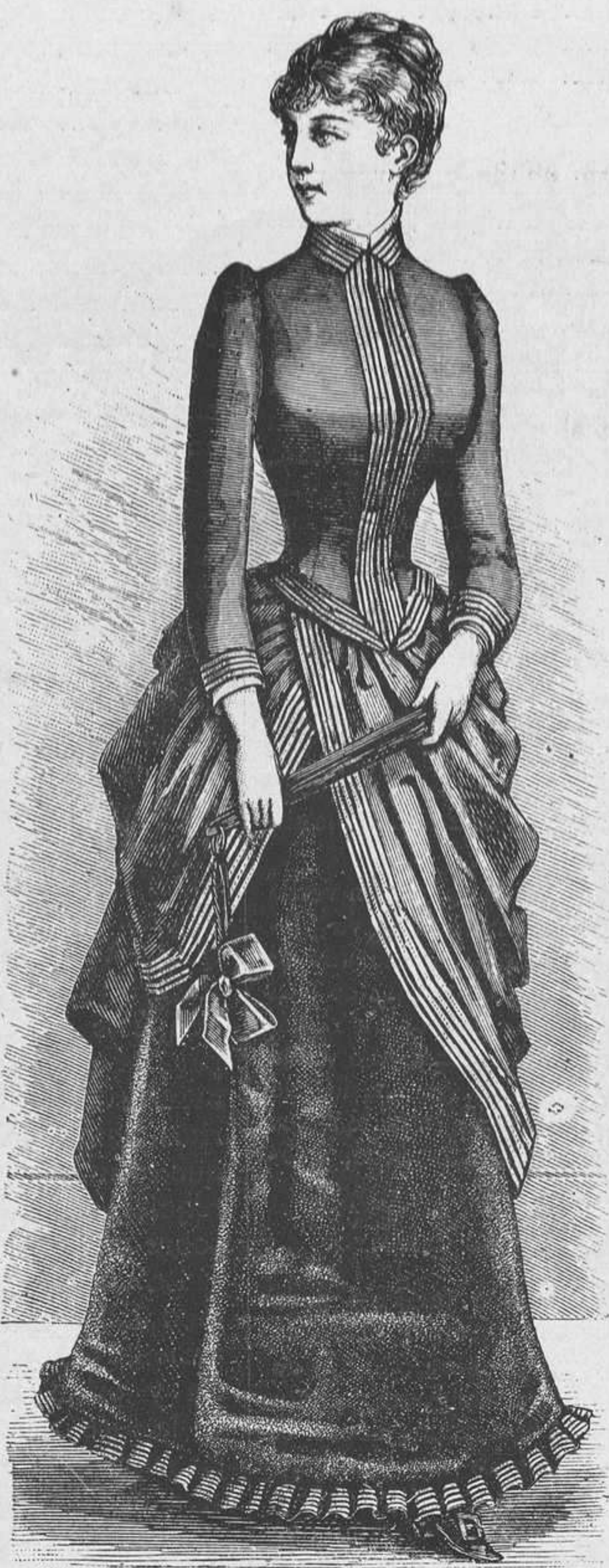
5.—Traje de dos telas.