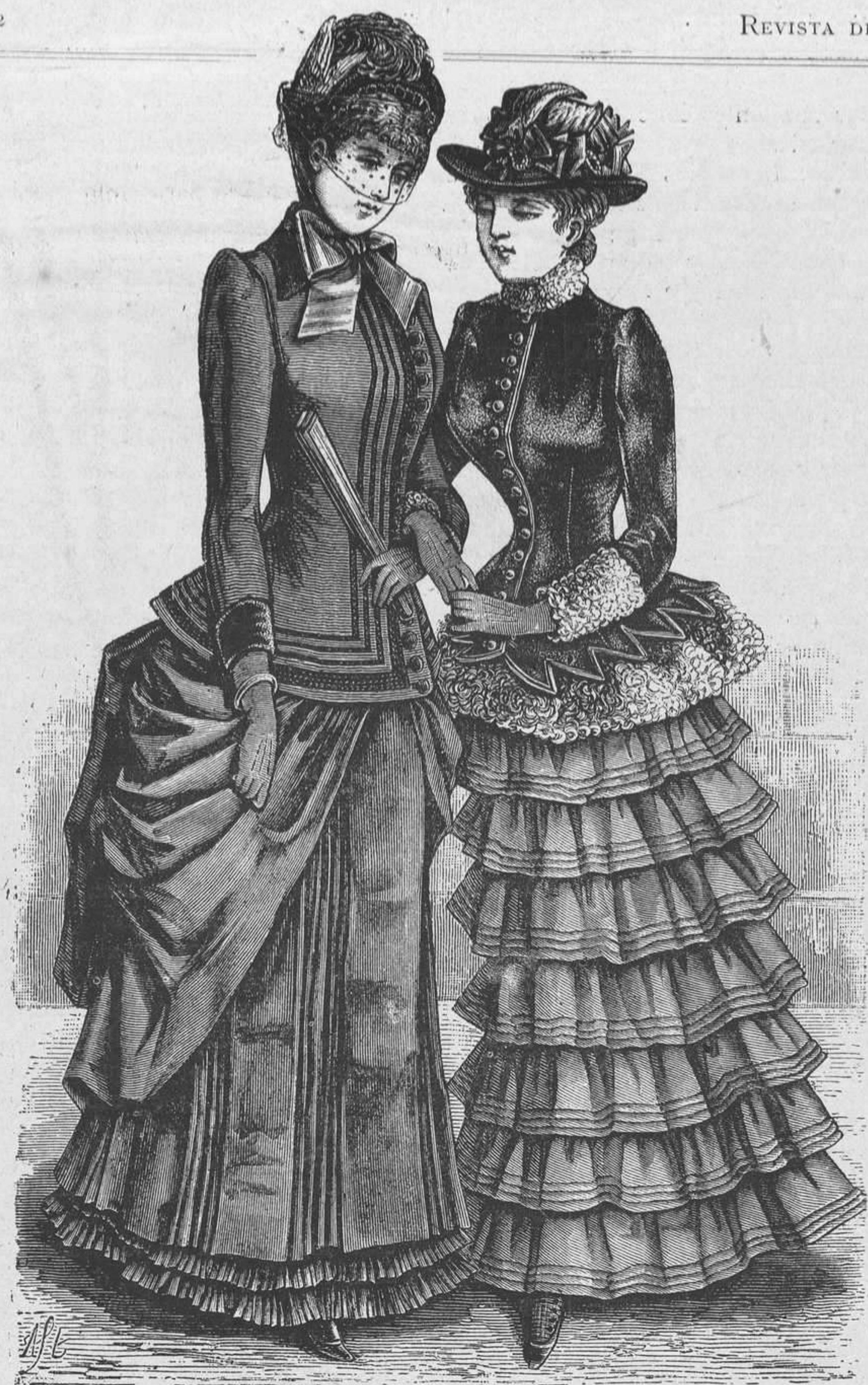
3 y 4.—Trajes de paseo.