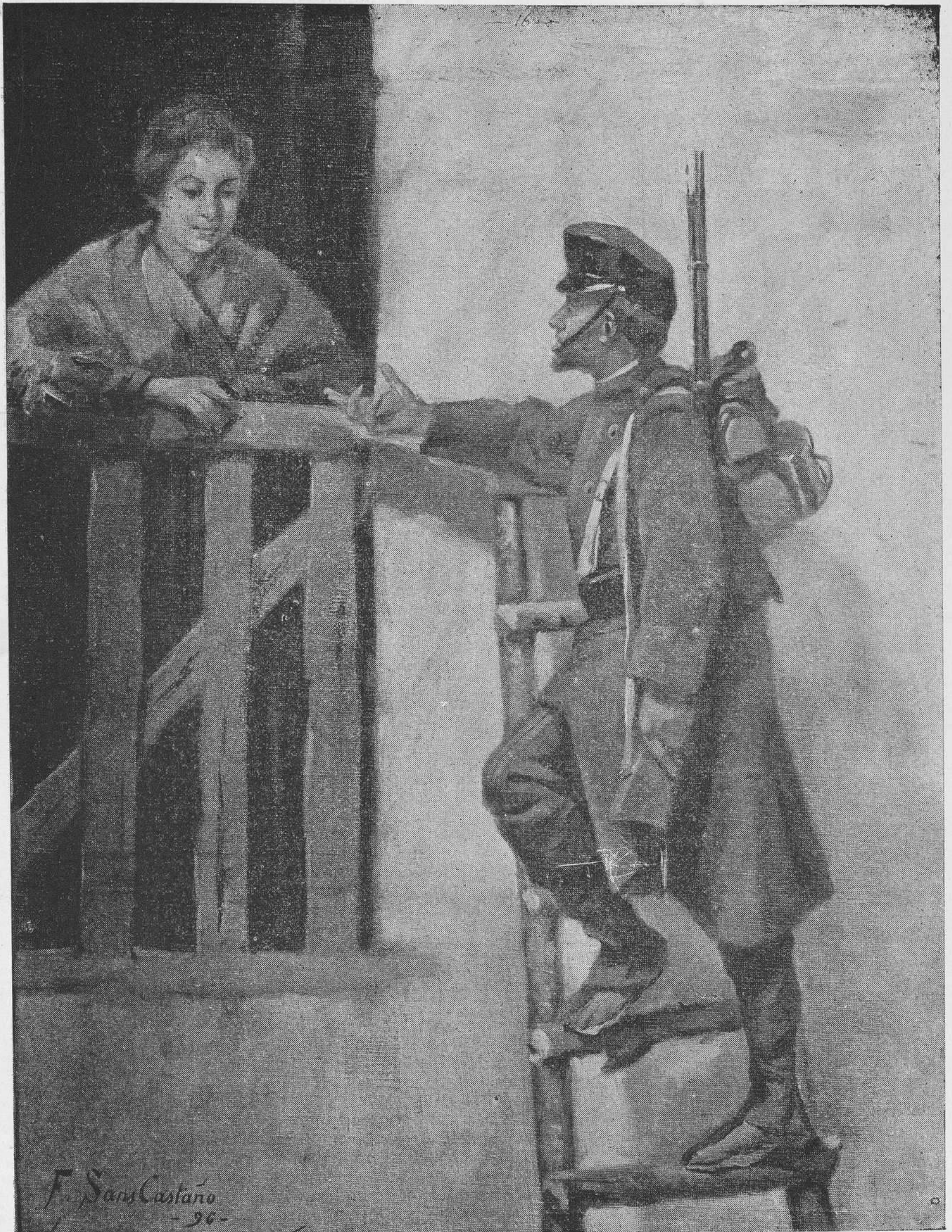
Atacando una fortaleza.