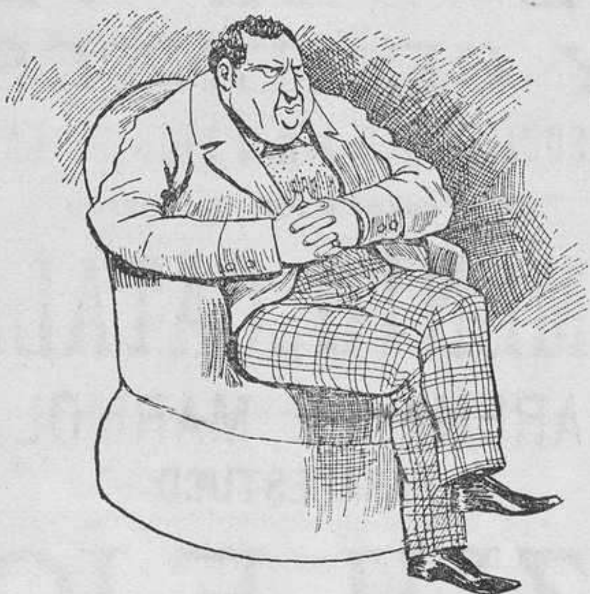
Los montañeses ricos.