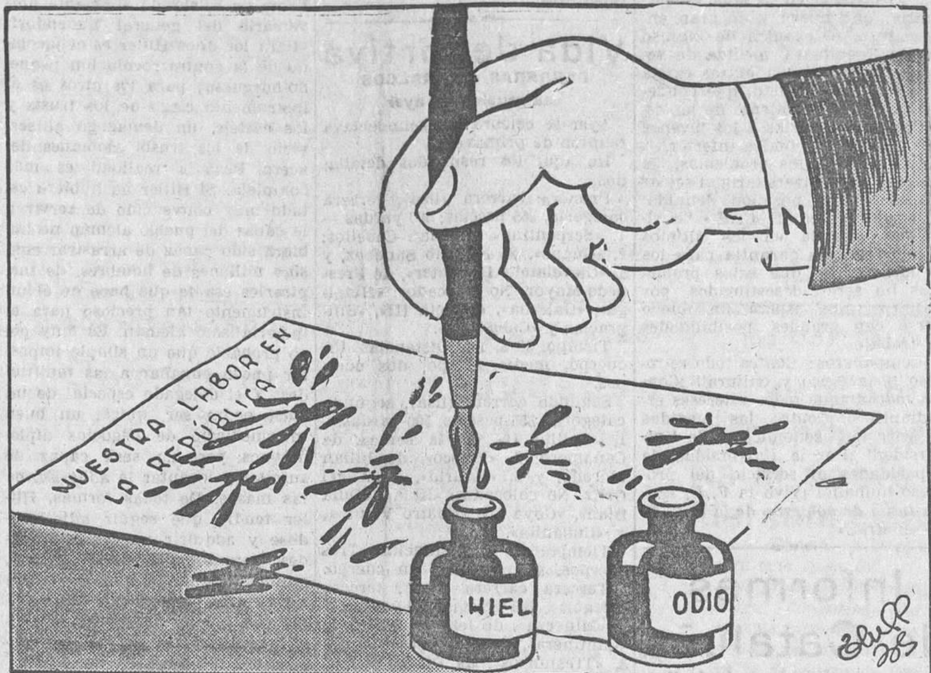
PLUMA EN MANO, por Bluff Así se escribe la Historia... cedística

Sin embargo, la segunda parte de la nota que comentamos, la referente al proyecto de emisión de bonos por valor de 40 millones, será examinada y estudiada por nosotros con todo cuidado. Hay que oponerse resueltamente a que se dañen, por apetencias inagotables y aunque en menor proporción, los intereses nacionales.