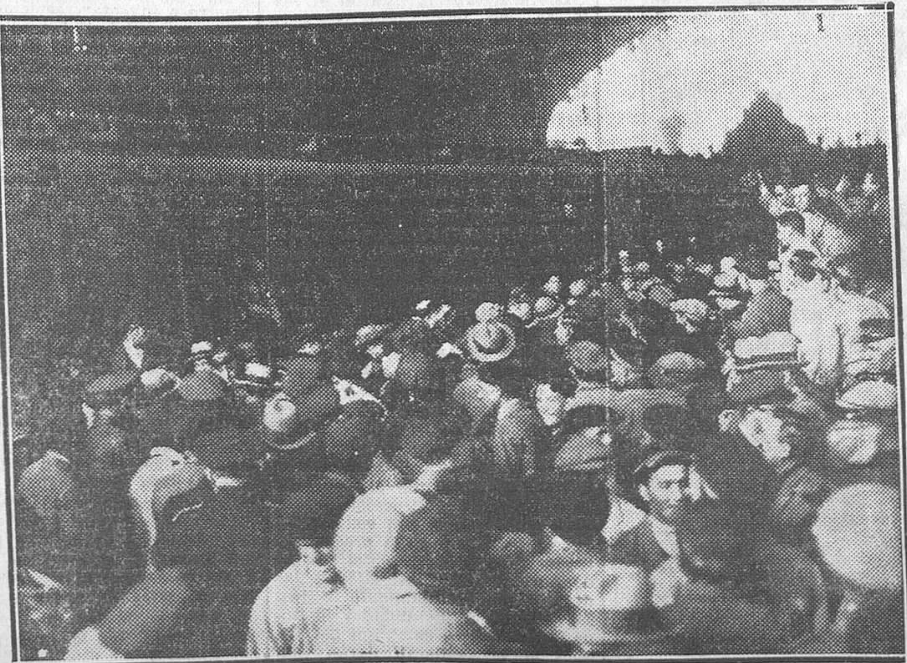
Llegada a Madrid de los oficiales sublevados en Jaca que cumplan condena en Mahón, y a los que la República ha liberado

Contestó el ministro que era este asunto del Gobierno, y no del ministro, y que ya es cuestión re-