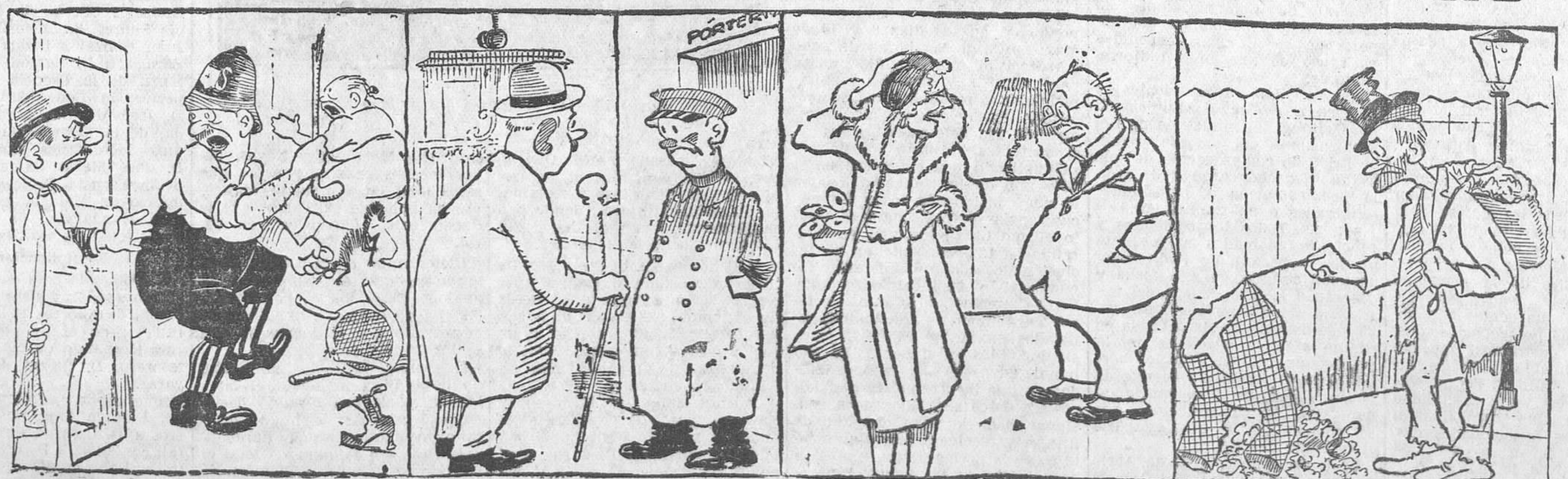
—¡Pero por qué pega usted a la parienta, señor Ulogio? —Porque ya llevaba la mar de días sin pegar a nadie. —Y díos usted que se ha mudado otra vez? —Sí, señor. Al centro izquierda. —¡Pero cómo quieres que te ame, si has dejado de ser gentilhomme! —¡Vaya! Por fin han ido a parar a la basura.