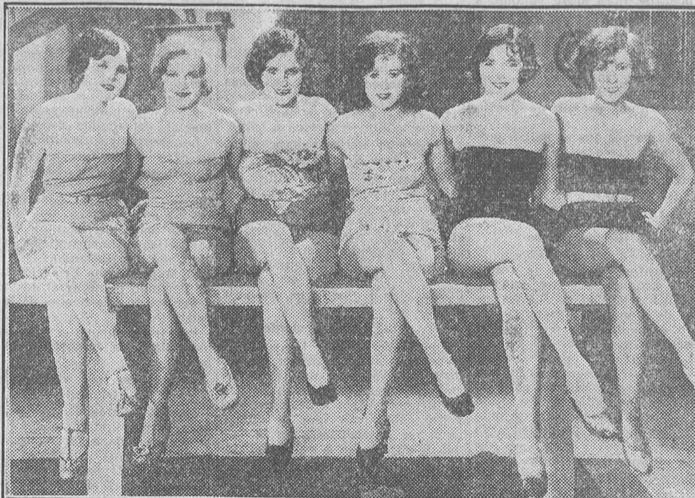
HE AQUI UN GRUPO DE «EXTRAS» DE HOLLYWOOD. LAS PRETERIDAS QUE ESPERAN LA LLEGADA DE LA GLORIA EN FORMA DE CONTRATO

ce dos cintas cortas en vez de una larga, el rendimiento artístico y económico puede ser superior. Después de las superproducciones estilo «titanic» se avecina una reacción hacia las cintas cortas. Cada día pesan más los prólogos interminables y se aguantan menos los finales «estirados». El público boicotea hasta que la acción empieza, y tan luego como conoce el desenlace abandona el asiento, y pronto el obligado beso final de los cine-dramas no lo verán más que los acomodadores.