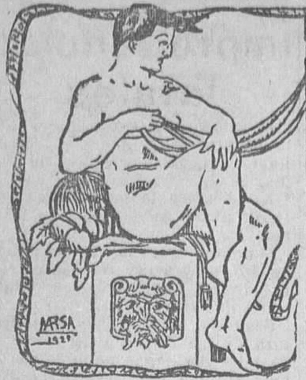
SE IMPONEN LAS TIJERAS