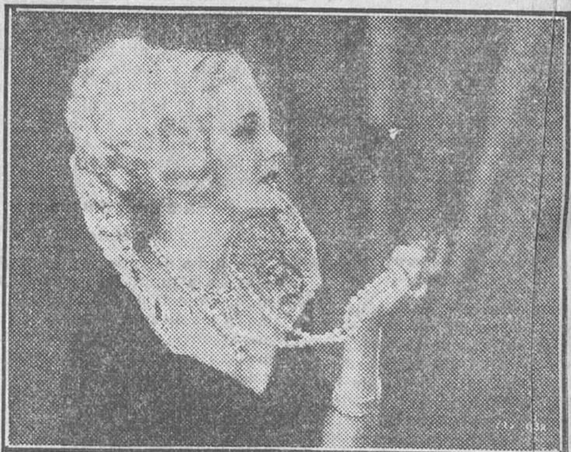
LA BELLISIMA ESTRELLA DE LA FIRST NATIONAL MARY ASTOR, EN LA PELICULA «HEART TO HEART»

John Gilbert, el galán de simpática prestancia, artista que cuenta con indudables predilecciones y