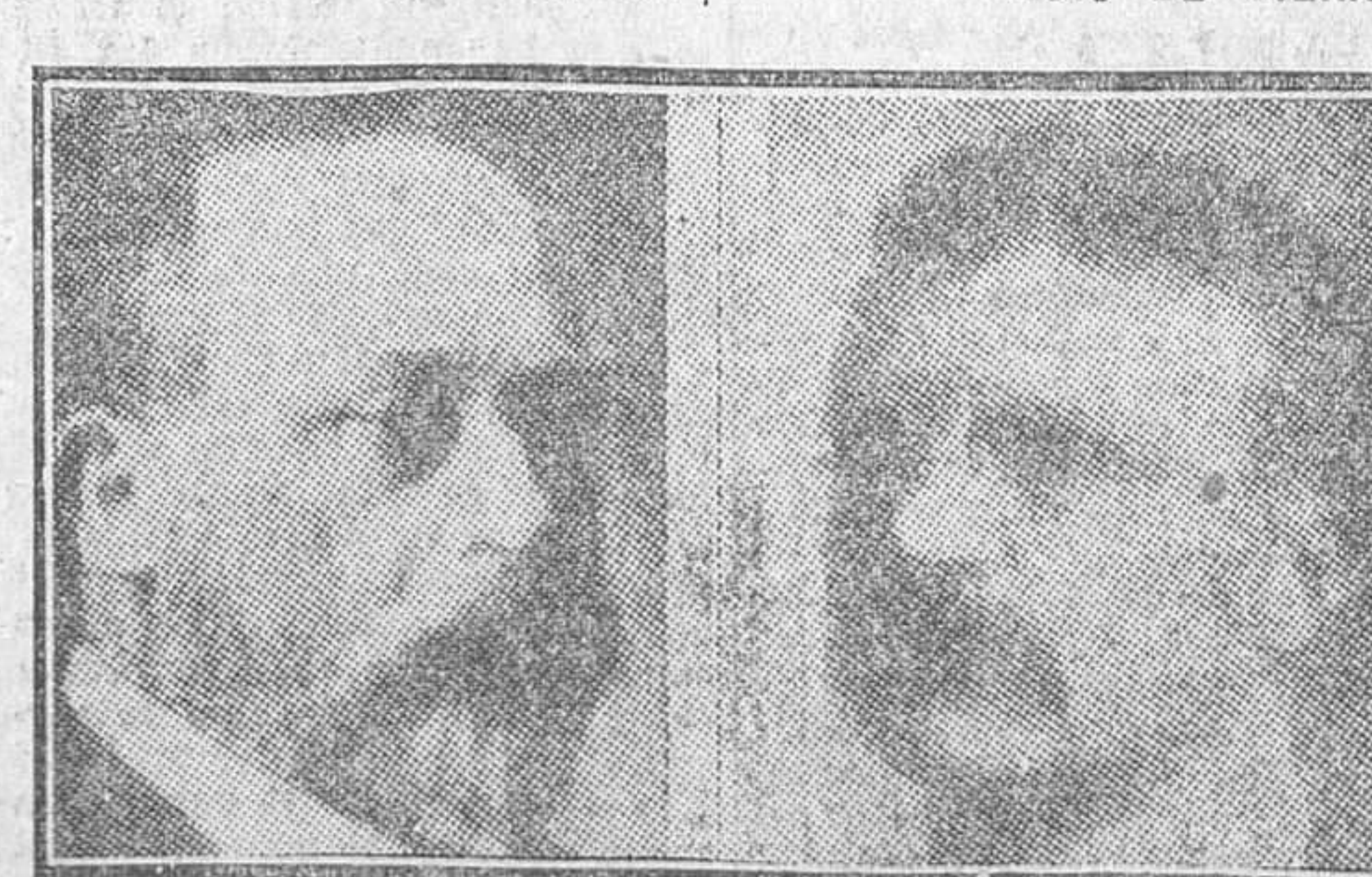
Fotografías de Eduardo VII de Inglaterra y Roosevelt, transmitidas en doce minutos en el circuito Munich-Nuremberg-Munich, el año 1907