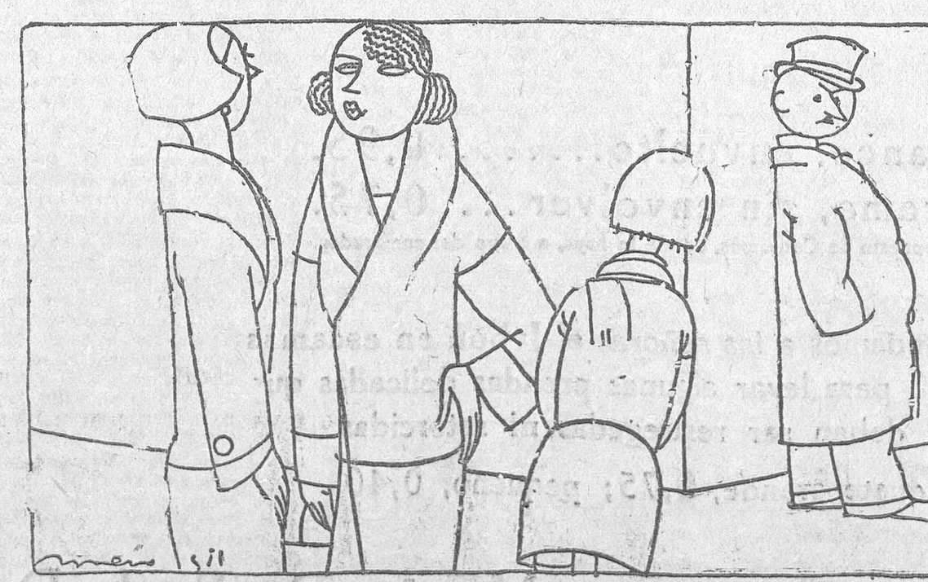
—¿Quién será ese pelma, que no cesa de mirarme las pantorrillas? —A lo mejor es un higienista.