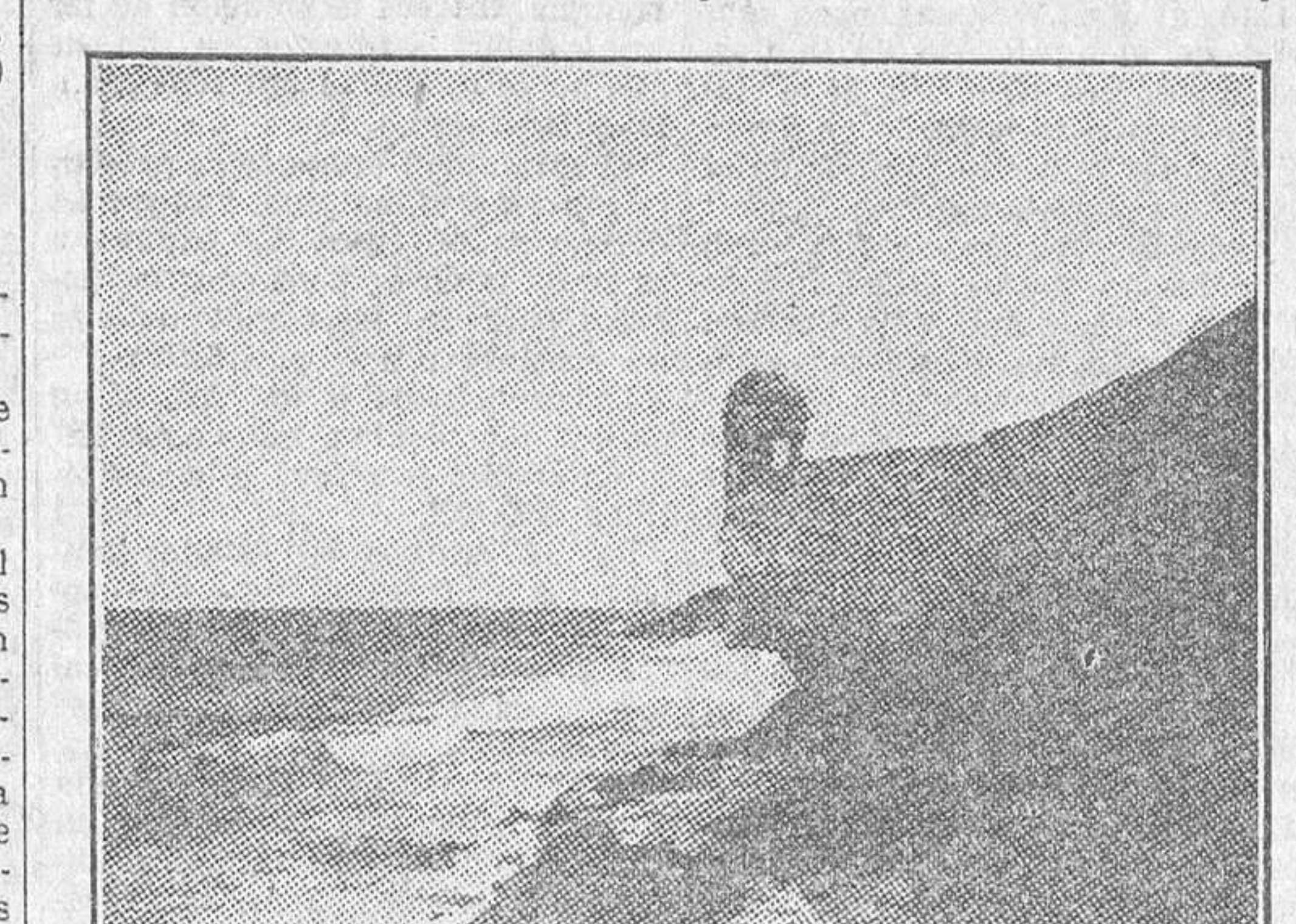
SAN JUAN DE PUERTO RICO.—La Garita del Diablo

Dejamos, afortunadamente, el «Guanánamo», un barquichuelo horrible que hace la travesía entre Santiago de Cuba y Santo Domingo. Un barco pésimo, donde, por el calvario de unas horas de mar, se le cobra al pasajero casi lo mismo que por venir a España. Esta otra nave que nos recoge, a media noche, en el río dominicano y nos pone a la mañana siguiente en el puerto de San Juan de Puerto Rico, es un poco menos incómoda. No tiene fanfarrias de caporal marino que ha llevado en su vientre maderas