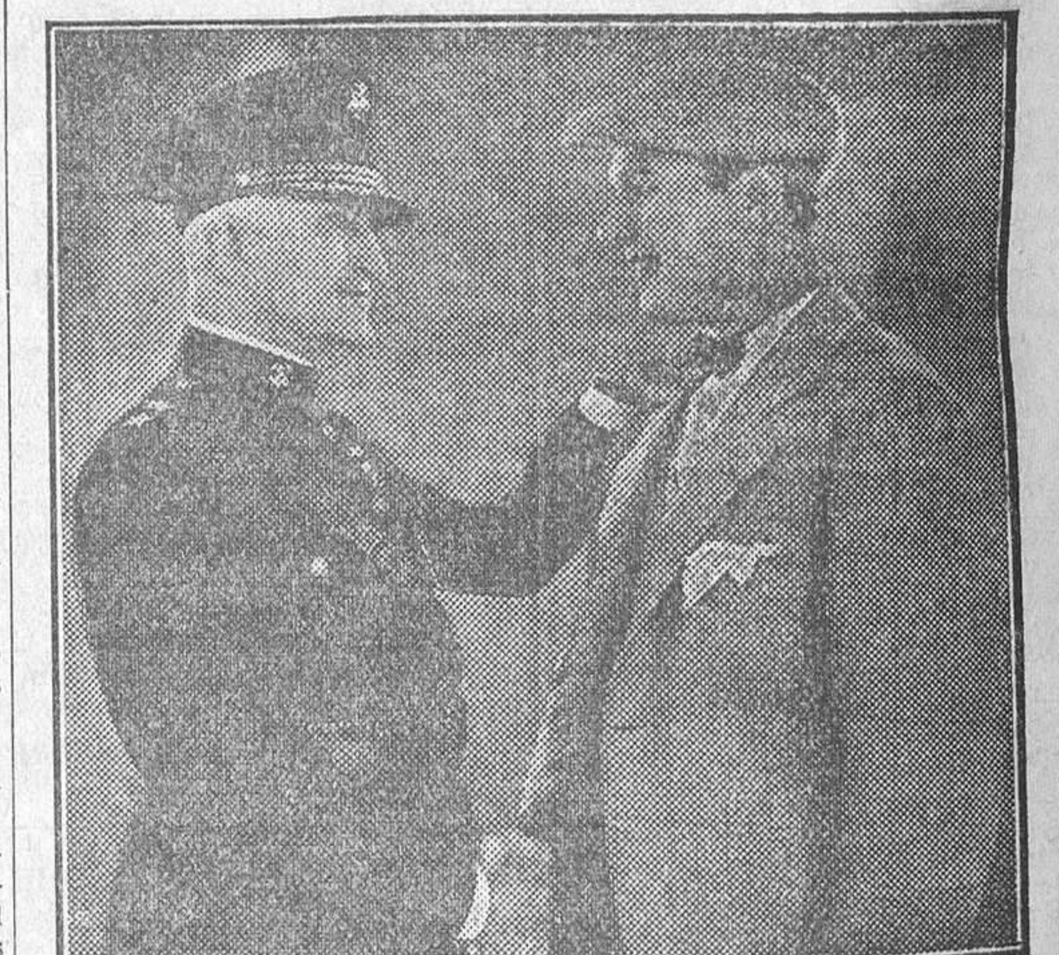
LOS FAMOSOS ARTISTAS LON CHANEY Y WILLIAM HAINES, EN «EL SARGENTO MALACARA», SUPERPRODUCCION METRO-GOLDWYN QUE SE EXHIBE EN EL CINE DEL CALLAO