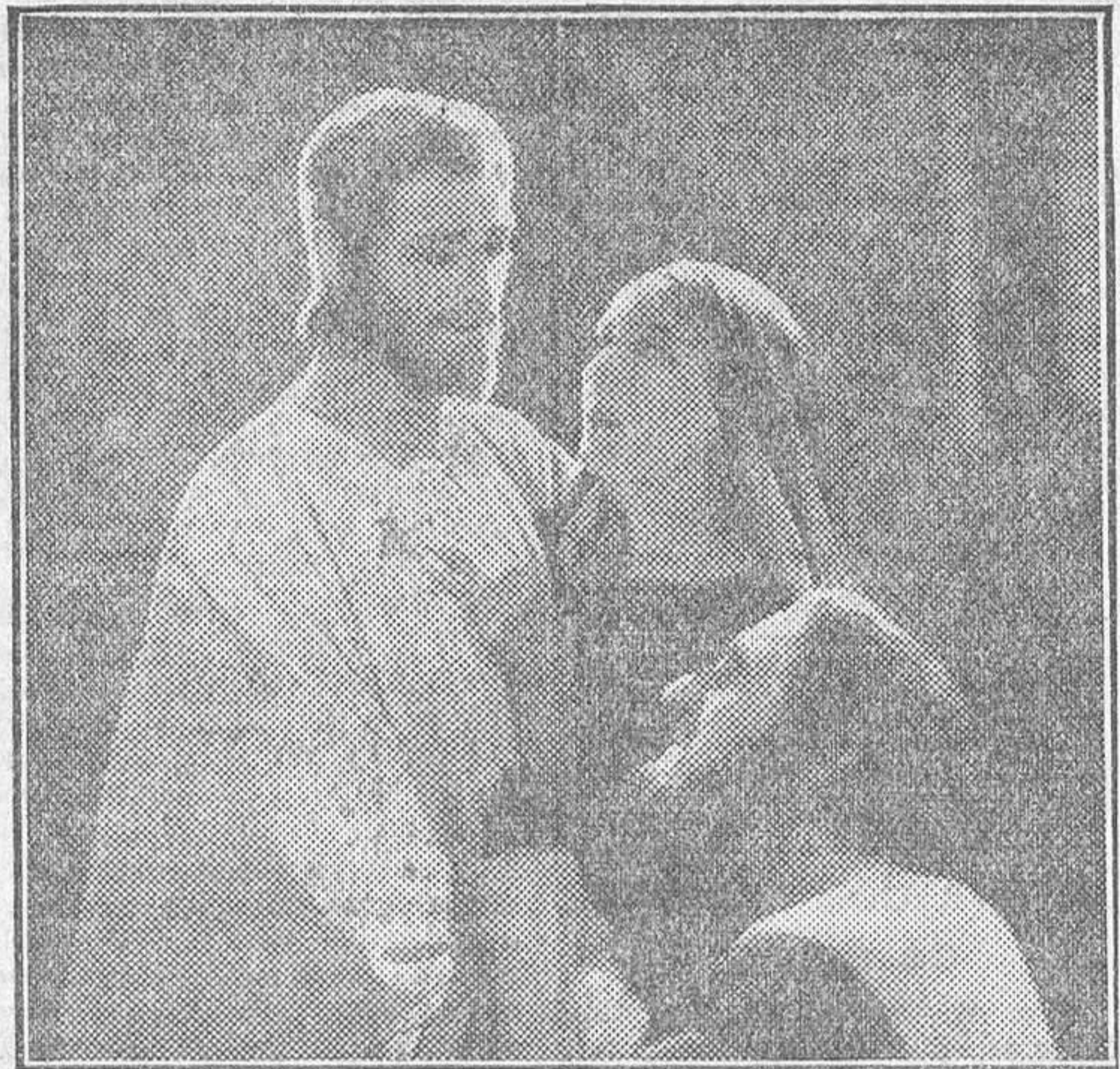
UNA BELLISIMA ESCENA DE LA GRANDIOSA PELICULA DE PRO-DISCO, «EL REY DE REYES», ESTRENADA ANOCHE EN EL TEATRO DE LA ZARZUELA

Al recibir hoy la anterior carta, después de agradecer la deferencia que supone, entendiendo que nuestro deber es reflejar en estas páginas, más que nuestra propia opinión, el criterio de los elementos interesados en el desarrollo del cine y, especialmente, el criterio del público, publicamos la carta y las peticiones para que sirvan de orientación a