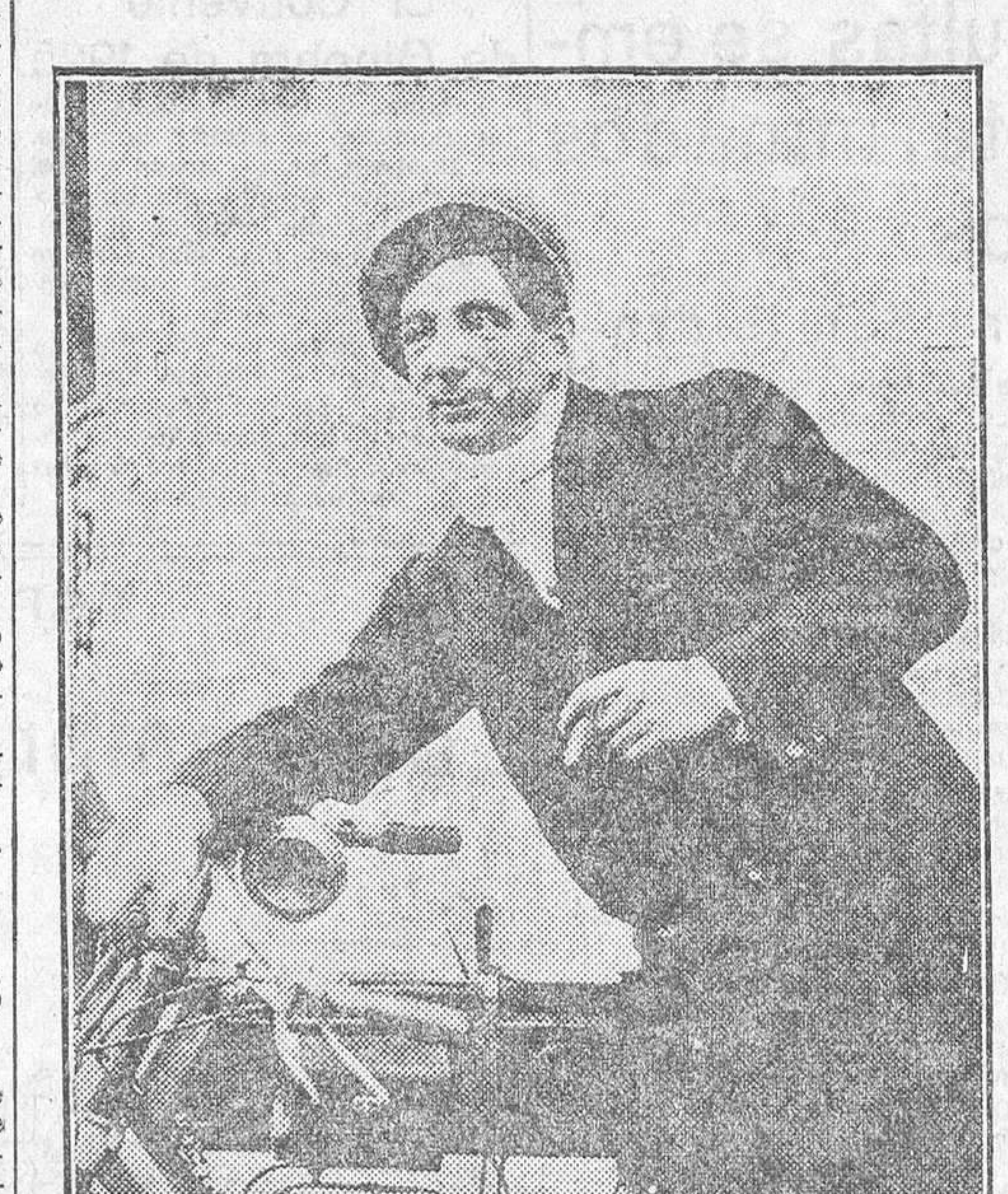
Cocherito de Bilbao

En el Sanatorio del Guadarrama falleció ayer mañana, a las doce y media, el famoso y popular ex matador de toros César Jaureguizar Ibarra (Cocherito de Bilbao).