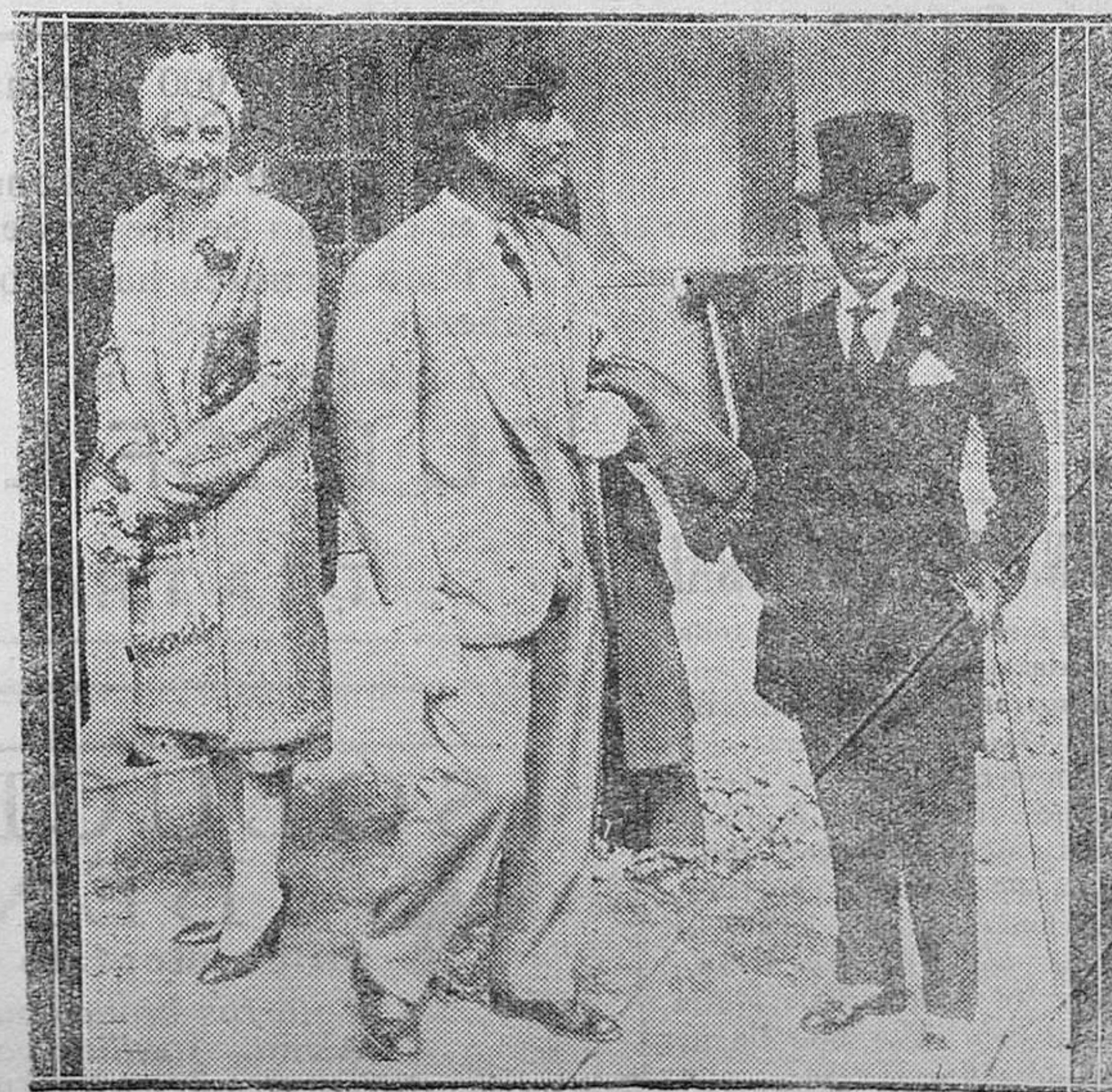
BARCELONA.—Llegada del nuevo embajador de Italia conde Durini di Mouza, desembarcando del vapor «Conte Rosso»

Así, por ejemplo, ahora está de moda la luz del sol. ¡Guárdenos Dios de afirmar que los rayos del astro no producen determinados beneficios a los animales—incluso el hom-