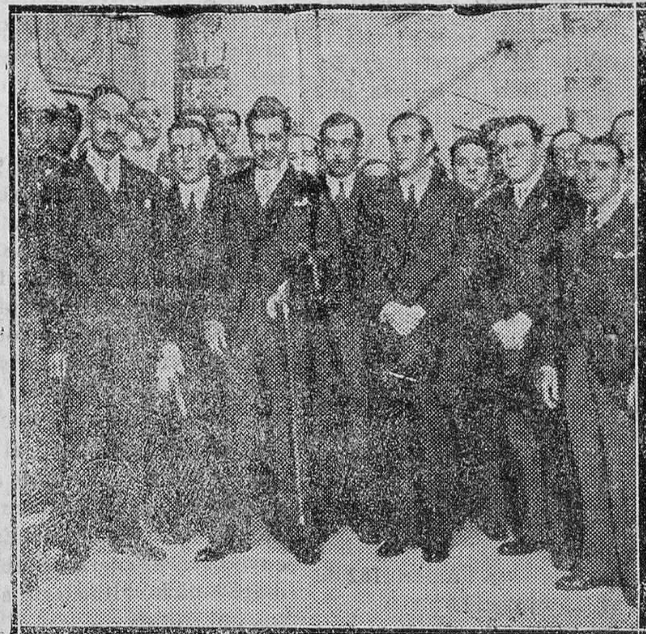
BARCELONA.—Las autoridades inaugurando la Feria Comercial de Barcelona