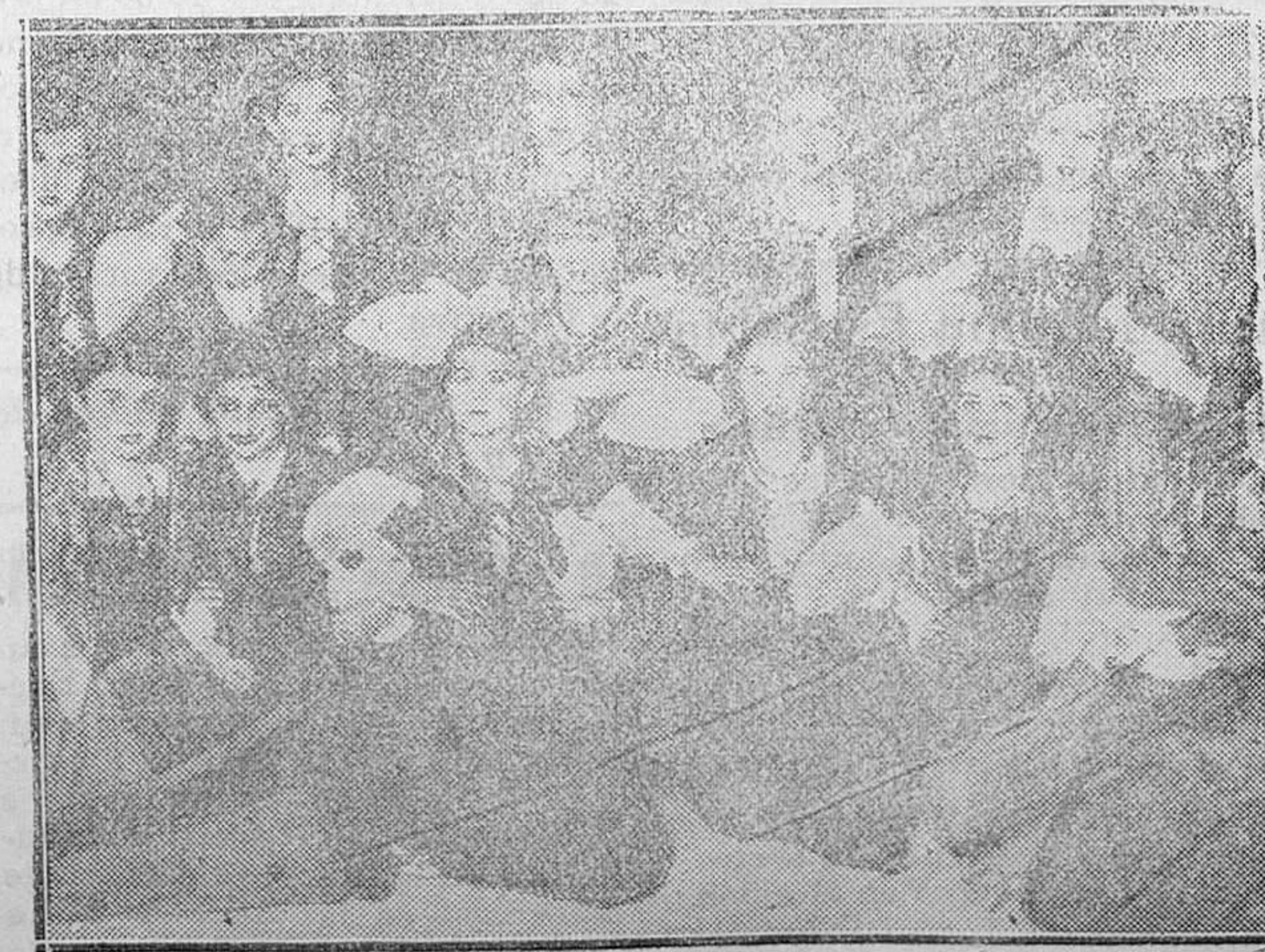
MADRID. - En la Comedia. - Señoritas que tomaron parte en la función a beneficio del Repro de Nuestra Señora del Prado y Casa Cuna de la parroquia de San Ramón