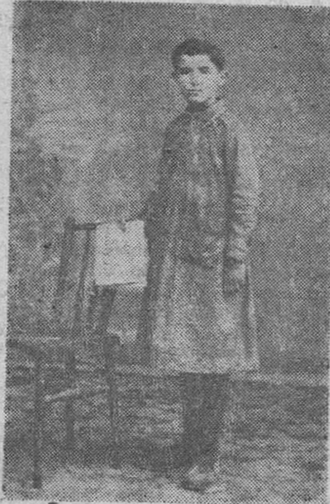
La primera vez que fui nombrado capitán y presidente del equipo Racing del Sepulcro, tenía 15 años. En la mano tengo el primer periódico donde salí en letras de molde.