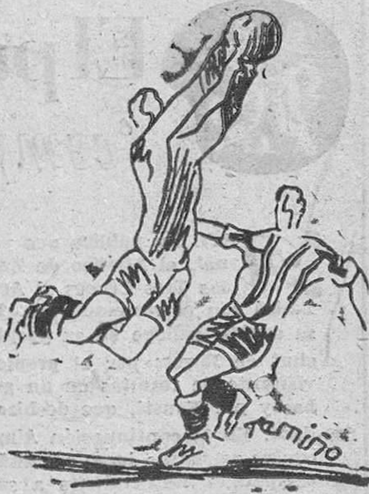
grande frente a un adversario de calidad. Y que seguimos adelante embelados hacia la Liguilla... amén. TIM