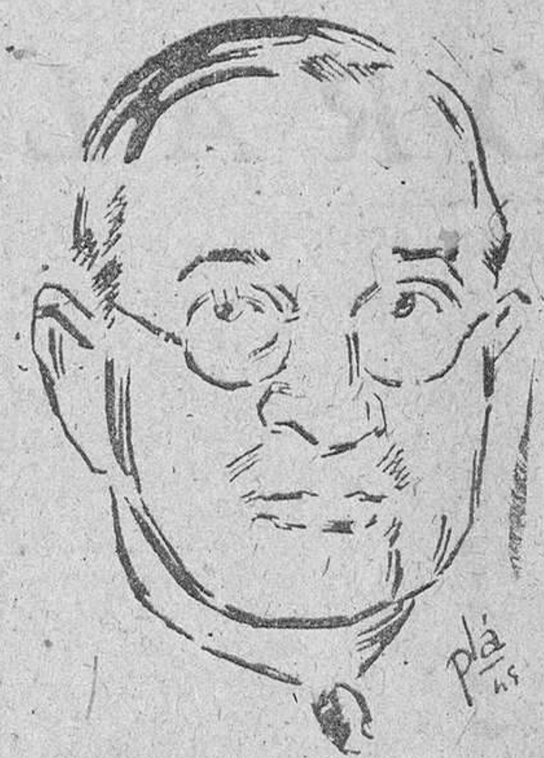
Harry S. Truman

WASHINGTON, 6.—En la primera sesión de paz del Congreso norteamericano, el presidente Truman ha pronunciado un extenso discurso en el que, entre otras cosas, dijo: