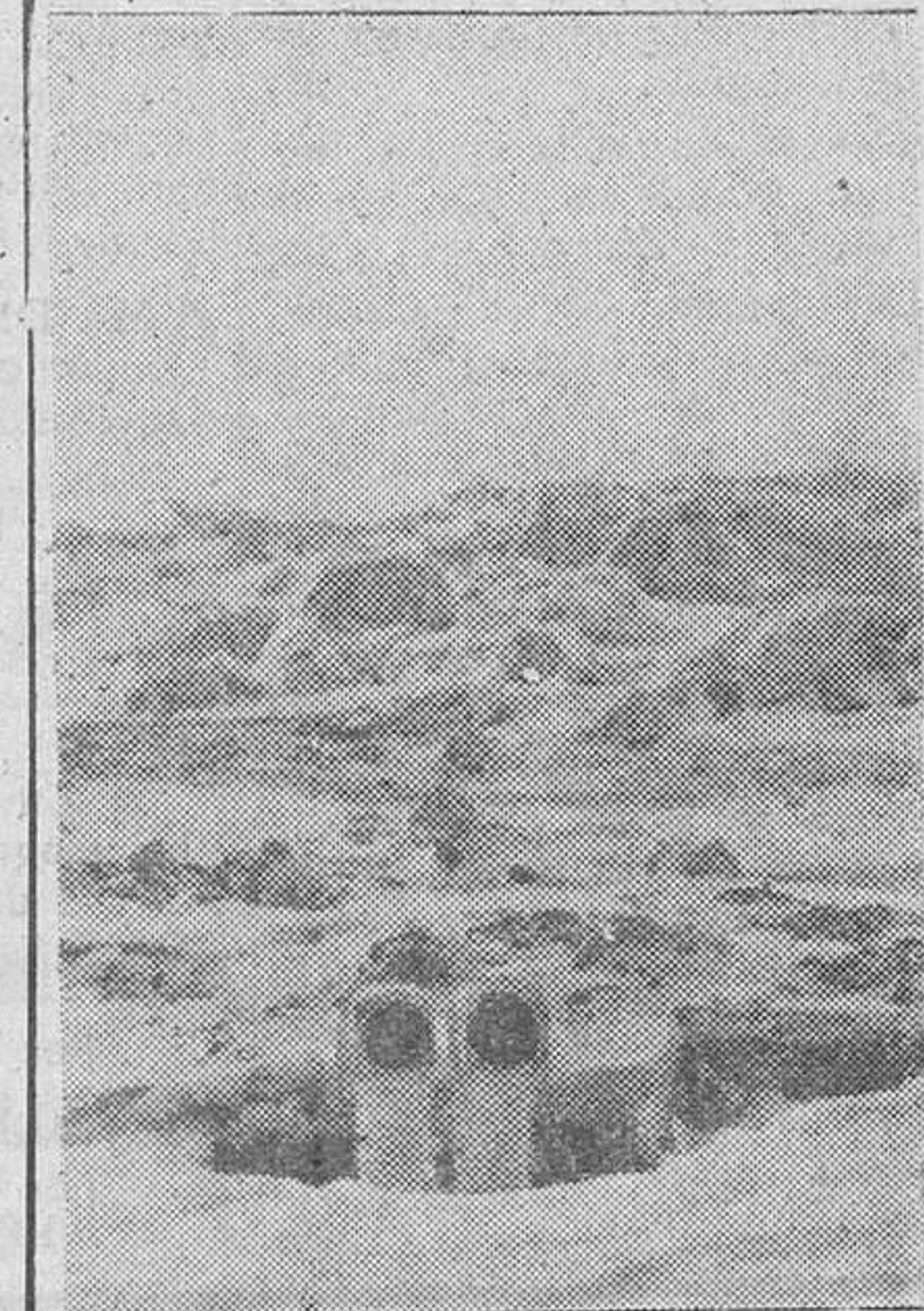
El ojo de la artillería alemana, el telémetro de tijera, busca las posiciones enemigas