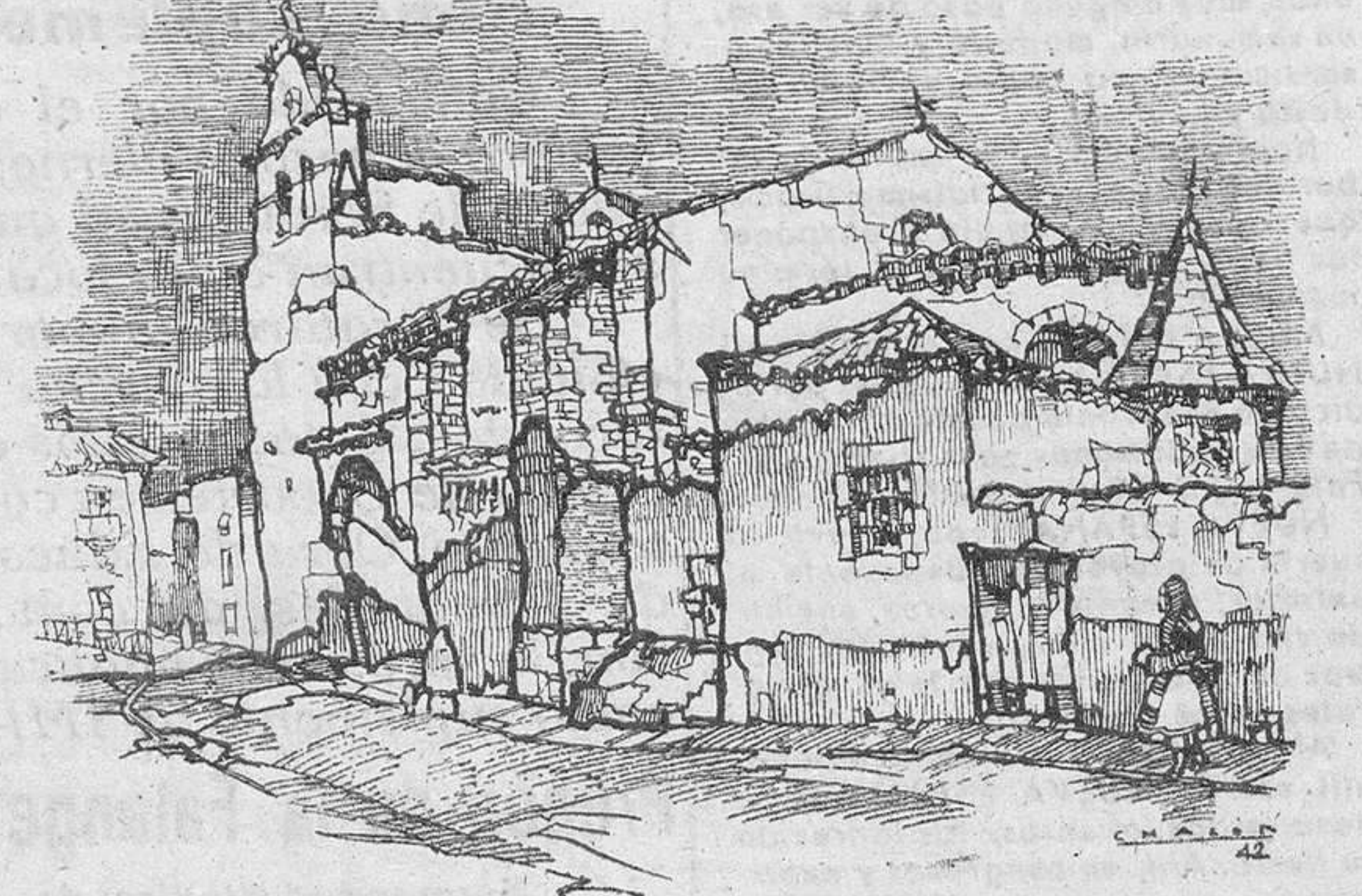
Santa María la Nueva (Dibujo de Chacón)

Por aquellos días, no era precisamente una balza Castilla. Cierzo que la Reconquista va ya avanzada, y a todo lo largo del Tajo han jalonado sus posiciones los guerreros cristianos.