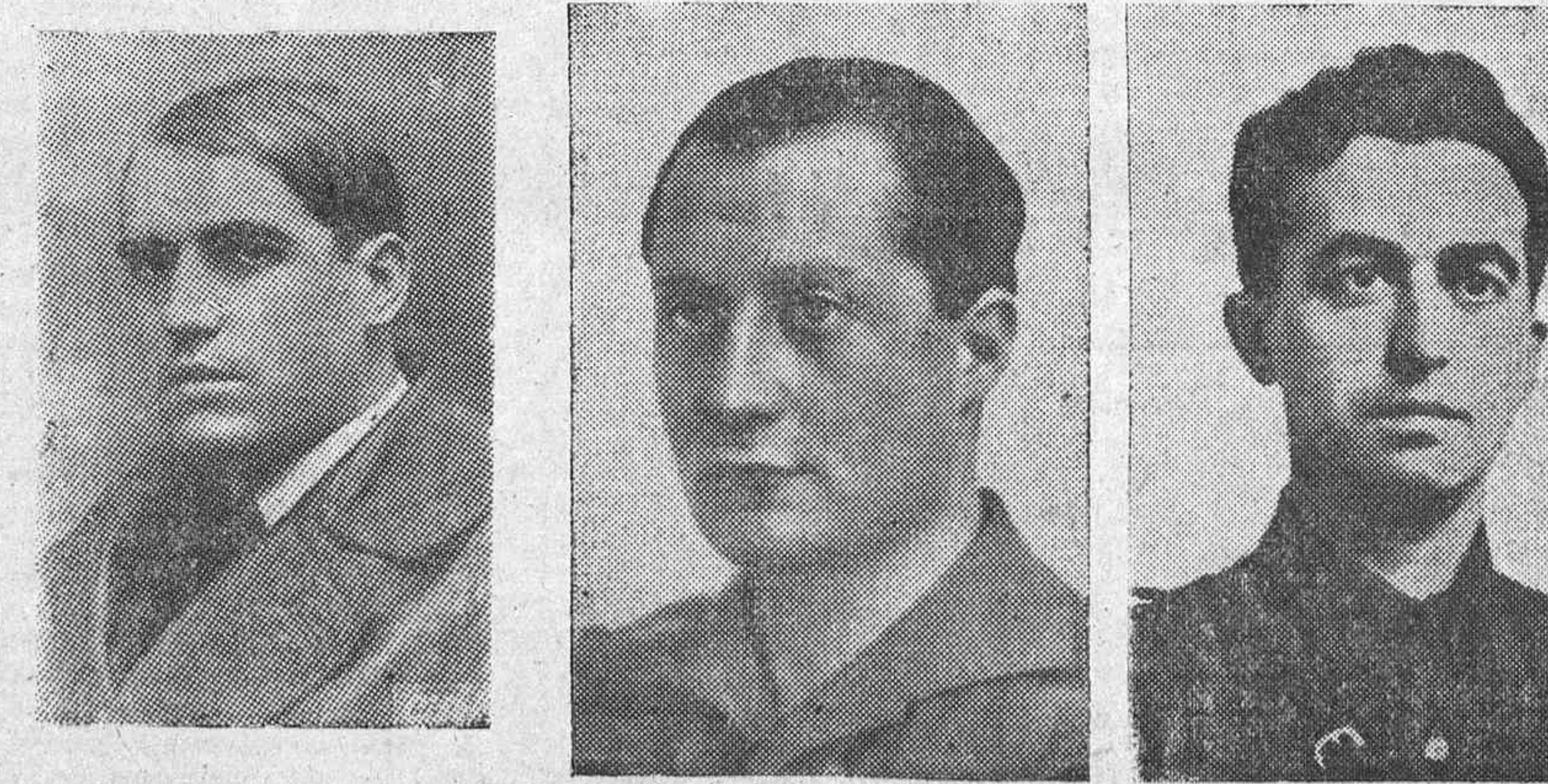
José Antonio Primo de Rivera, Ramiro Ledesma Ramos y Onésimo Redondo, que hoy hace diez años proclamaron la unidad de F. E. y de las JONS en el trascendente acto del Teatro Calderón de Valladolid, sellada la fusión de las dos actividades de la Juventud española.