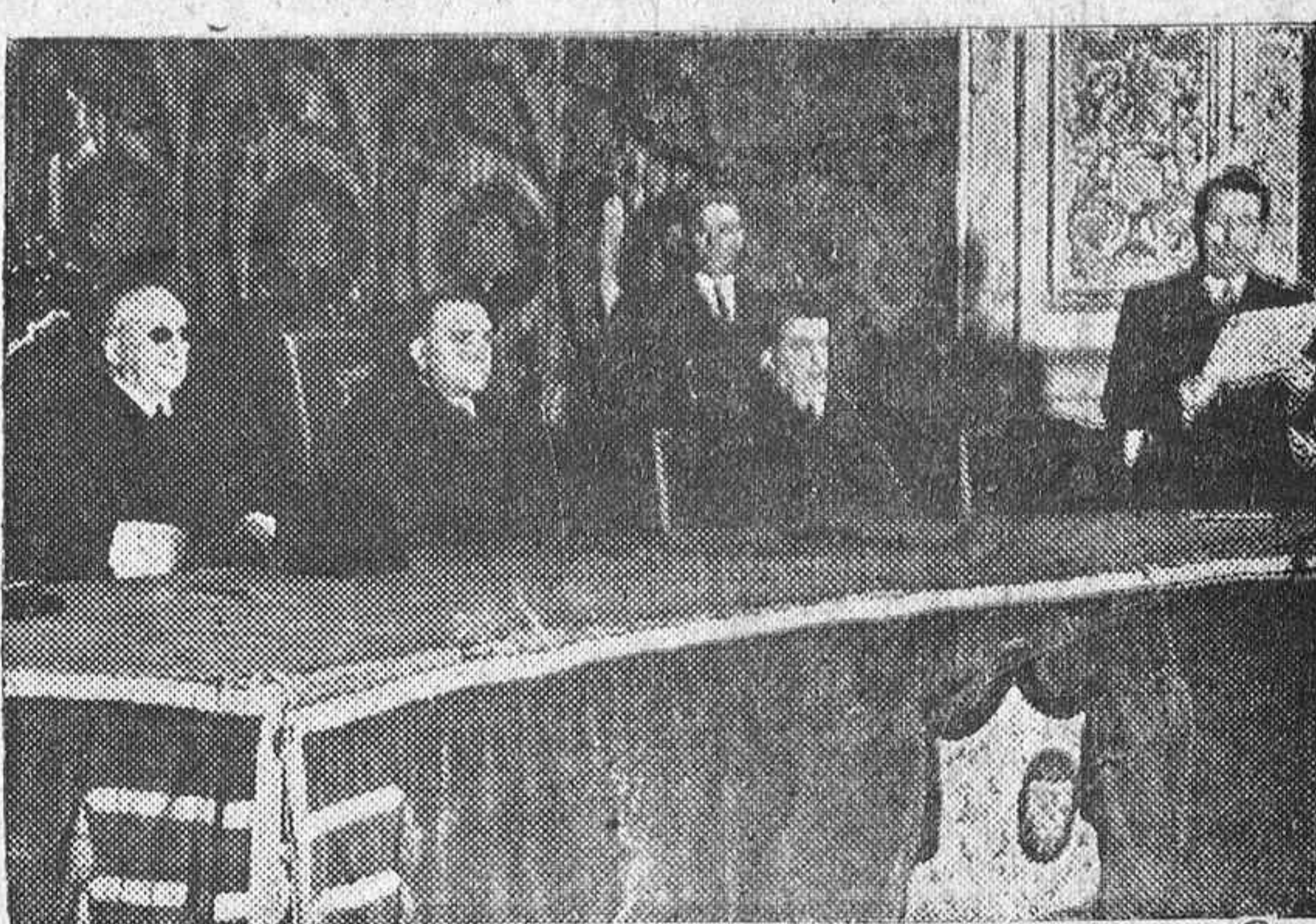
En la Universidad Central de Madrid se celebró la apertura del curso de la Escuela de Estudios Penitenciarios, en cuyo acto pronunció un magnífico discurso el ministro de Justicia señor Azaña.