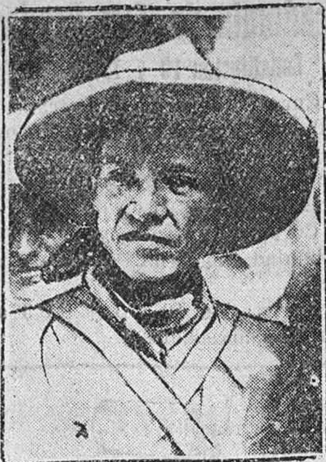
OTRA VEZ SANDINO

Nuevamente ha vuelto la Prensa a recoger noticias de este célebre caudillo nicaraguense. Días pasados, desde Méjico se comunicaba que, Sandino, otra vez en campaña, había batido a las tropas americanas, a las que capturó dos cañones y otros abundantes materiales de guerra.