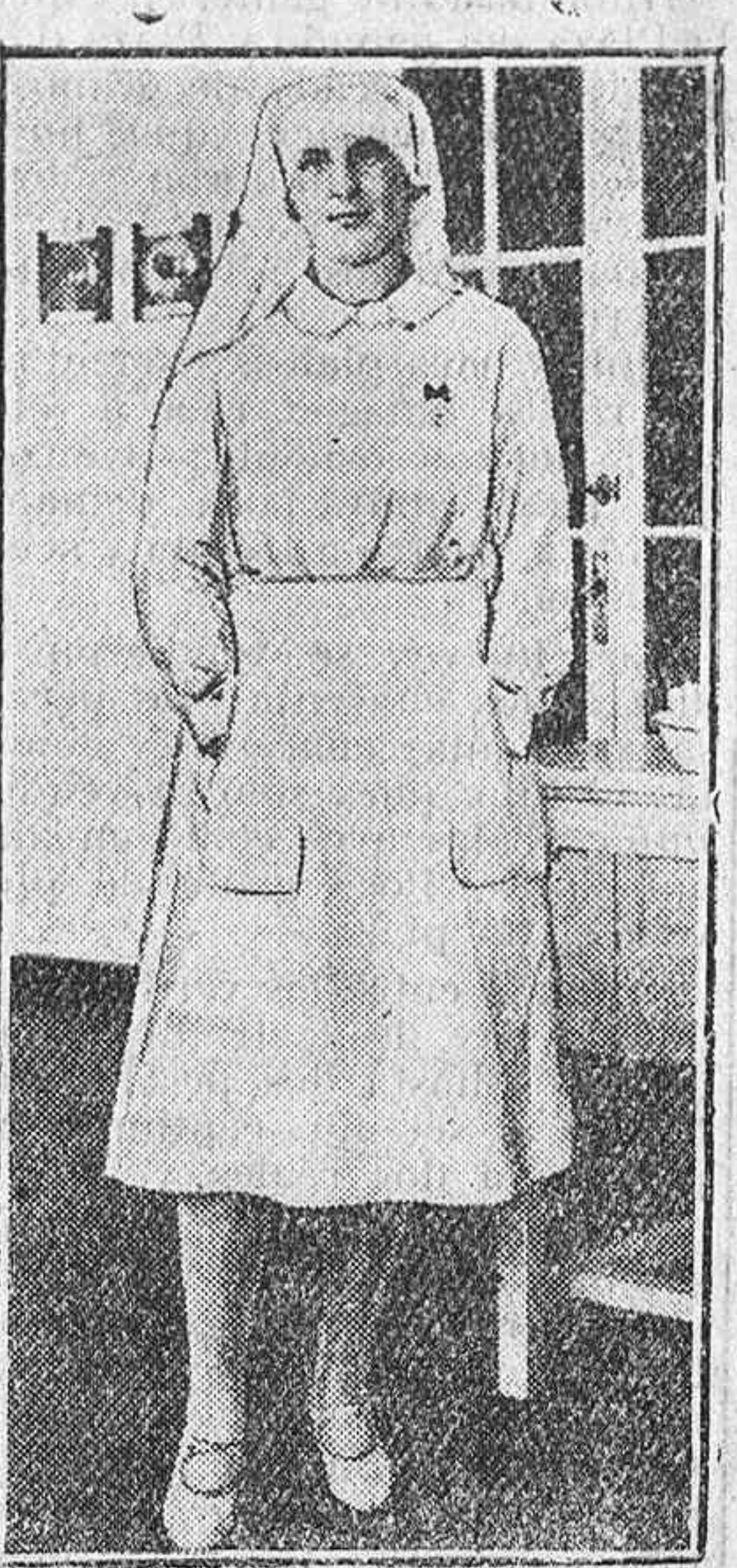
La Infanta Beatriz,

vistiendo su traje de enfermera con el que presta relevantes servicios en el Hospital de la Cruz Roja, de Madrid.