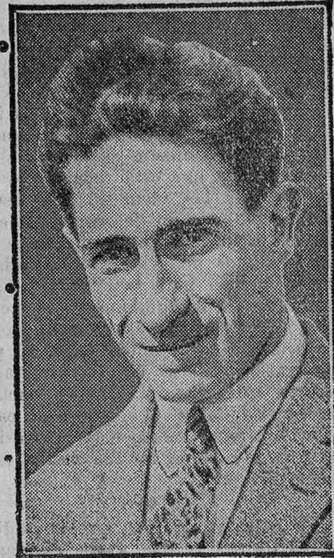
EL PILOTO DROUHIN

Y un seguro de 300.000 francos en favor de su esposa en caso de accidente