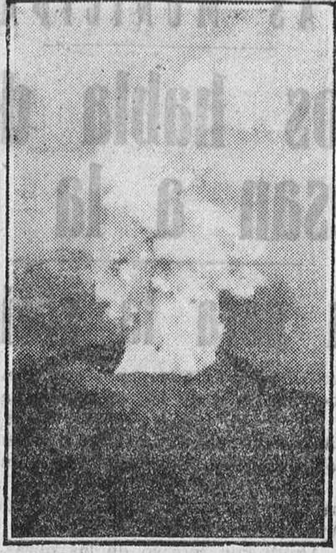
EL VESUBIO EN ERUPCION

El Vesubio se halla de nuevo en erupción. Su aspecto es pintoresco. En esta fotografía se advierte su crater envuelto en una nube de humo opaco.