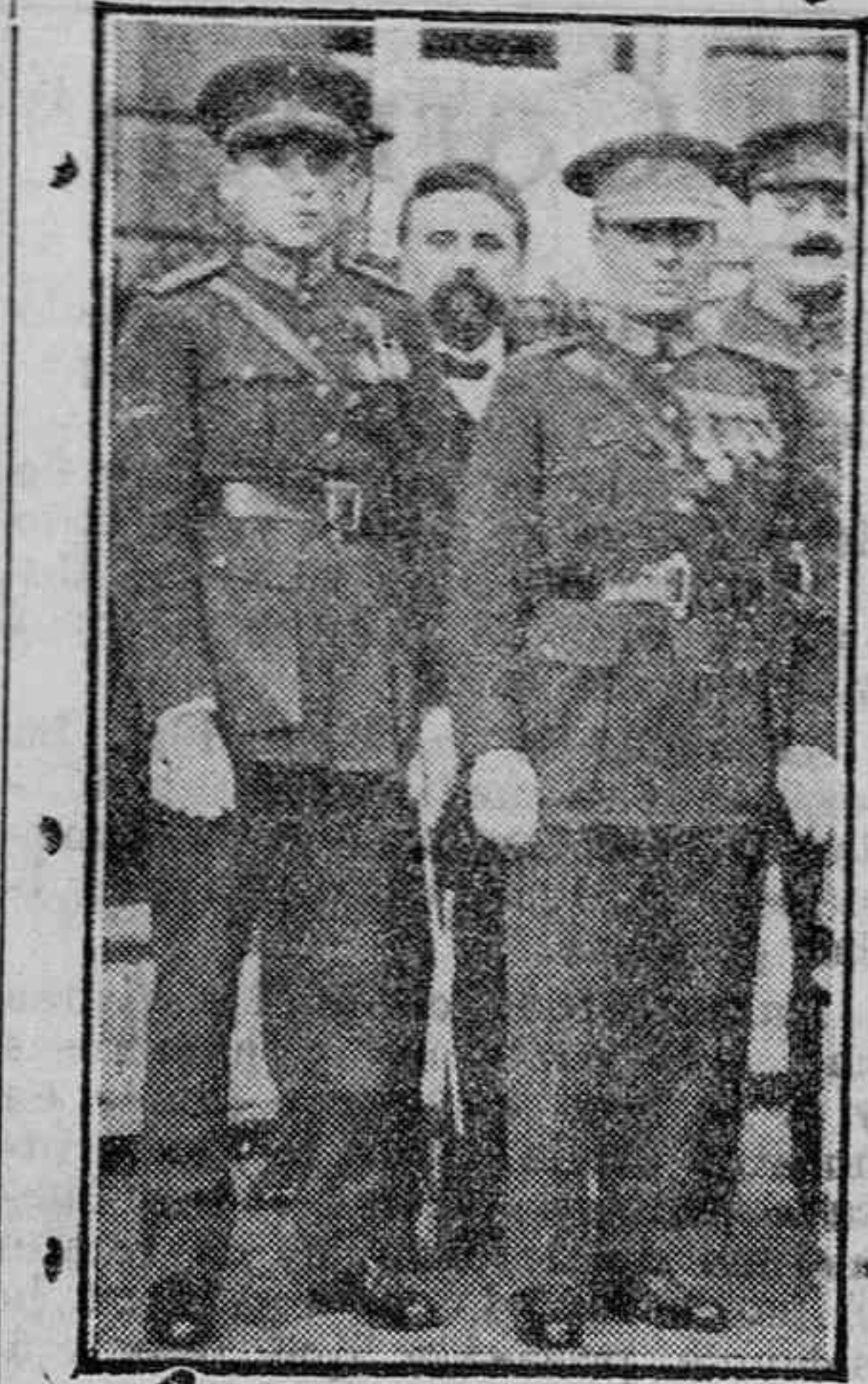
El aviador belga Medacts ha desmentido la noticia de que piensa ceder su aparato a Costes para que haga el raid París - Nueva York, pues piensa utilizarlo en su próxima excursión Bélgica - Congo, en compañía de Verhaegen, que aparece a su izquierda.

En las diversas cofradías de los pueblos pesqueros de nuestro litoral, hay numerosos ancianos, agotados en la lucha ruda con el mar y que viven y atienden a su subsistencia con el auxilio de los pescadores jóvenes, los que pueden salir a enfrentarse con las furias del mar.