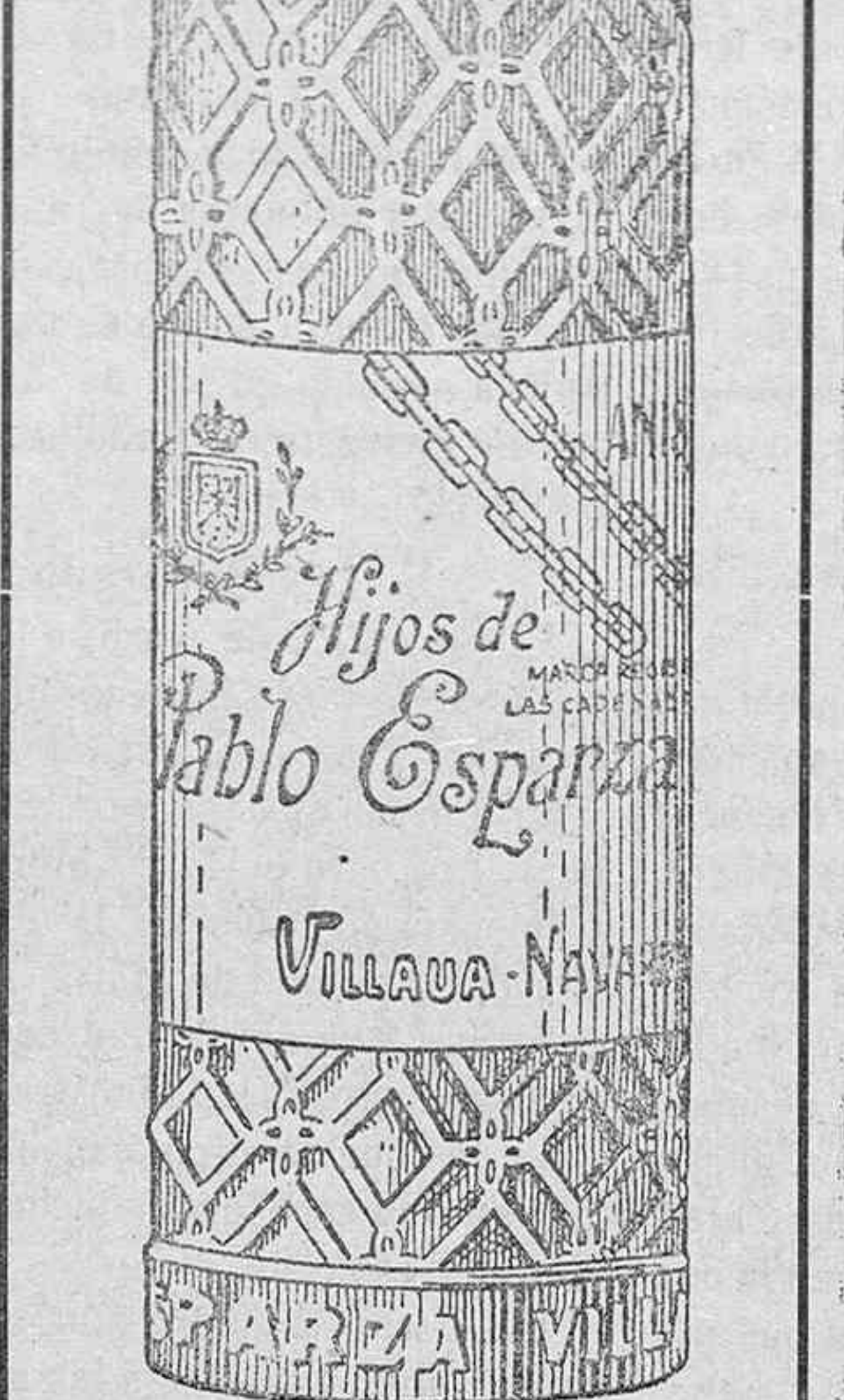
ANISADOS EXQUISITOS «Las Cadenas de Navarra» HIJOS DE PABLO ESPARZA Cosecheros y Exportadores de vinos VILLAVA (Navarra)

¿Qué más propaganda que los nombres de la más florida juventud vitoriana, honra y orgullo, recreo y admiración de propios y extraños?