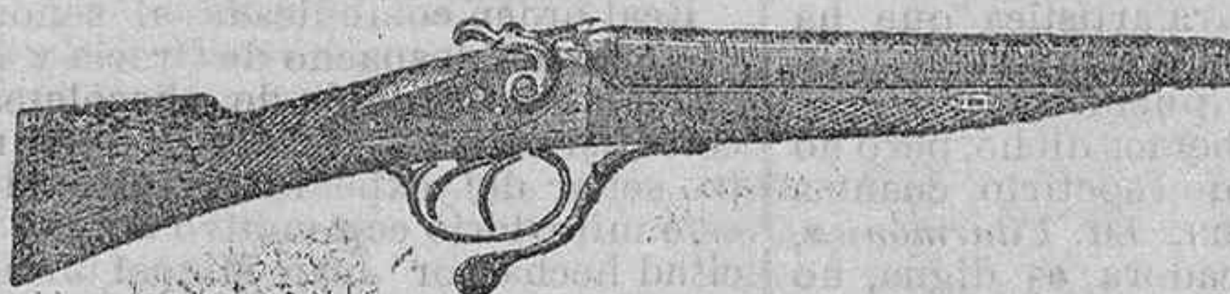
Modelo de escopeta de fuego central dos cañones á pesetas 45 y 50

Gran surtido en armas de todas clases Accesorios para cezar