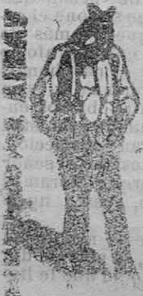
EL RABIOSO DOLOR