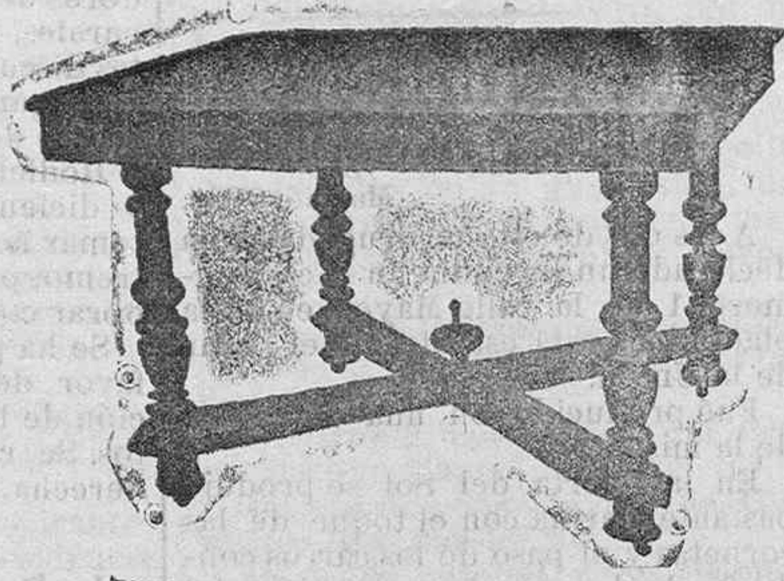
Mesa de comedor nogal Pts. 55

INMENSO SURTIDO EN TODA CLASE DE MUEBLES