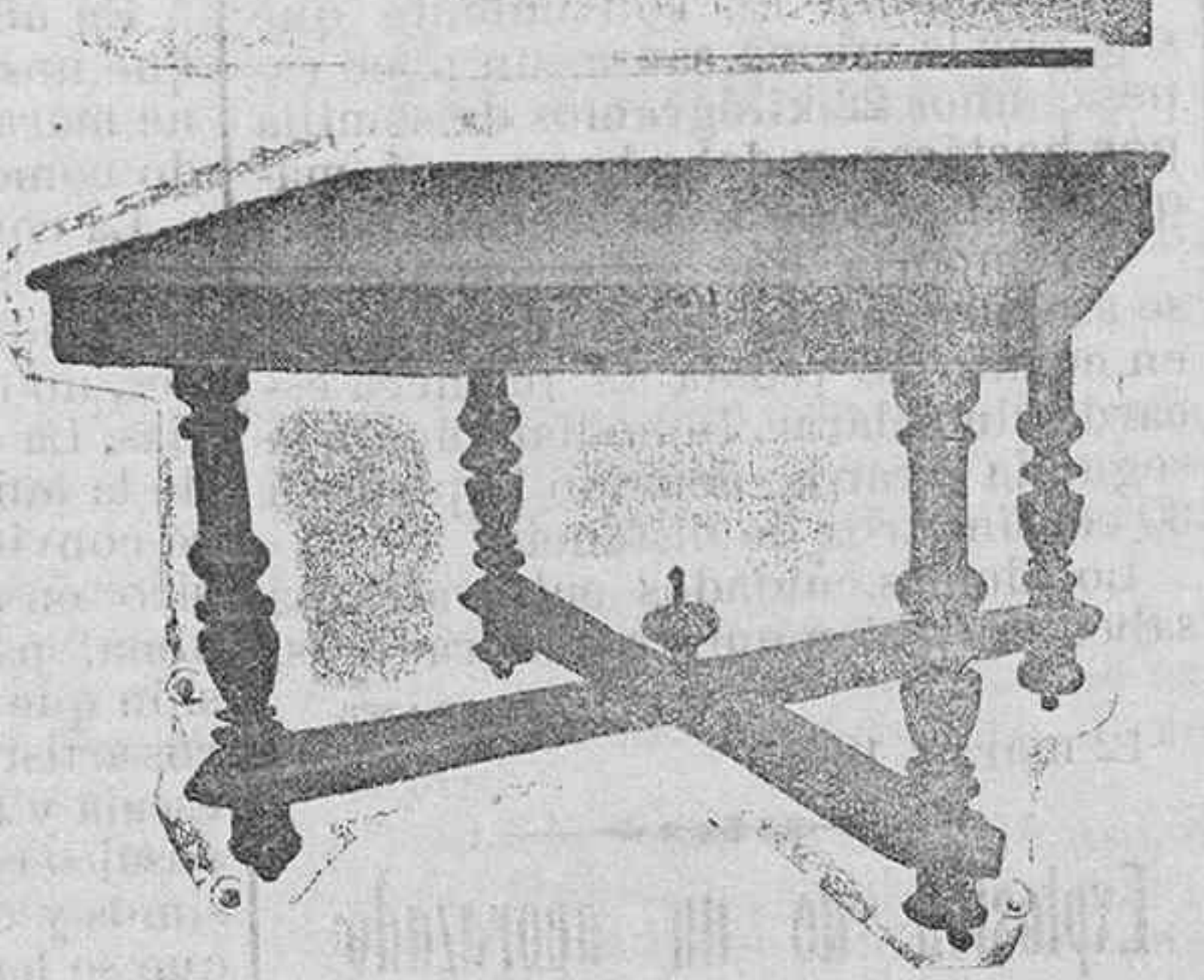
Mesa de comedor nogal