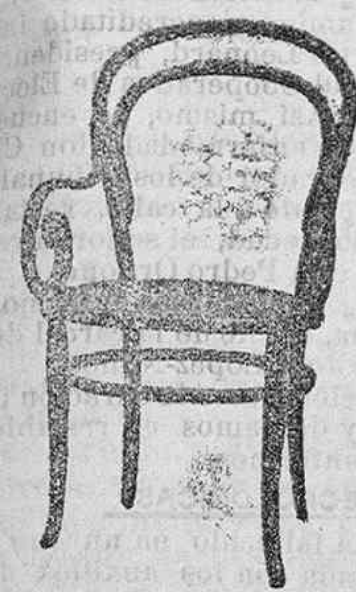
SILLON VIENA curvado asiento regilla Pts. 12'50