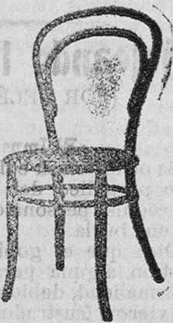
SILLA VIENA curvada asiento regilla Pts. 5 50

INMENSO SURTIDO EN TODA CLASE DE MUEBLES