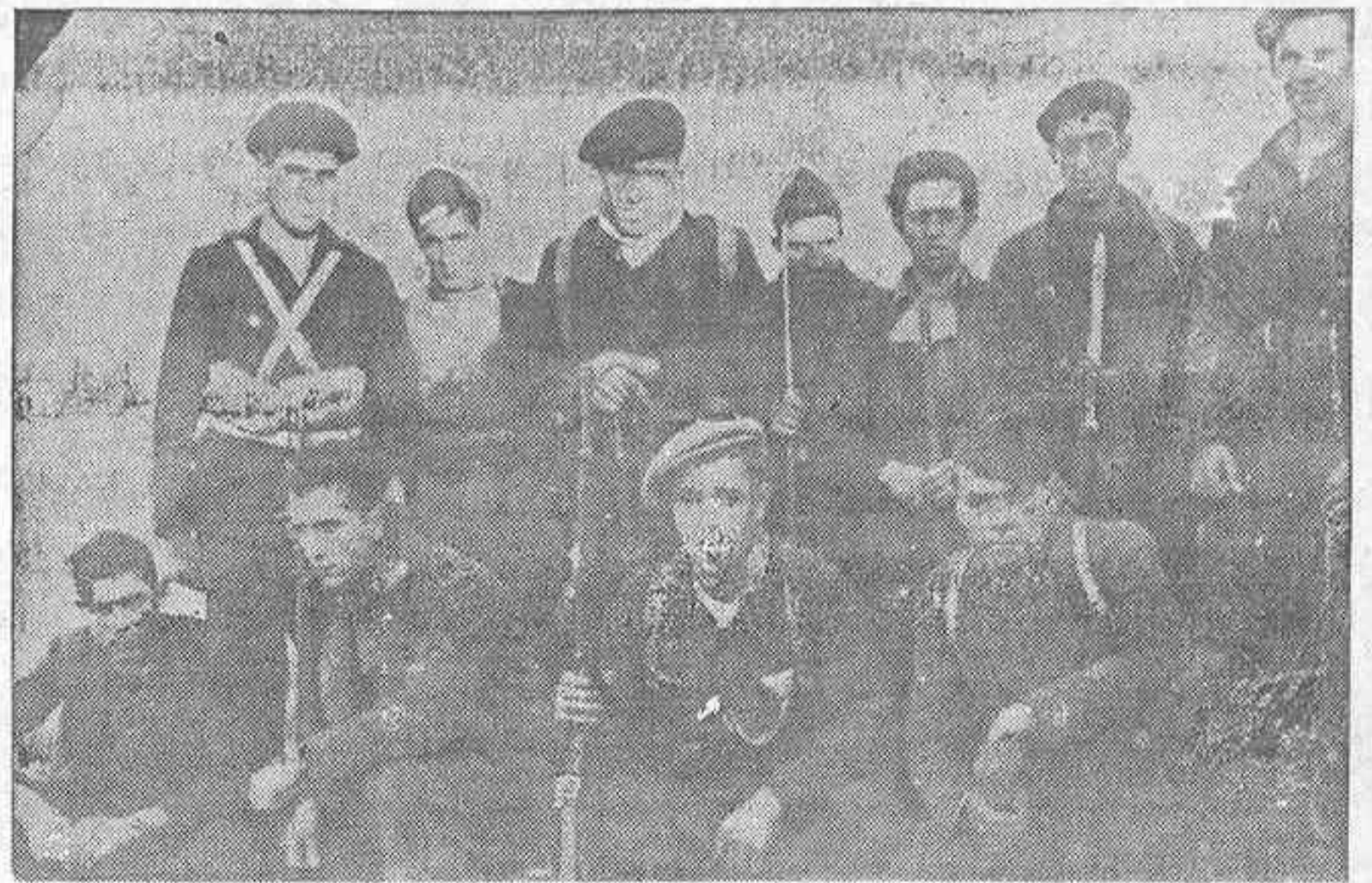
BATALLON CELESTO DE LA C. N. T. Un grupo de compañeros que posan ante nuestro fotógrafo

dad de guerra perfecta; bien pelea y añoran aquellos días, esta vez en las crestas rocosas de la sierra que respalda. Todos sueñan con la que no dudamos repetirán un Oviedo.