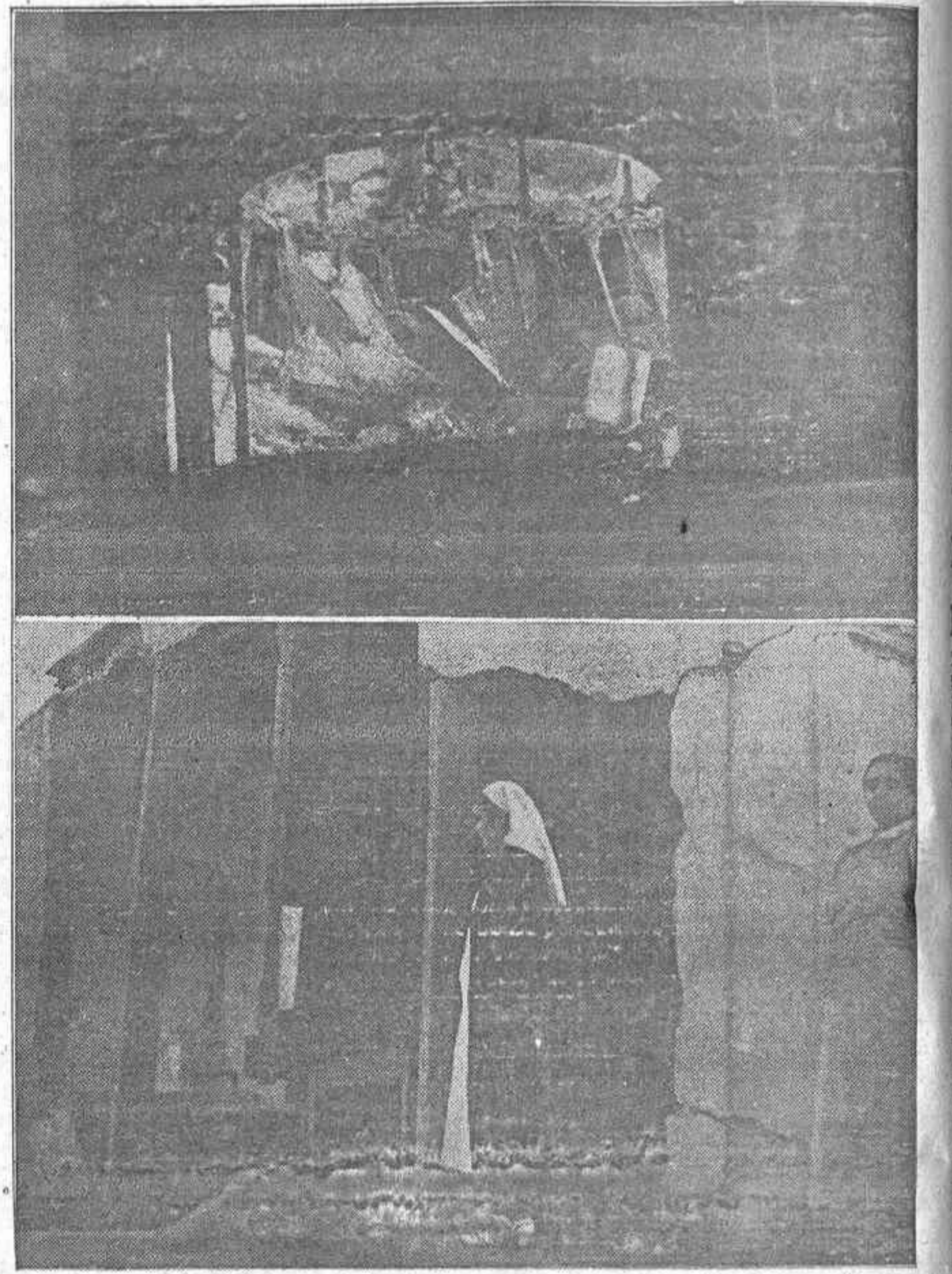
Arriba: Las ruinas del Palacio de Liria, que el pueblo madrileño había convertido en museo, cuidando con respetuosa solicitud de las obras de arte que atesoraba, y que la aviación extranjera al servicio de los facciosos ha considerado como objetivo de bombardeo, destruyéndolo. Abajo: Pañuelo de un hospital de sangre de Madrid, alcanzado por uno de los obuses que la artillería del enemigo disparó contra este edificio que sólo albergaba heridos, enfermeras y médicos.

Gijón, 4 de enero de 1937.—El consejero de Comunicaciones