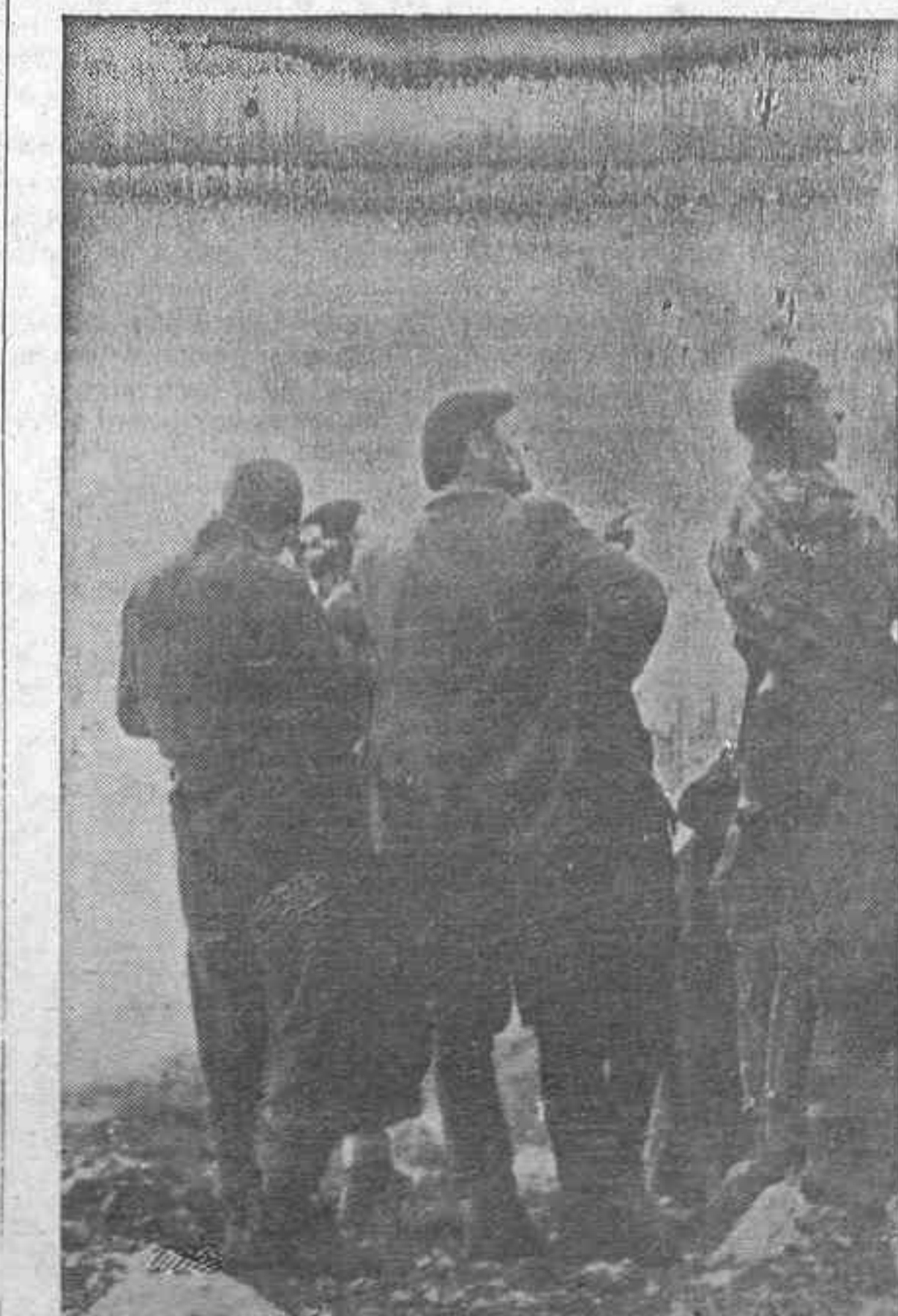
BATALLON CELESTO DE LA C. N. T. El comandante, con varios oficiales, observa las posiciones del enemigo