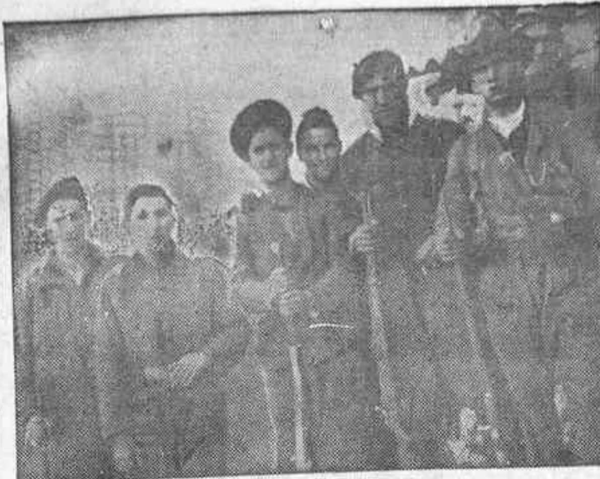
BATALLON CELESTO DE LA C. N. T. En su lugar, descanso...