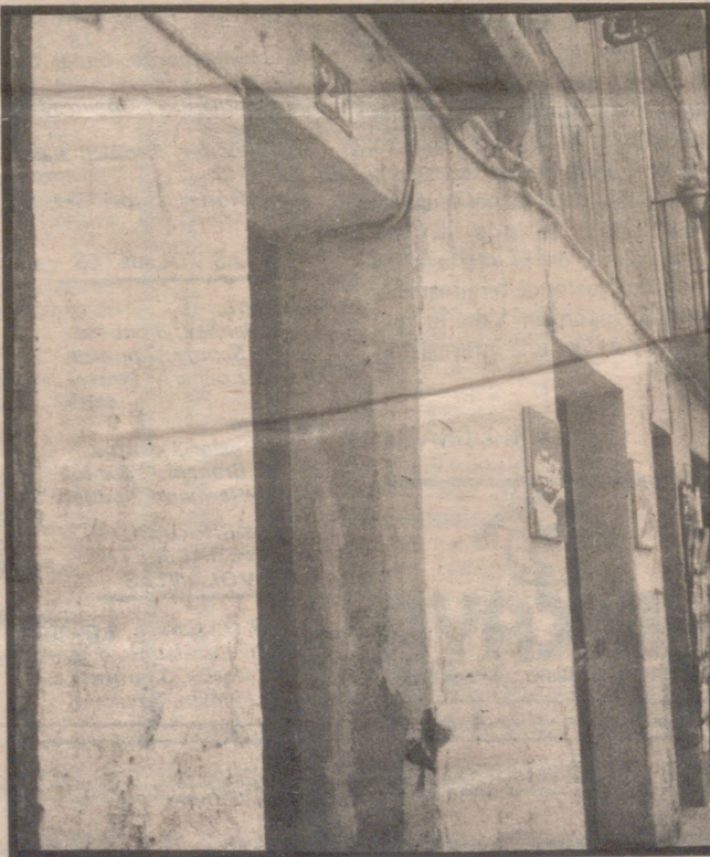
En el portal núm. 28 de la calle Mayoral, se pueden apreciar las manchas de sangre que manaba de la herida del agredido.