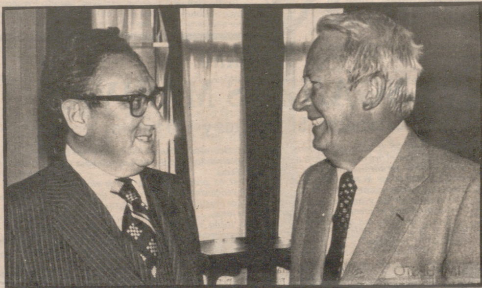
KISSINGER, EN LONDRES

se avanza hacia los Estados Unidos de Europa. Vivimos un incipiente resurgir de los nacionalismos que amenaza con apagar la mortecina llama integradora a la que ayer se rindió modesto culto en Aquisgrán.