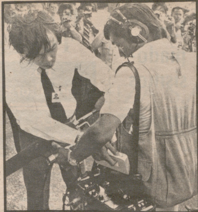
KUTA BEKCH, BALI (Indonesia). — Un oficial de seguridad inspecciona el equipo de grabación de un periodista a la puerta de la sede de la Conferencia de la Organización de los Países Productores de Petróleo. Los periodistas han de pasar por dos controles electrónicos antes de serles permitido el paso.

En fuentes de la conferencia se señala que los ministros invirtieron gran parte de la reunión de ayer en tratar sobre