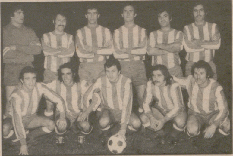
vísperas sencillamente sensacionales para la historia de nuestro Club. RAMIZ

Delimitados con bastante antelación los dos primeros lugares de la clasificación que han copado el Aragón y At. de Monzón la emoción por ver quien de los dos anteriormente indicados se alza con el primer puesto, con ascenso automático a III División, es las que hacen época.