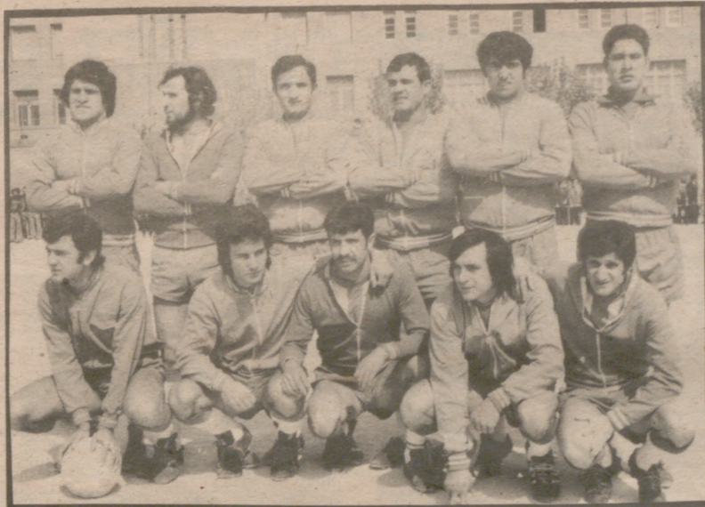
U. D. CASETAS

Encuentro muy nivelado jugado con gran corrección en Zuera, donde el Escatrón, que planteó batalla en