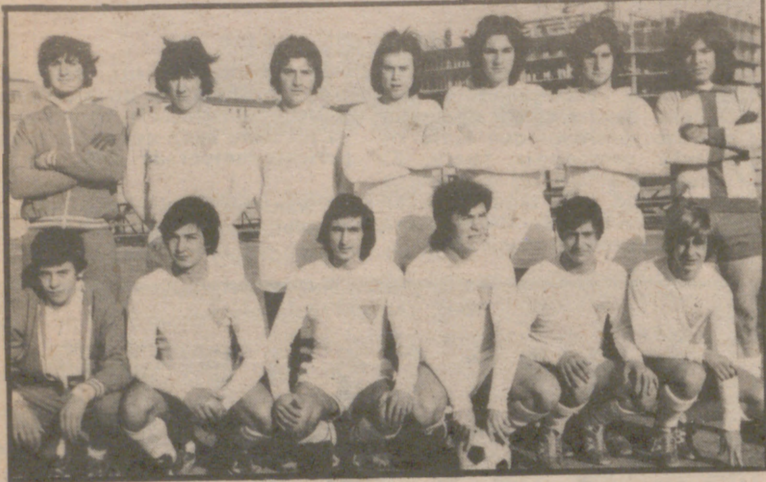
El juventud tendrá el Domingo una difícil prueba en el campo de Escolapios, al enfrentarse a otro de los favoritos, el Calasanz en la Copa.

BOSCOS-STADIUM. — Signo de color local, que debe obtener ventaja suficiente para salvar la eliminatoria, máxime tras las bajas sufridas por los del Stadium.