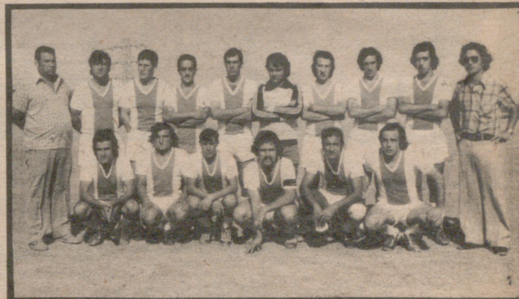
El Ajax de Juslibol recibió el domingo su segunda derrota, en toda la segunda vuelta, pero sin duda esto no empañó ni un ápice el excelente momento de juego de los muchachos del Juslibol

Ranillas-Esp. de Montañana. Pueden puntuar los foráneos en este desplazamiento, esto