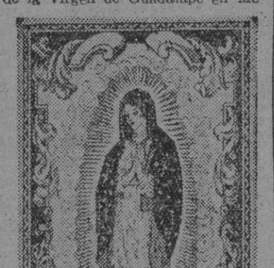
Nuestra Señora de Guadalupe, imagen que se venera en Hispanoamérica. Hoy. Hasta en sus orígenes guardan señaladas relaciones las tradiciones de ambas vírgenes."