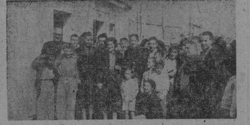
La delegada nacional de la Sección Femenina recorre las nuevas viviendas acompañada por los beneficiarios y de las autoridades zaragozanas