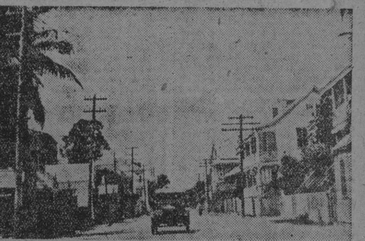
Vista de la capital de Belice.

La ciudad, edificada a orillas del mar, es de calles amplias y de casas blancas y alegres. Ha sido llamada la ciudad mejor pintada del Imperio británico. El clima es tropical.