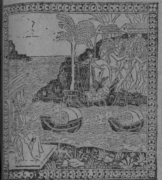
Descubrimiento de América, según el primer grabado que se hizo del sensacional suceso.

PARECE como si al poner la Providencia en sus lugares actu les a los continentes del Mundo, hubiese sentido la duda de que la Humanidad malgastara el conocimiento de su riqueza territorial adquiriéndolo en el mismo modo que la fortuna no se puede conseguir al finjo, que la destrozó, ni al adolescente que la predica. Quizá por eso aparece en la esfera o en