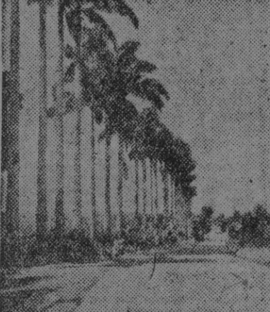
Carretera de Caracas a Guatire, en Venezuela

La acción de la herencia y del medio crea un estilo para cada pueblo, y la Historia es el fruto de la singular acción de los constantes históricos interrelacionados por la acción de la variada métrica de la casualidad y sucedida por los trones fecundados de los héroes. Cabe explicar por eso los hechos históricos, y tal vez descubrir el porqué de la conquista y colonización de América.