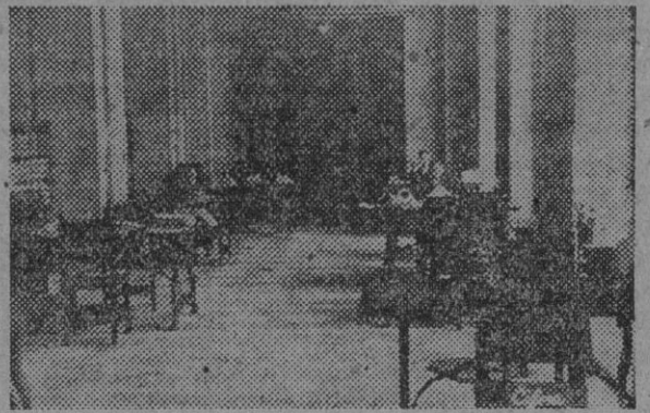
Sala de los Investigadores del Archivo de Indias

MÁS DE 3.500.000 documentos conserva en la actualidad el Archivo de Indias, en los que se encuentra toda la labor realizada por España en América, y es por ello este Archivo la prueba más decisiva a la que puede acudir para demostrar la excelencia de la labor de nuestra Patria en el Nuevo Mundo, en