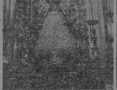
La venerable imagen de la Virgen del Pilar en su templo de Zaragoza

reclamados en oro y su tesoro más valioso de nuestros tiempos. El Pí-