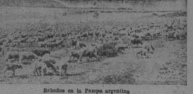
Rebaños en la Pampa argentina