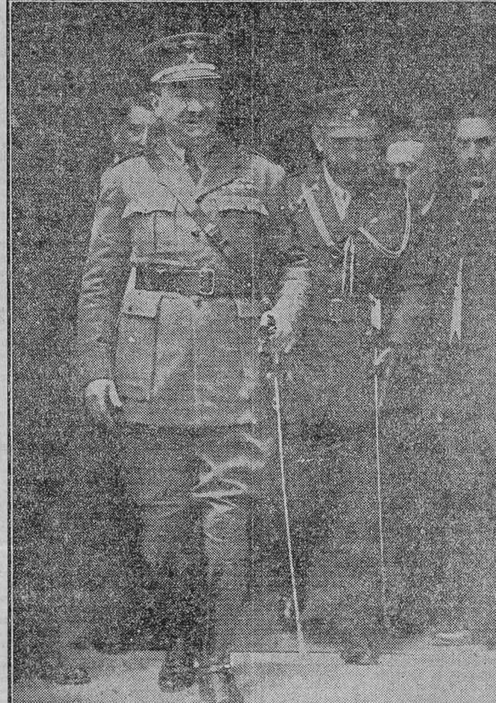
LOS GENERALES BERENGUER Y NAVARRO, AL SALIR AYER TARDE DESPUÉS DE LA PRIMERA SESIÓN DEL CONSEJO DE GUERRA