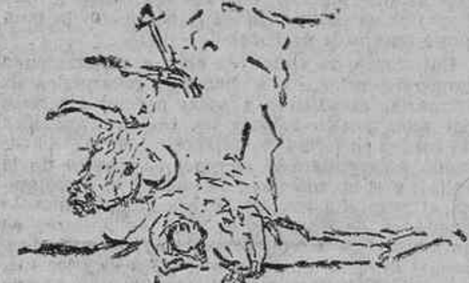
La cogida de Nacional II en su primer toro

—En San Fernando. Se lidiaron novillos de Félix Gómez. Chicorro, muy valiente. Gitanillo de Triana, bien con el capote y la muleta, y mal matando. El último pasó al corral.