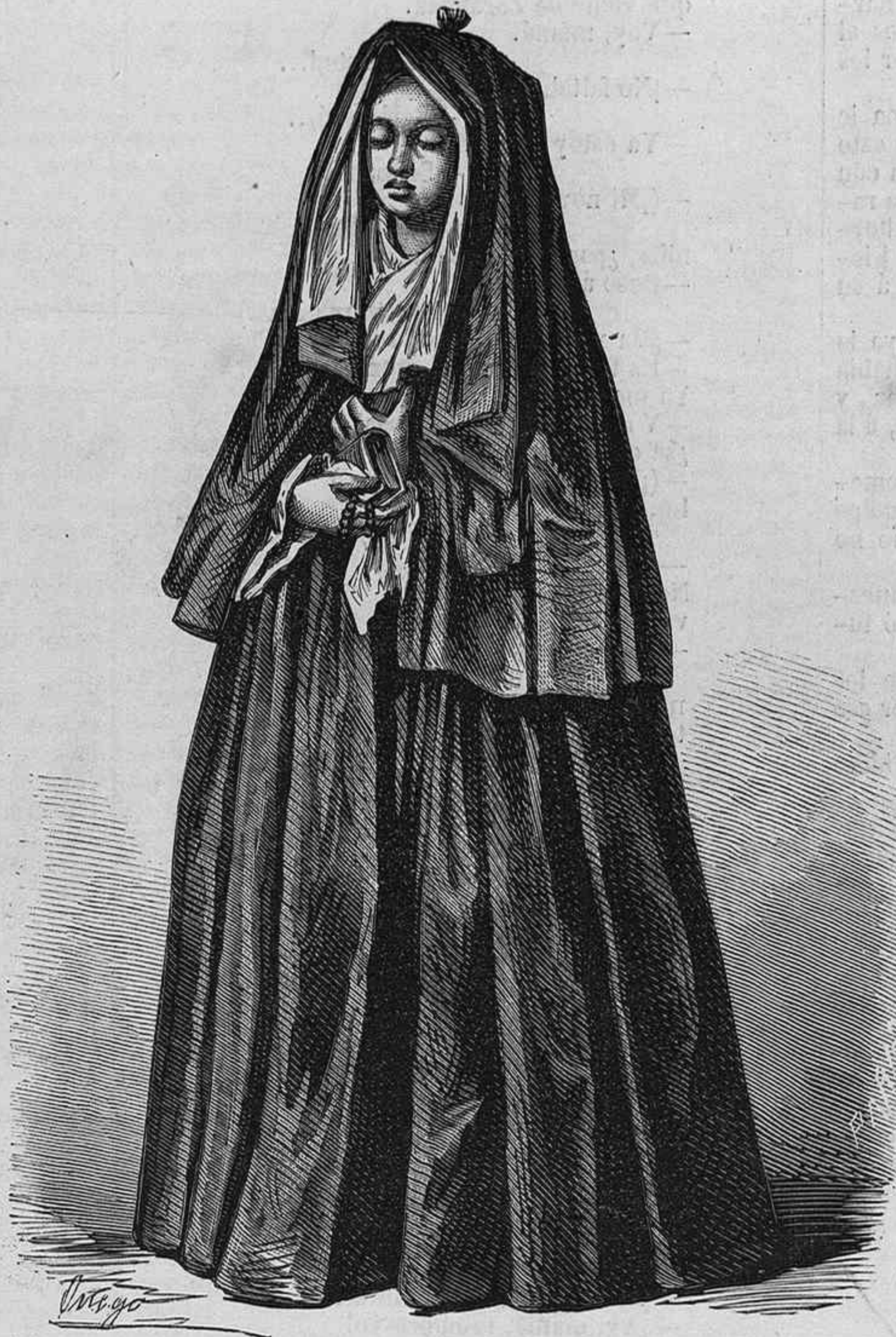
FILIPINAS.—EDUCANDA DE BEATERIO.

Y este arte de embellecerse, para agradar mas, que poseen todas las jóvenes, se revela no sólo en sus trages y en sus adornos, sino en sus gestos, en sus palabras, en sus actitudes, en las modulaciones de su voz, en su continente, en su manera de andar, en su manera de estar sentadas, en sus alegrías y en sus tristezas, en sus risas y en sus llantos, en sus mimos y en sus desdenes, en todos los actos, hasta los mas insigni-