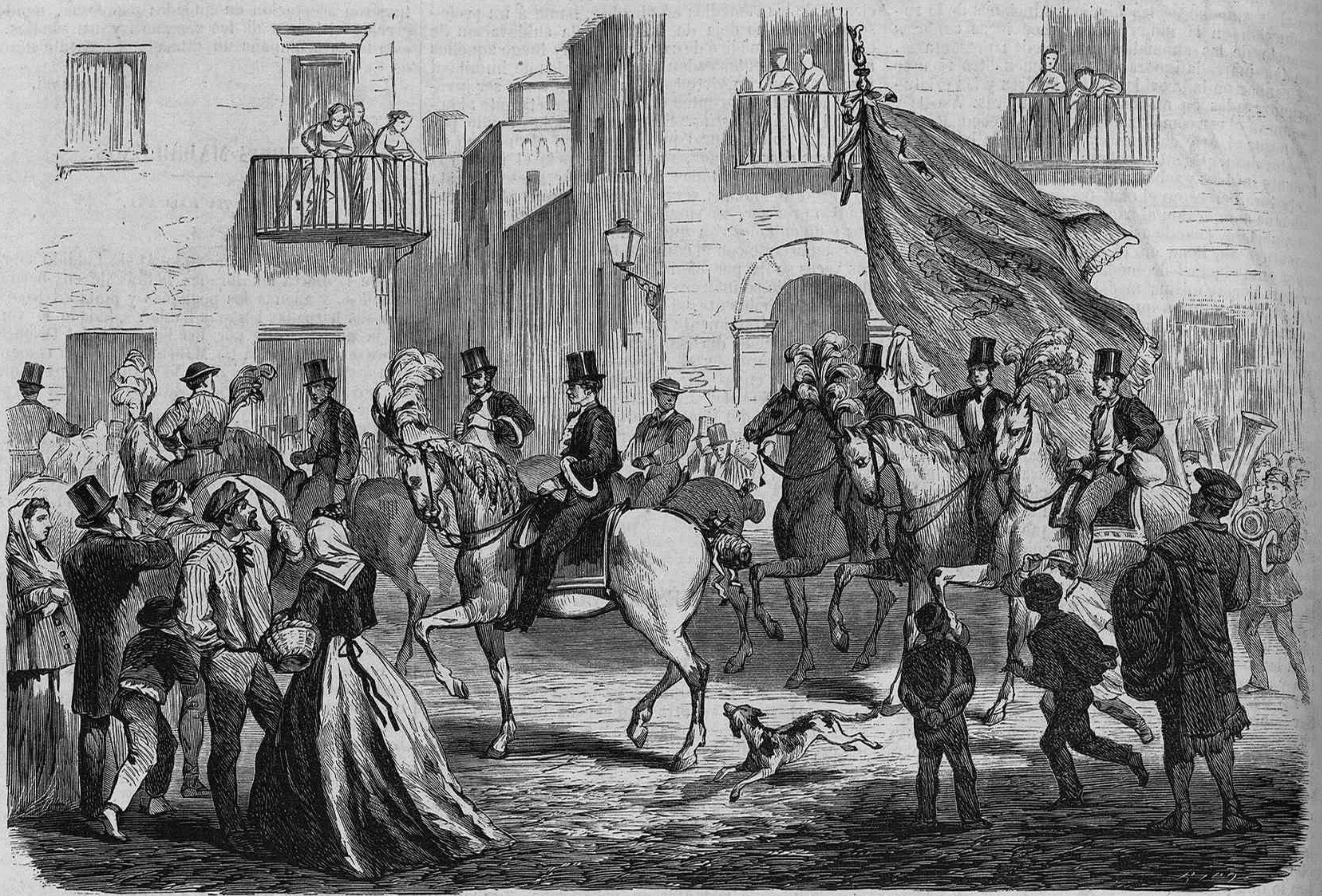
COSTUMBRES POPULARES.—LOS TRES TOMS, EN BARCELONA.

usted en pasado ó en presente? ¡Cómo se conoce que no es usted académico de la lengua!