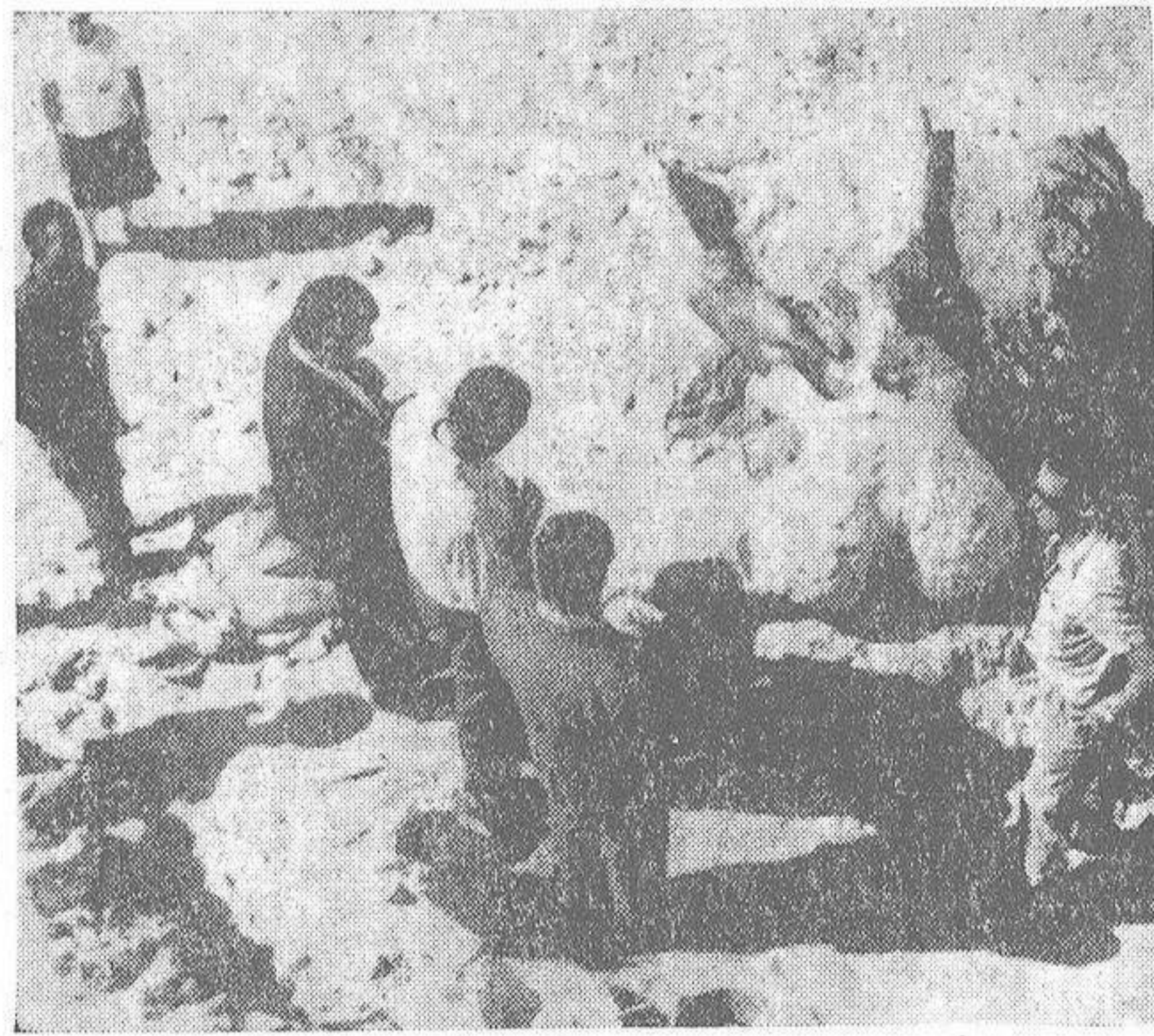
El mundo de los arqueólogos es de los más curiosos, y aunque parezca mentira, apasionante. El trabajo intenso de estos hombres está compuesto por sencillas figurillas, que nos describen la vida de nuestros antepasados.