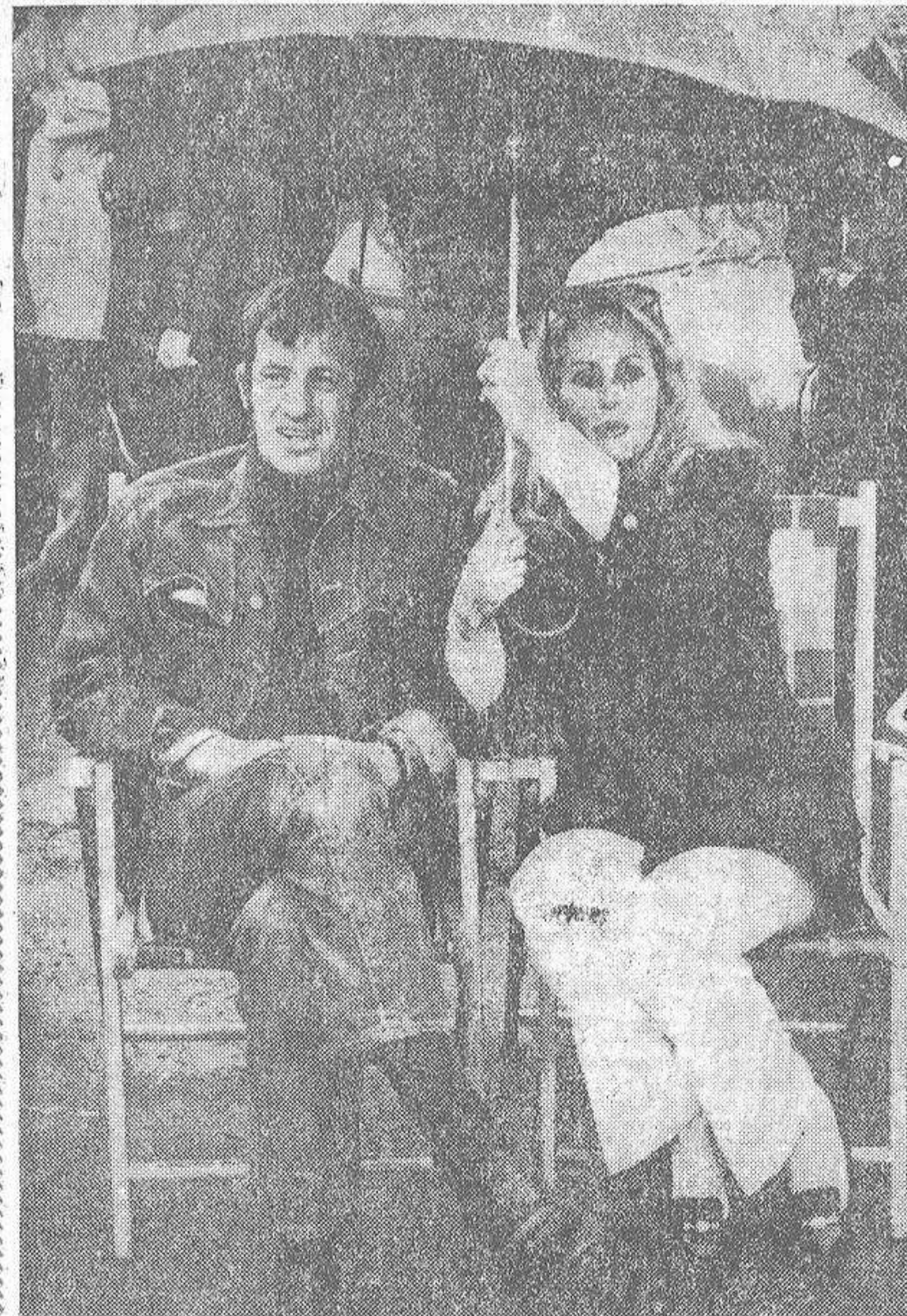
BELMONDO Y URSULA, DE NUEVO JUNTOS EN UNA PELICULA

Dos enamorados, Jean Paul Belmondo y Ursula Andress, se encuentran de nuevo reunidos en la película que, con el título de "Cerveau", se rueda en El Havre, bajo la dirección de Gérard Oury. La pasión ha vuelto a encenderse mientras transcurre el rodaje. Se trata de una cinta de aventuras, en la que juegan papel principal unos supuestos secretos de la O. T. A. N. que son trasladados en tren de París a Bruselas. Una banda de gangsters dirigida por David Niven trata de apoderarse de estos secretos, a lo que se opone la gentil pareja formada por los protagonistas. Durante uno de los años en la realización, fue captada esta foto en la que la bella actriz suiza aparece cubriendo con un paraguas a su enamorado en la vida y en el cine.