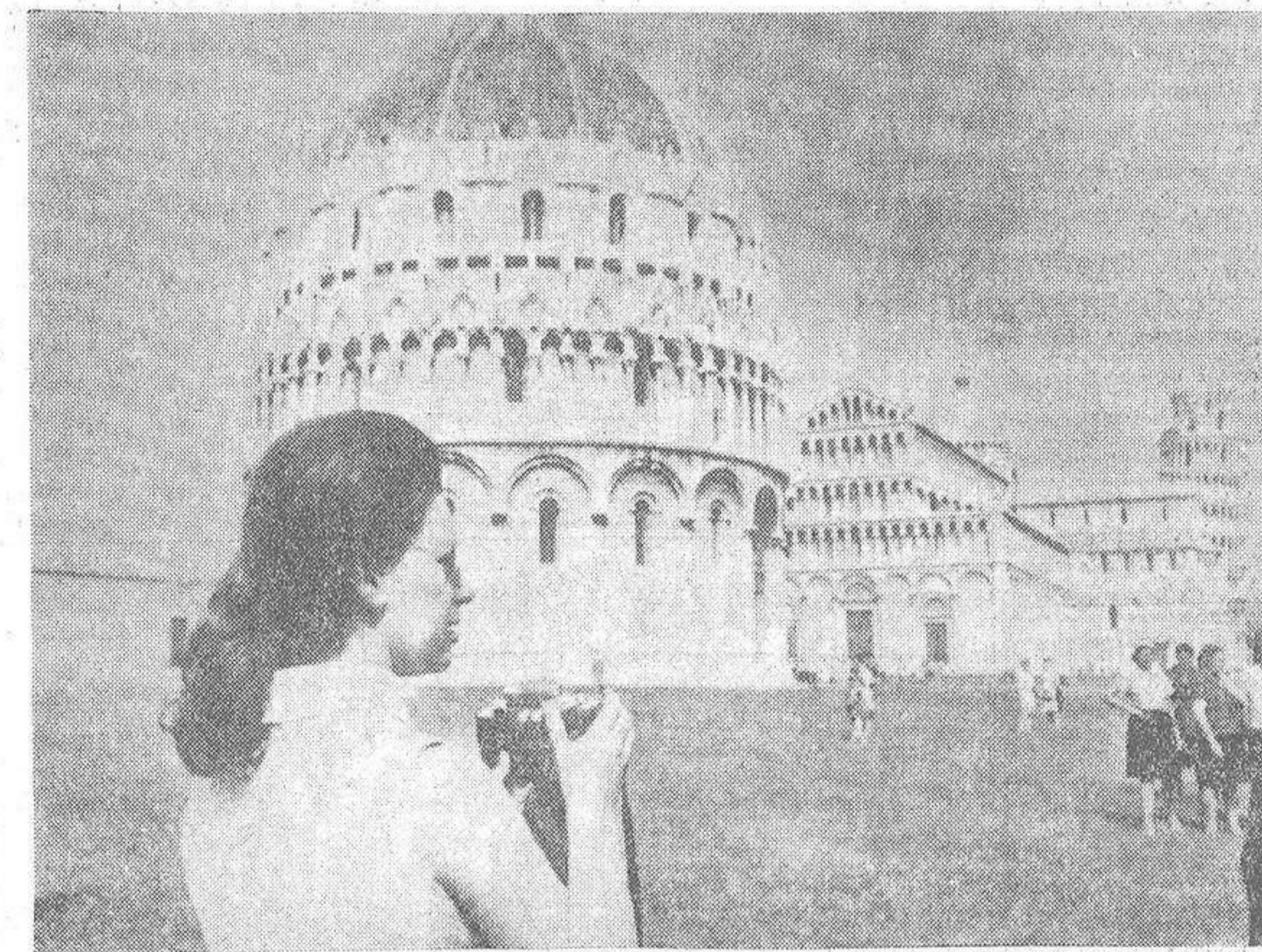
Como dos sencillos burgueses, han recorrido Italia la Princesa Margarita de Inglaterra y su esposo, Lord Snowdon. Liberados de las pesadas cargas del protocolo, que no harían más que perturbar su viaje, la pareja ha visitado cuanto de notable encierra la península. Después de recrearse con las bellezas de Florencia, y de asomarse ensomnadoramente al Arno, según suelen hacer los recién casados, Margarita y "Tony" se trasladaron a Pisa, para visitar a sus grandes valores, lo que hicieron conmovidos con grupos de turistas. Aquí vemos a la Princesa en el momento de fotografiar el conjunto arquitectónico que forman la catedral, la Torre Inclinada y el "Campanile".