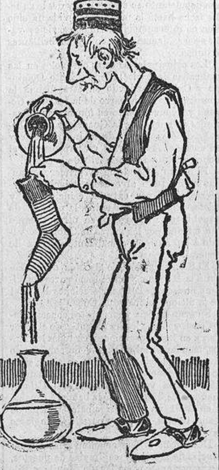
¡Qué sabia es la Providencia! Antes de inventar el agua turbia, ideó los calcetines.