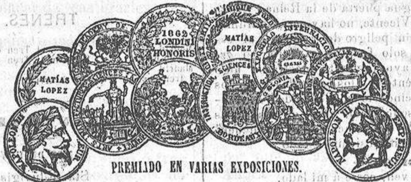
PREMIADO EN VARIAS EXPOSICIONES.

Consignatarios, Sres. Faes hermanos y compañía.