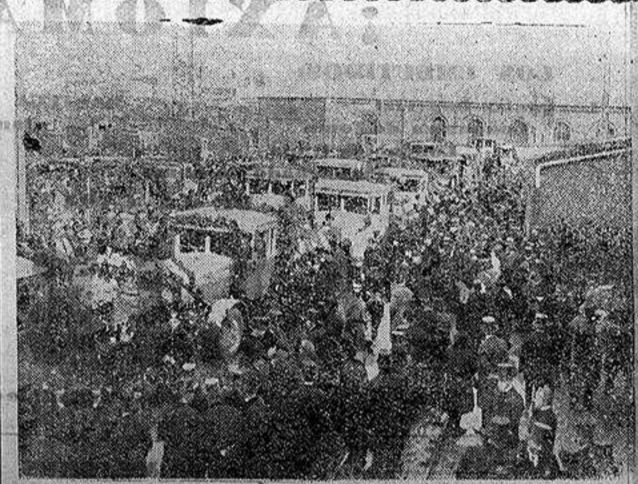
Alemania.—Los funerales de las víctimas de la catástrofe minera de Alsodt.—Los camiones que llevaron los restos al cementerio aparecen aquí reunidos en el patio de la mina, antes de partir para el cementerio.