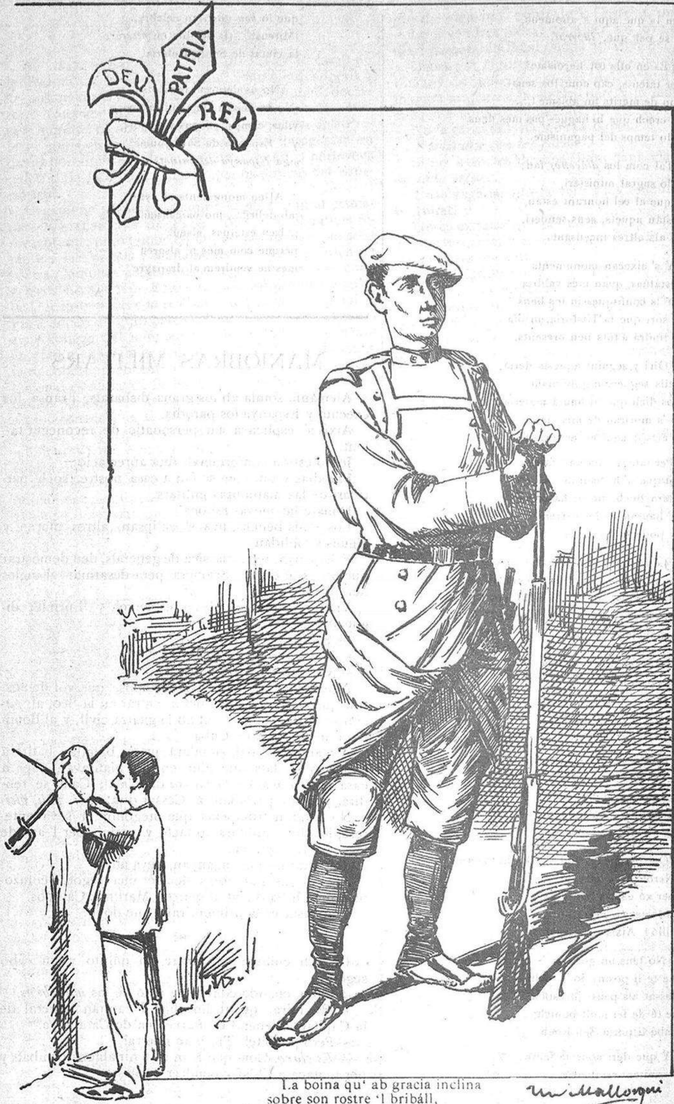
La boina qu' ab gracia inclina sobre son rostre 'l bribàll, y que 's va fé ab un retall de la grega capellina, símbol es d' honor y gloria y bravura conquistada, sentne mil cops ventejada