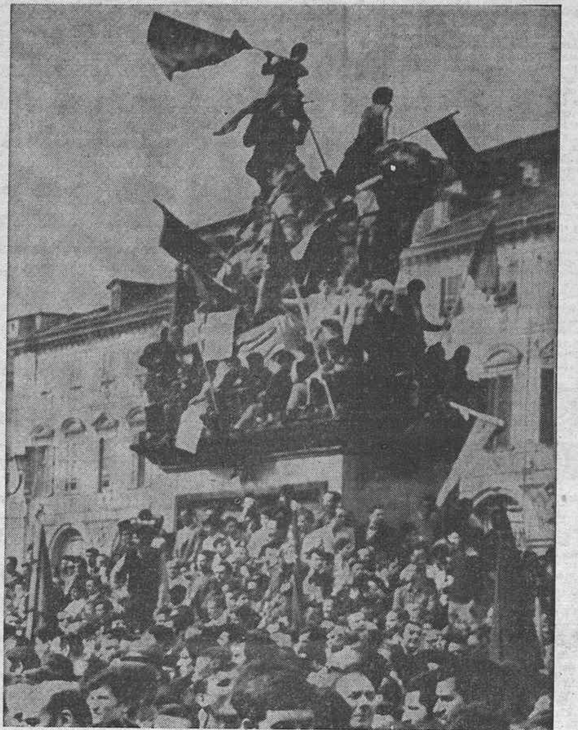
TURIN. — La instantánea nos muestra a unos manifestantes apelotonados alrededor y encima de la estatua de la plaza de San Carlos, en Turín, durante una manifestación. Se calculó que el número de trabajadores manifestados era de 50.000. Los trabajadores del caucho y del metal piden un aumento en su salario; éste fue el motivo de la manifestación