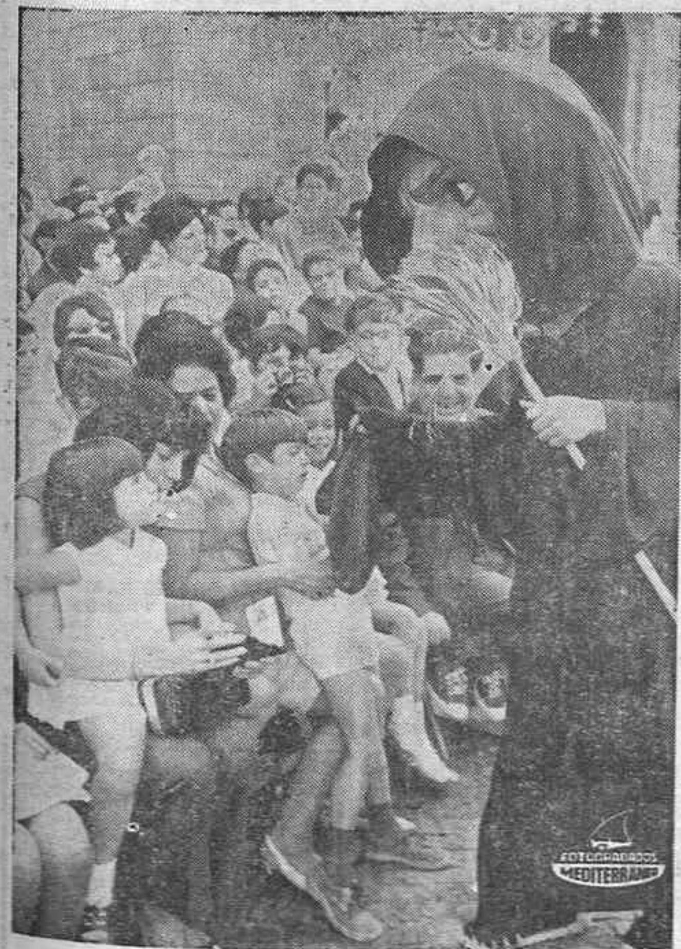
BARCELONA. — Festejos de todo tipo, para todos los gustos y públicos, ha brindado Barcelona este año en sus tradicionales fiestas de la Merced, patrona de la ciudad. Entre ellos, este desfile de gigantes y cabezudos, brujas incluidas, que si bien hizo las delicias del público infantil en su mayoría, en algunos casos se retiró hacia las faldas de su madre entre incrédulo y temeroso el niño de la visión fantasmagórica pudiese ser realidad. Algo más atrás, otro niño toma impunemente fotos de la bruja.

Novedades atractivas en las Fiestas de la Merced