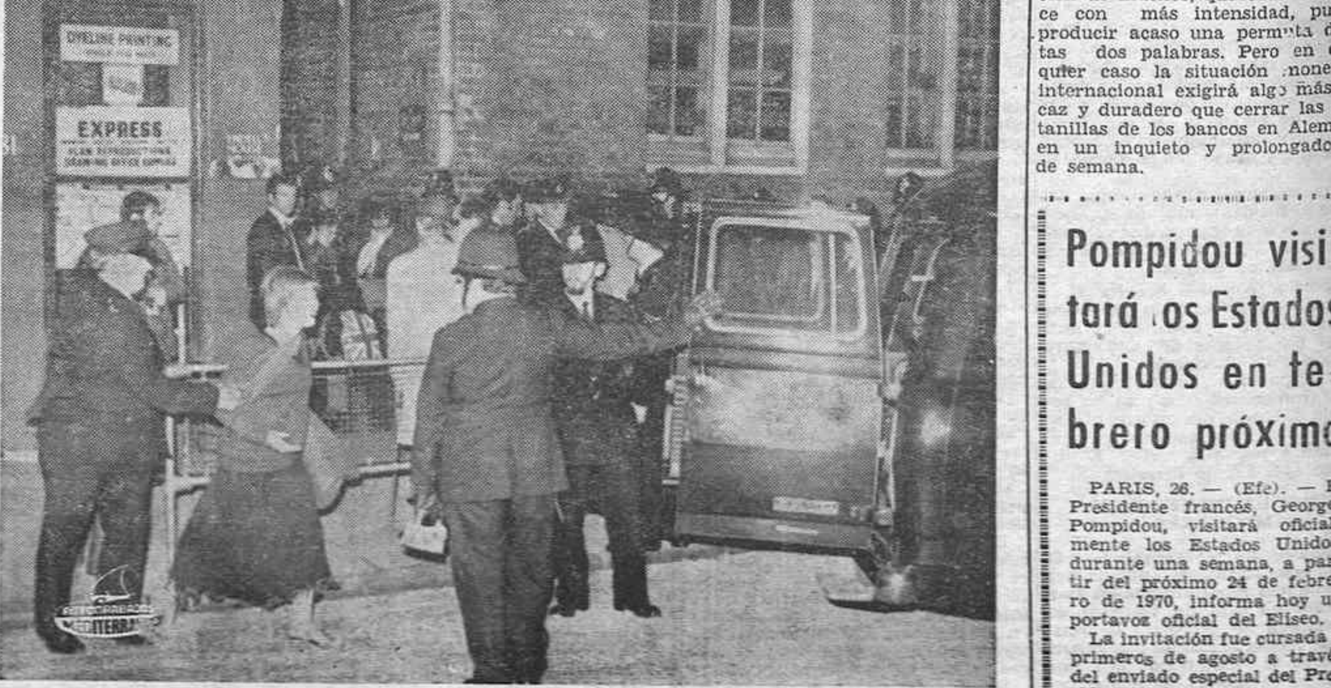
LONDRES. — Amablemente, dos policías abren la puerta del coche celular para que esa muchacha larguifaldera penetre en él poco después de ser detenida cuando fue hallada entre un grupo de "hippies" que fueron expulsados del interior de la escuela de la calle Endell. Unos 150 policías llevaron a cabo la operación penetrando en el edificio por los balcones y ventanas.