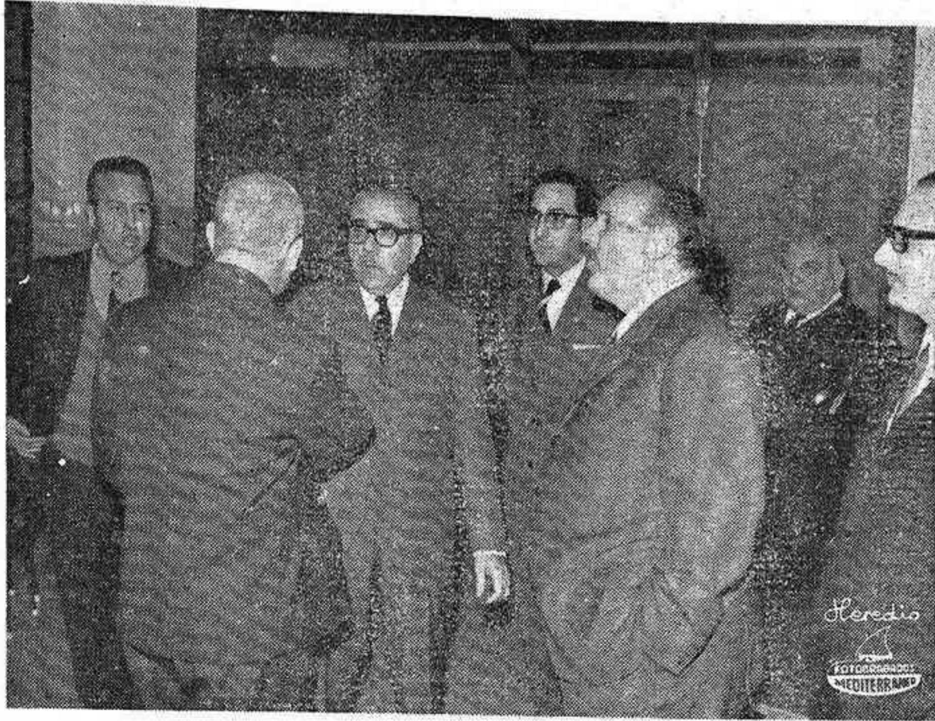
EL JEFE PROVINCIAL Y GOBERNADOR CIVIL CONVERSA CON UN VECINO DEL GRUPO

Nuestra primera autoridad y jefatura, fue recibido a su llegada por el Jefe Local del Movimiento,