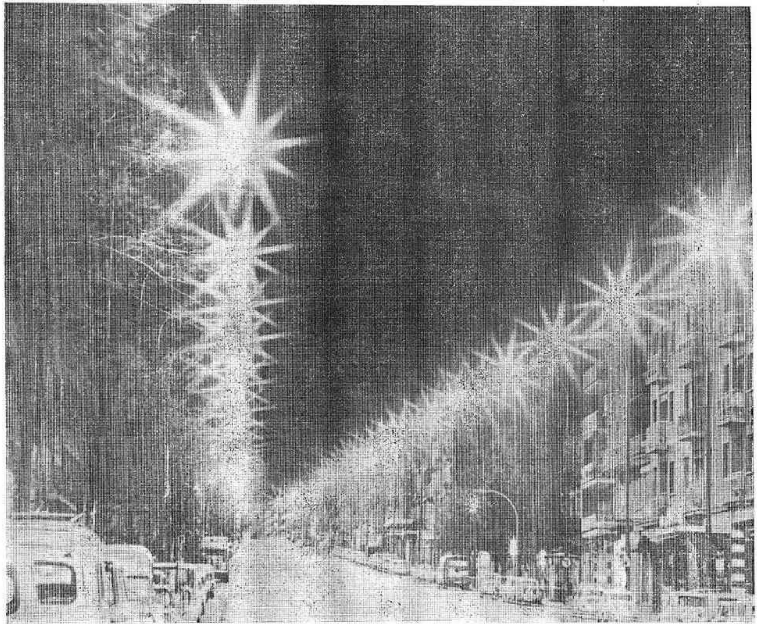
CALLE GENERAL RICARDO (MADRID)