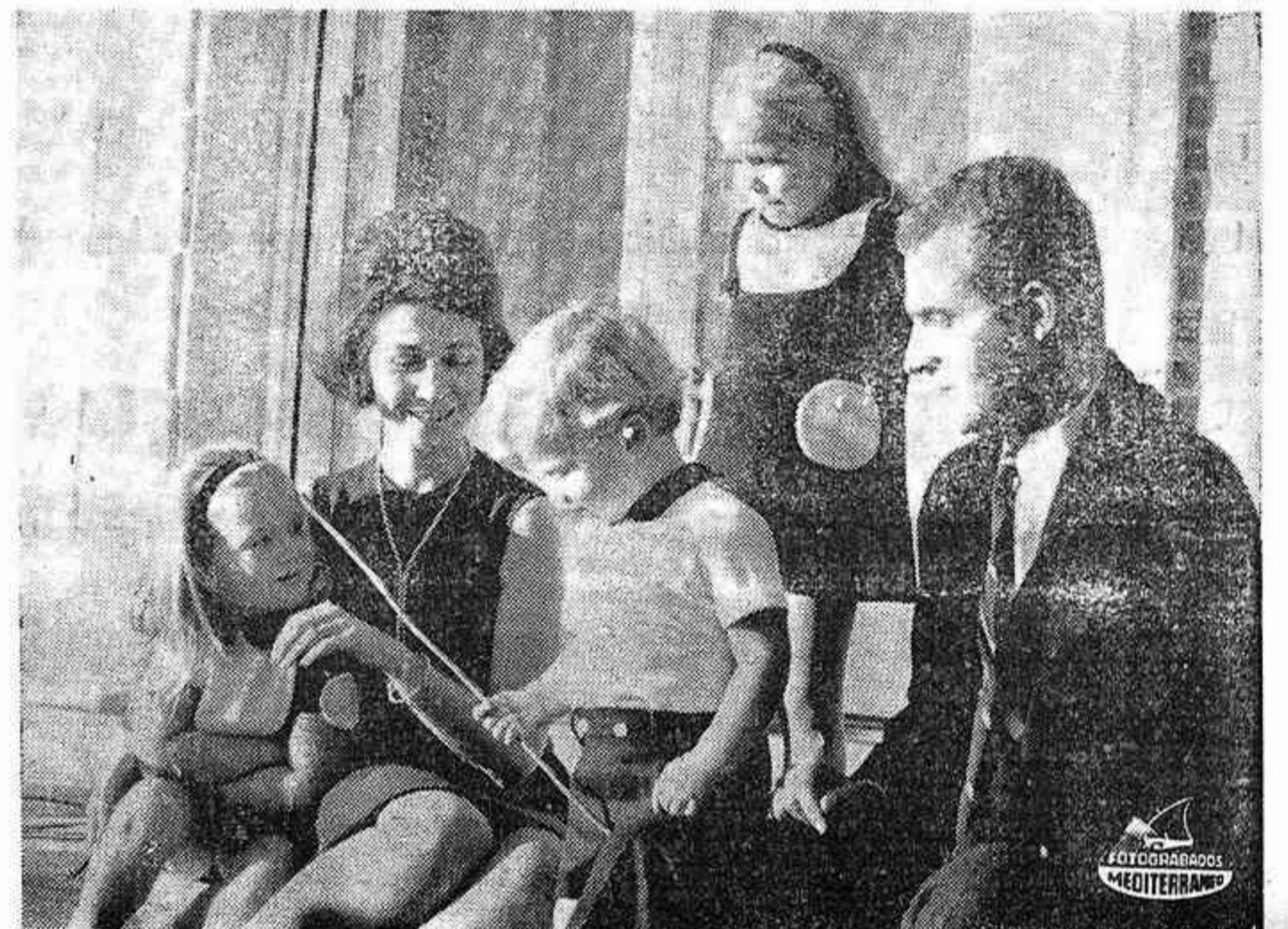
MADRID. — Los Príncipes de España D. Juan Carlos y D.ª Sofía, con sus hijos las Infantas Elena y Cristina y el Infante Felipe, posando en el Palacio de la Zarzuela con motivo de las Fiestas Nacionales.