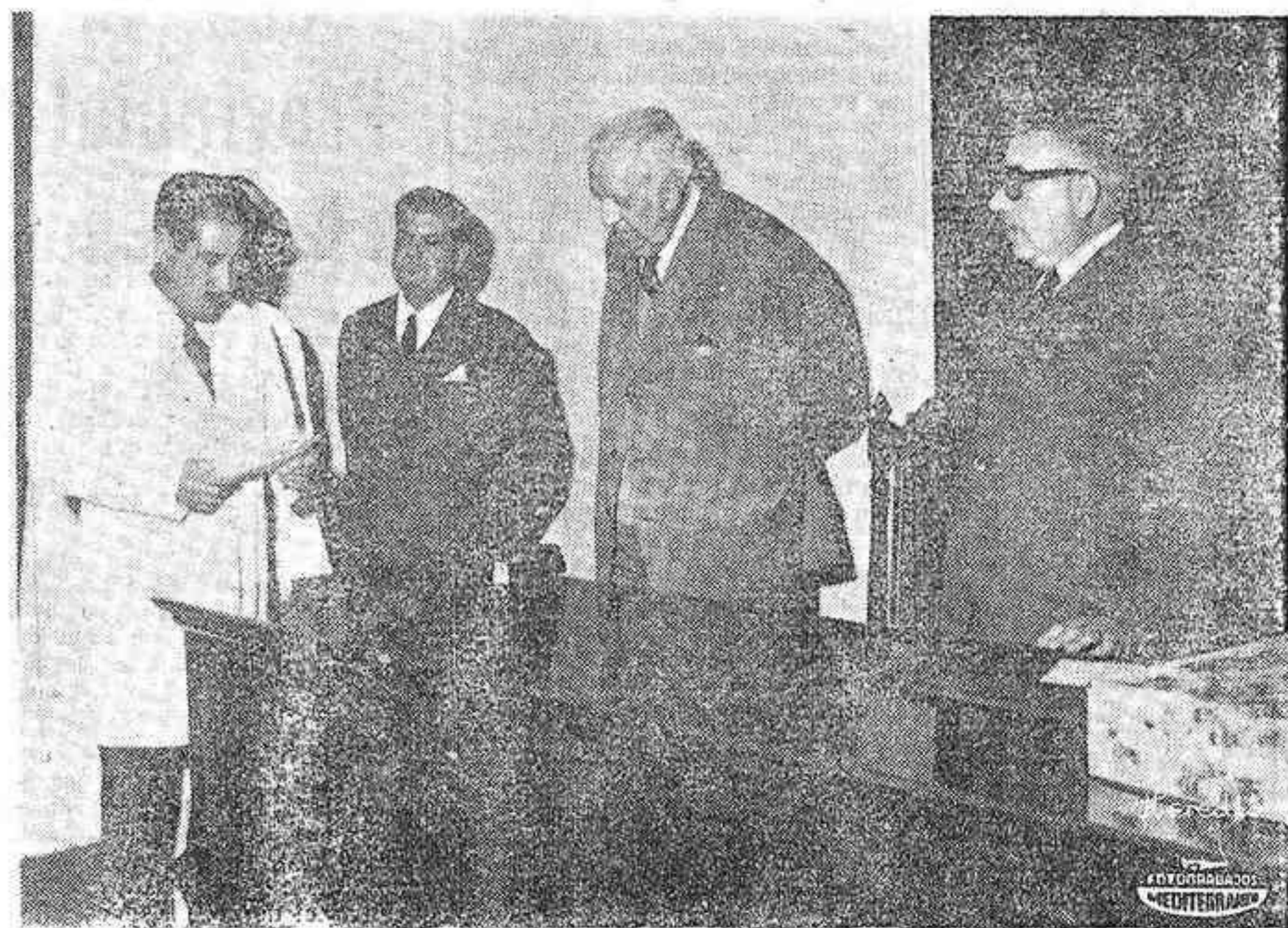
UNO DE LOS ACOGIDOS EN EL SANATORIO AGRADECIÓ EL GESTO DE SOLIDARIDAD DE LAS MUTUALIDADES LABORALES