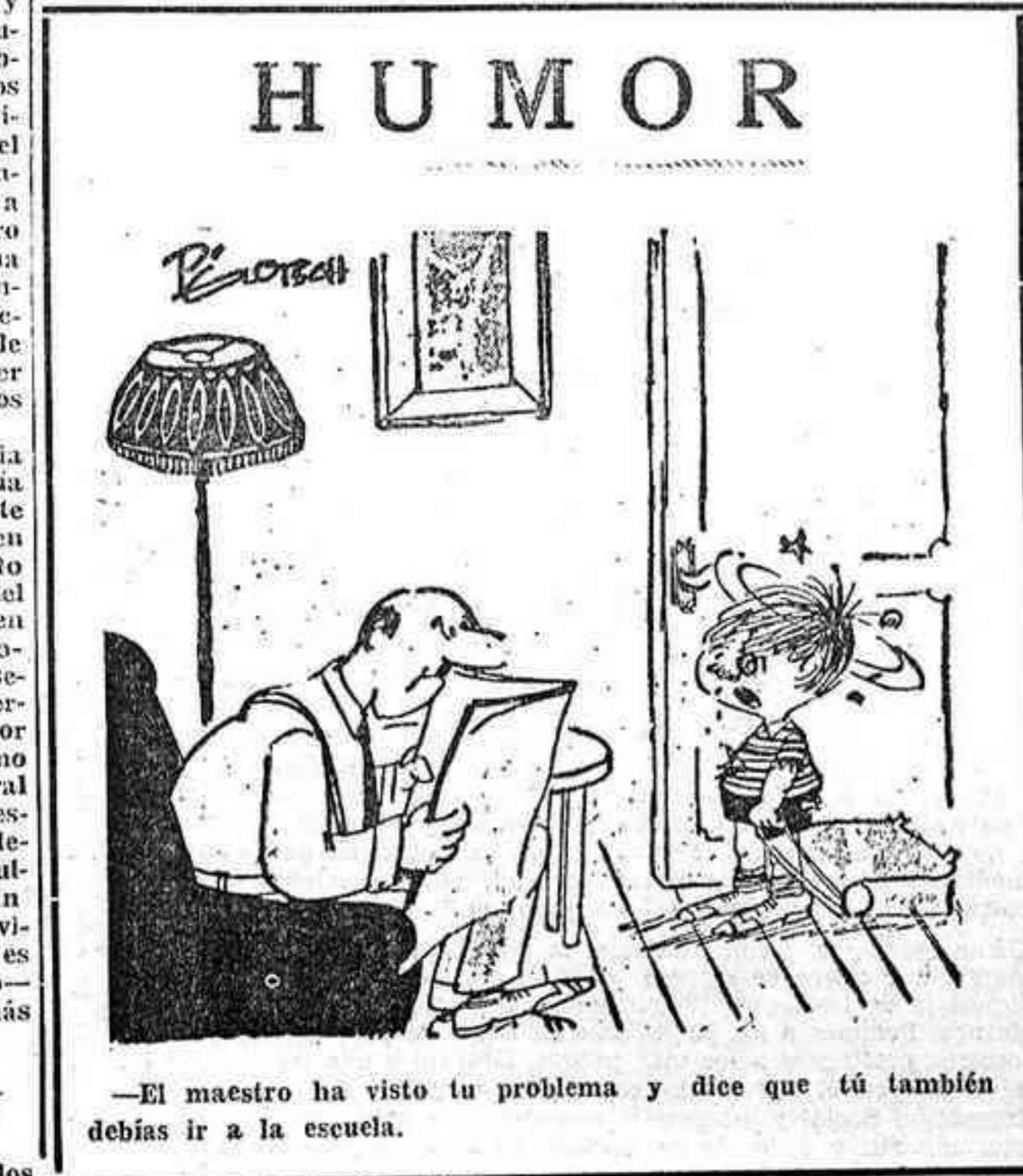
El maestro ha visto tu problema y dice que tú también debes ir a la escuela.

El Ministro italiano de Exteriores, Aldo Moro, ha significado en esta reunión que su presencia equivale a buscar un nudo político, un nudo político que es el que hasta ahora impidió el acuerdo.