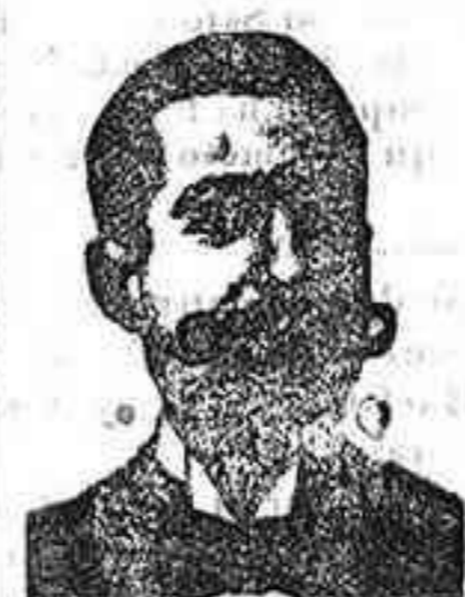
SALVATI COSTANZI Diputación 345, Barcelo

Especialidad en bombones de chocolate con cremas finísimas. Cereales azúcares, helados y dulces varios. Se venden en todas las principales confiterías de España. Depósito central: MONTECARRA, 25—MADRID.