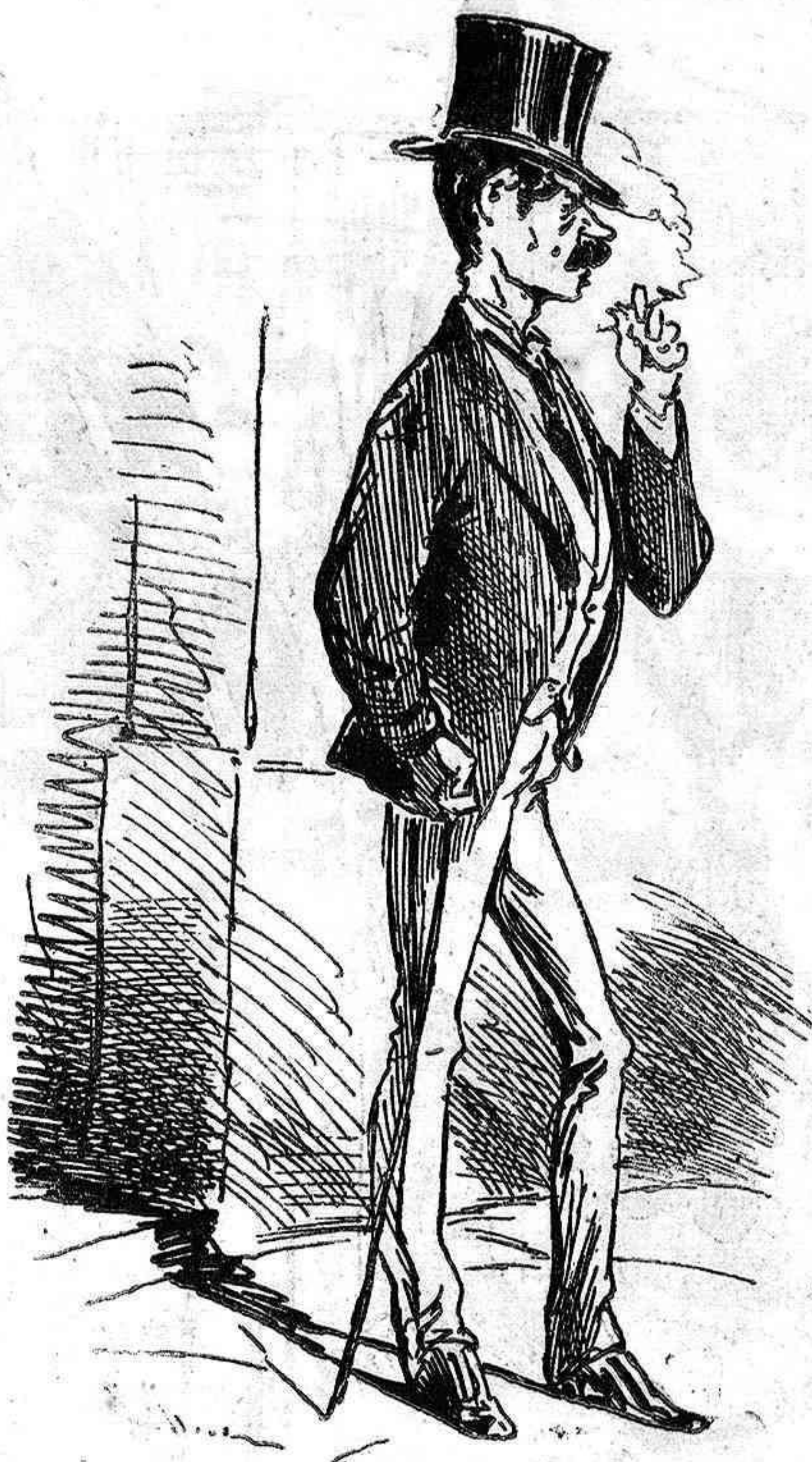
Se gana medio duro diario pescando incautos en la Carrera de San Gerónimo. Tiene título de Gancho de primera clase . ¡Ojo con él, forasteros!

Todas las semanas recibe por la noche, y da tés y chocolates, y bailan y se están divirtiendo también hasta el día; pero á mí no me importa; siempre saco algo; puntas de cigarro y otras cosas, que despues vendo por ahí.