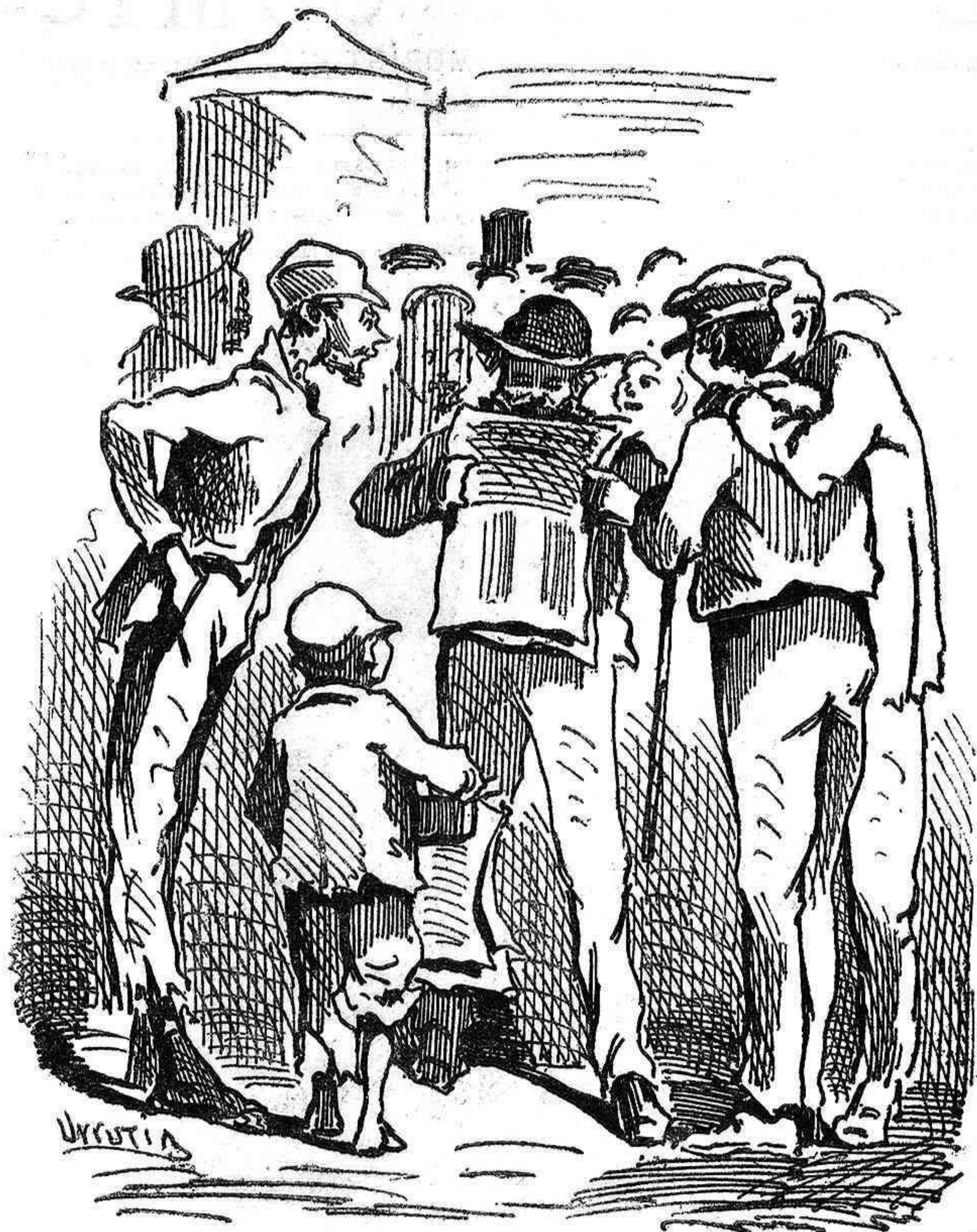
Uno leyendo.—«La votacion ha sido reñida...» Otro interrumpiendo.—¿Y quién ha podido más?