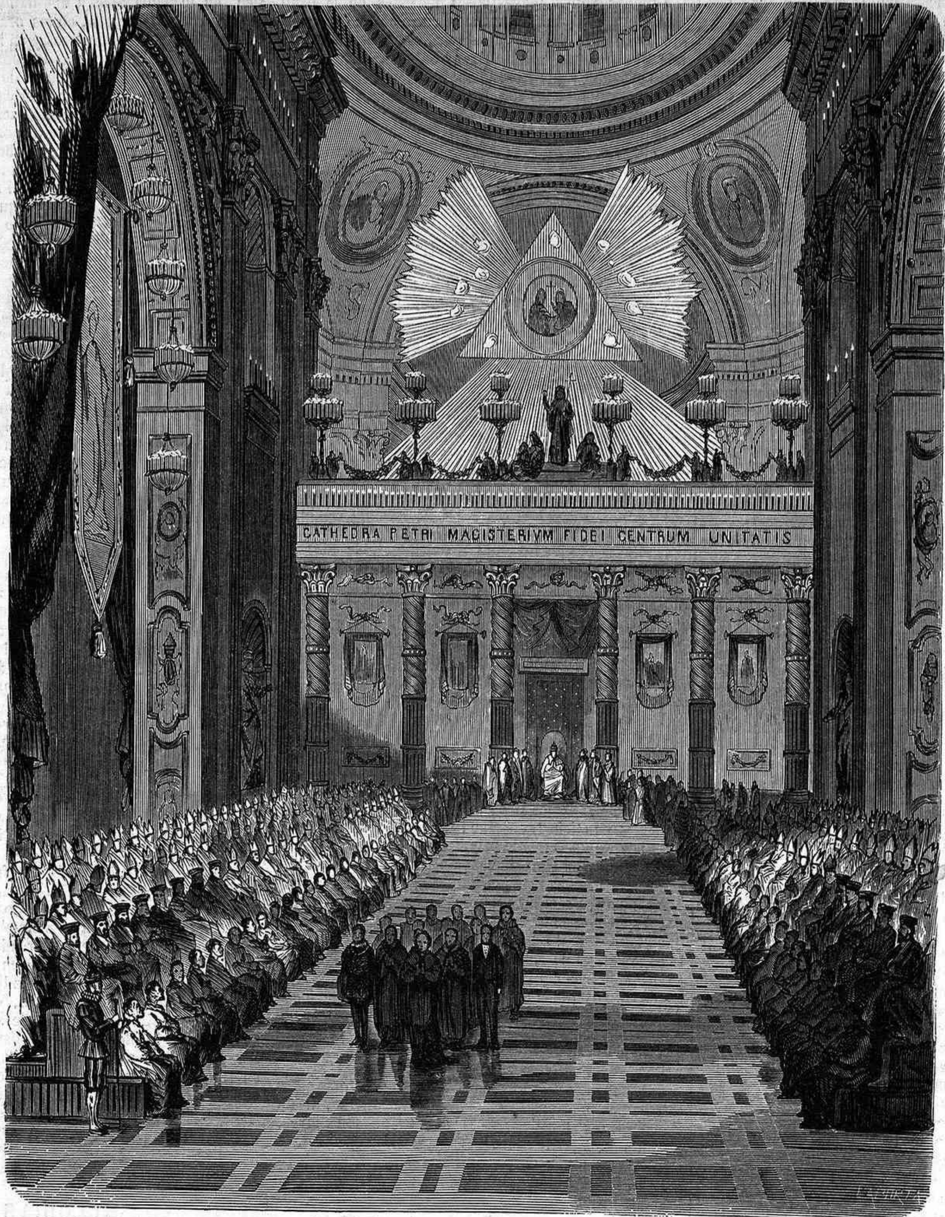
ACTO SOLEMNE DE LA CANONIZACION DE LOS SANTOS MÁRTIRES, EN ROMA.—GRABADO DE LA OBRA DE «ROMA EN EL CENTENAR DE SAN PEDRO».

largo rosario, al mismo tiempo que bendicen á su Profeta. La ciudad de Marruecos, una de las mayores de este imperio, y córte de los sultanes, presenta calles ir-