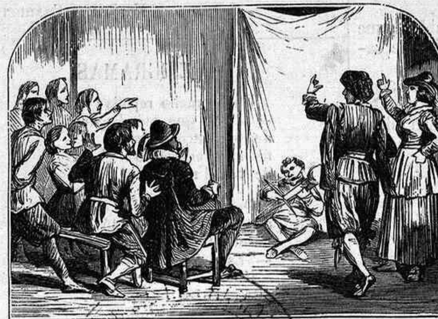
ENTREMÉS DEL RETABO DE LAS MARAVILLAS.

nivelar el presupuesto doméstico, el pobre marido se queda con la boca abierta, creyendo de buena fe que su mujer es un hacendista, y sobre todo un economista de primer orden.