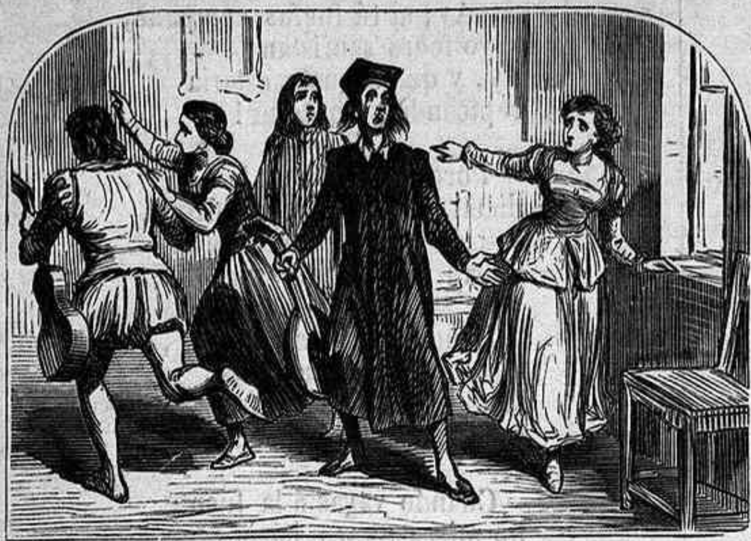
ENTREMÉS DE LA CUEVA DE SALAMANCA.