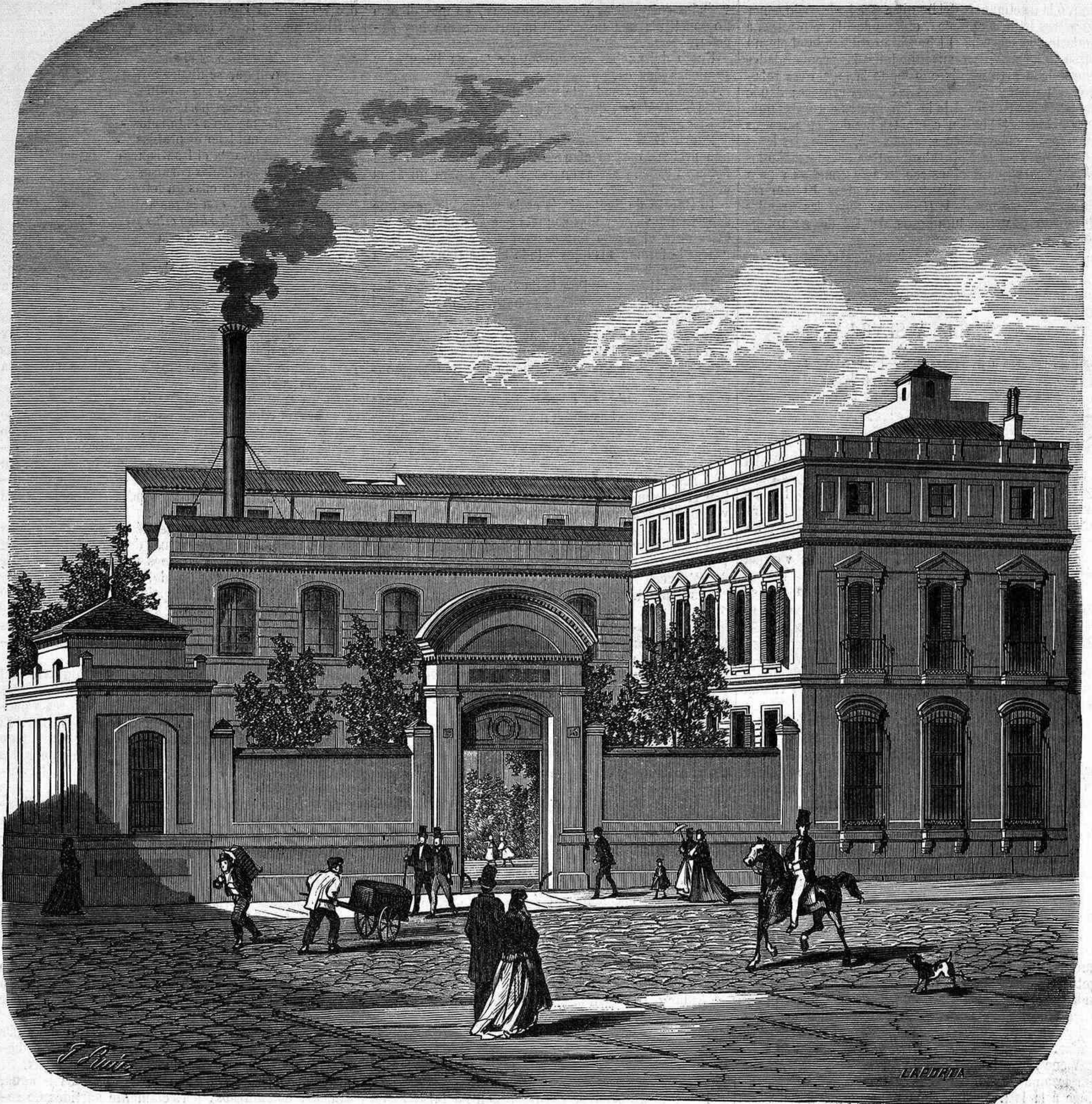
ESTABLECIMIENTO TIPOGRÁFICO DE GASPAR Y ROIG.—VISTA EXTERIOR DEL EDIFICIO.