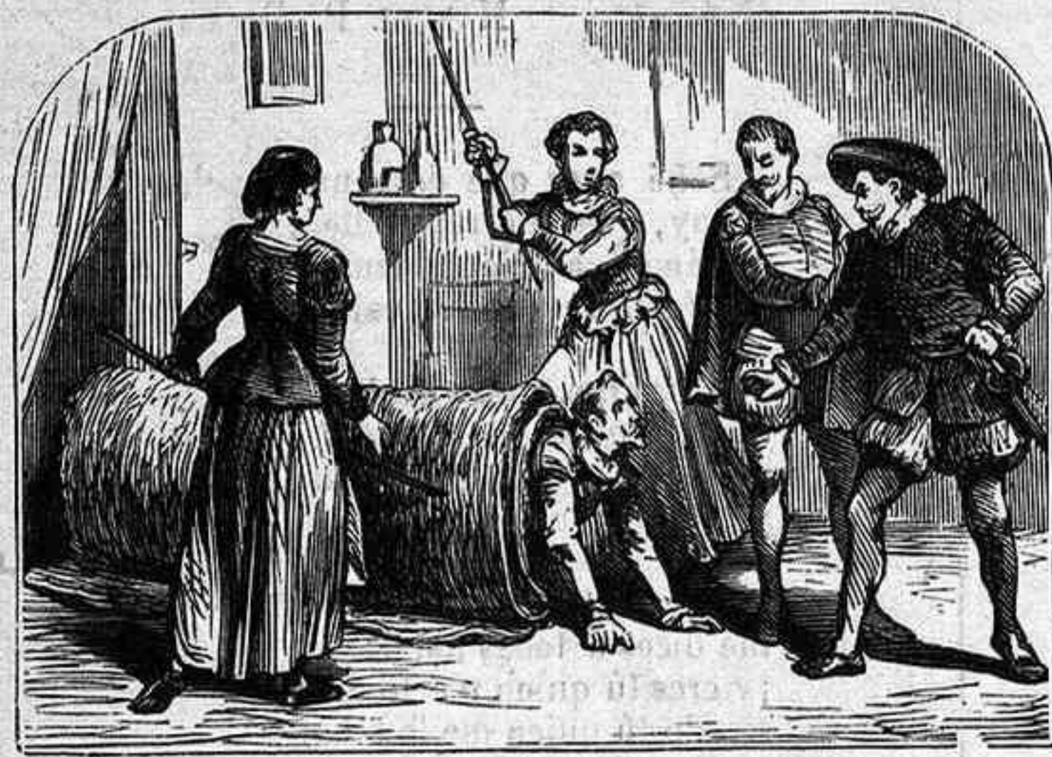
ENTREMÉS DE LOS HABLADORES.