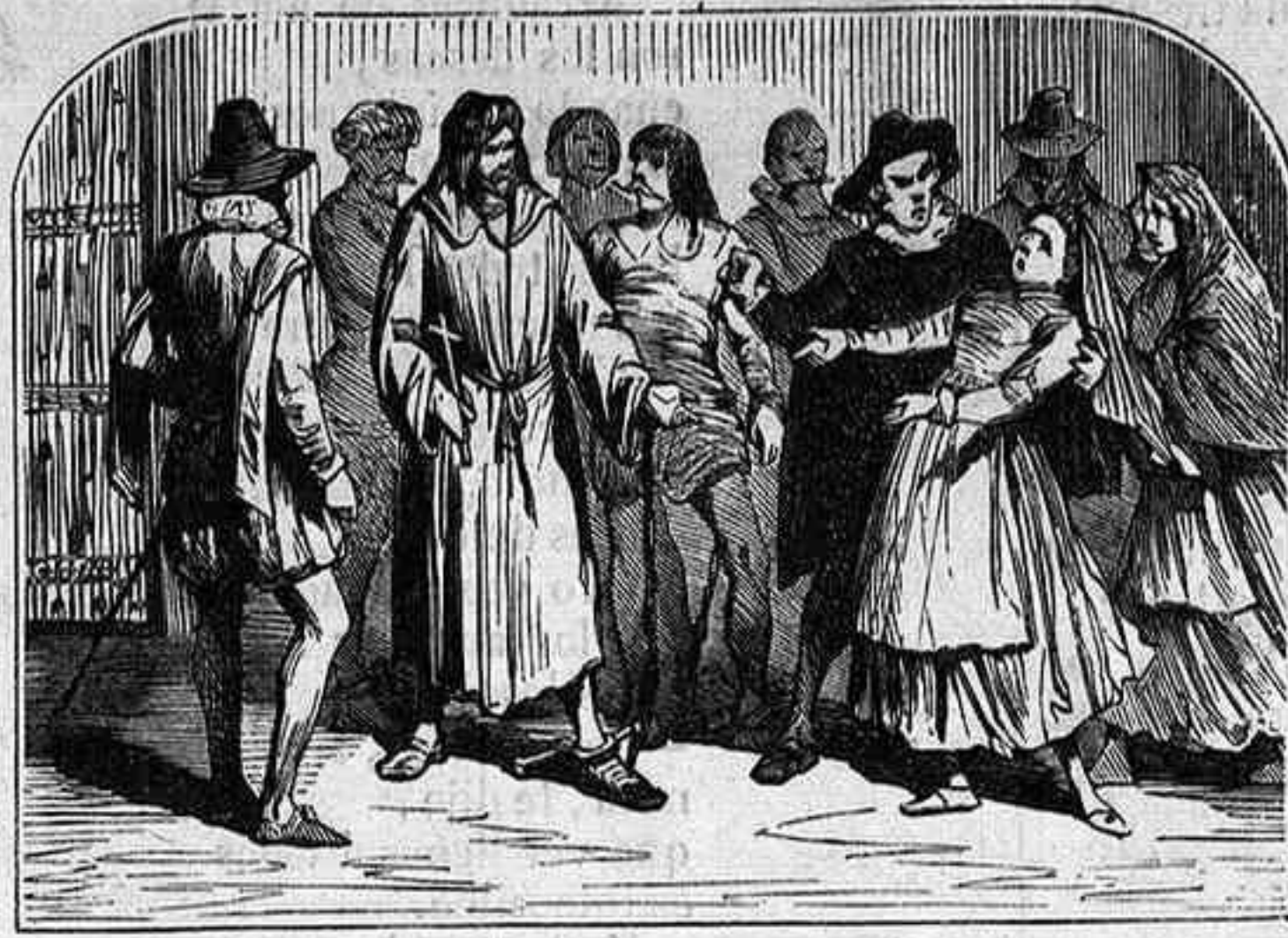
ENTREMÉS DE LA CARCEL DE SEVILLA.